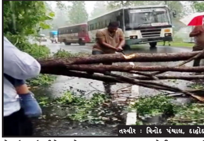
તસ્વીર : વિનોદ પંચાલ, દાહોદ

દાહોદ, રાજ્યના દુર્ગમ વિસ્તારમાં જ્યાં આવા-ગમન માટેના સાધનો અને વાહનોની સીમિત સગવડ છે. ત્યાં રાજ્ય સરકારના માર્ગ અને વાહન વ્યવહાર વિભાગની સેવા જ જનતા માટે આશીર્વાદરૂપ સાબિત થઈ રહી છે.