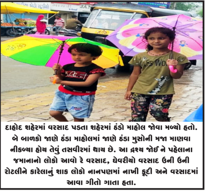
દાહોદ શહેરમાં વરસાદ પડતા શહેરમાં ઠંડો માહોલ જોવા મળ્યો હતો. બે બાળકો જાણે ઠંડા માહોલમાં જાણે ઠંડા મુસોની મજા માણવા નીકળ્યા હોય તેવું તસવીરમાં ધ્યાન છે. આ દ્રશ્ય જોઈને પહેલાના જમાનાનો લોકો આવો રે વરસાદ, ઘેવરીયો વરસાદ ઉની ઉની રોટલીને કારેલાનું શાક લોકો નાનપણમાં નાખી ફૂદી અને વરસાદમાં આવા ગીતો ગાતા હતા.