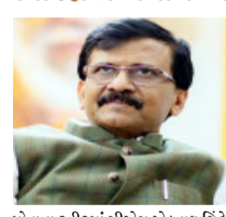
પોતાના ટ્વીટમાં સીએમ એકનાથ શિંદે અને કેબિનેટના સભ્યોને કોર્ટના નિર્ણયોની રાહ જોવાની માંગણી કરી છે.

મુંબઈ, શિવસેનાના સાંસદ સંજય રાઉતે દિવટ કરીને મહારાષ્ટ્રના રાજ્યપાલ ભગત સિંહ કોશ્યારીને રાજ્યમાં રાષ્ટ્રપતિ શાસન લાદવાની વિનંતી કરી છે. સંજય રાઉતે કહ્યું કે બાબાડોસ જેવા દેશમાં જ્યાં વસ્તી માત્ર ૨.૫ લાખ છે, ત્યાં ૨૭ મંત્રીઓ છે. પરંતુ મહારાષ્ટ્રની વસ્તી ૧૨ કરોડ હોવા છતાં અહીં કેબિનેટમાં માત્ર ૨ લોકો છે. આ બંને મંત્રીઓ રાજ્યને લગતા તમામ નિર્ણયો લઈ રહ્યા છે. તેથી જ્યાં સુધી સુપ્રીમ કોર્ટની ડિવિઝન બેંચનો નિર્ણય ન આવે ત્યાં સુધી મહારાષ્ટ્રમાં રાષ્ટ્રપતિ શાસન લાગુ કરવું જોઈએ. સંજય રાઉતે ટ્વીટ કરીને આ માંગણી કરી છે. તેણે