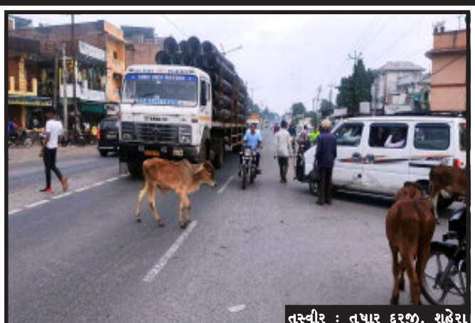
તસ્વીર : તુષાર દરજી, શહેરા

શહેરા, શહેરા નગરપાલિકા દ્વારા નગર વિસ્તારમાં જાહેર માર્ગો ઉપર રખડતા પશુઓને પકડી પાડવા માટેની કામગીરી હાથ ધરવામાં આવતા ત્રણ પશુઓને પાલિકાની ટીમ દ્વારા પકડી પાડવામાં આવ્યા હતા. જ્યારે ભાજપ સાથે જોડાયેલા અને પાલિકા વિસ્તારના વોર્ડ નંબર ત્રણના સભ્યના પતિ દ્વારા જાહેરાત કર્યા વગર પશુઓને પકડી પાડવા માટેની કામગીરી કરવામાં આવી રહી હોવાનું જણાવ્યું હતું. પાલિકાની આ કામગીરીને જાગૃત નગરજનોએ બિરદાવી હતી.