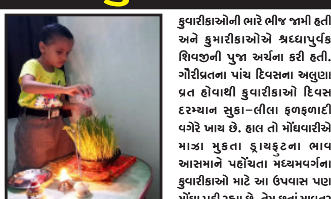
કુવારીકાઓની ભારે ભીજ જામી હતી અને કુમારીકાઓએ શ્રદ્ધાપુર્વક શિવજીની પુજા અર્ચના કરી હતી.

દાહોદ, પાંચ દિવસના ગૌરીપ્રતનું આજે સમાપન થનાર છે. ત્યારે આજે જાગરણનો દિવસ હોઈ અને આપત્તિ કાલે કુંવારીકાઓ જવારાઓનું વિરસર્જન કરશે. આજે જાગરણના દિવસે આખી રાત કુંવારીકાઓ જાગરણ કરી બીજા દિવસે જળાશયોમાં જુવારાનું વિરસર્જન કરનાર છે.