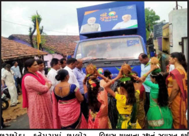
છરછોડા, ફતેપુરામાં ઇલોર, મોટીશેરો, ધાનપુરમાં અગાસવાણી, ઘોડાઝર સહિતના ગામોમાં પહોંચ્યા હતા. ગ્રામજનોએ વંદે ગુજરાત

દાહોદ, વંદે ગુજરાત વિકાસ યાત્રાના રથ આજે દાહોદમાં ગરબાડા, ફતેપુરા અને ધાનપુર તાલુકાના વિવિધ ગામોમાં પરિભ્રમણ કર્યું હતું. વંદે ગુજરાત વિકાસયાત્રાના રથનું ગ્રામજનોએ હરખભેર સ્વાગત કર્યું હતું. વિવિધ ગામોમાં યોજાયાલા કાર્યક્રમમાં લોકો મોટી સંખ્યામાં સહભાગી થયા હતા. ગ્રામજનોને સરકારી યોજનાઓથી માહિતગાર કરાયા હતા. તેમજ વિવિધ યોજનાઓના લાભની પણ વહેંચણી કરાઈ હતી.