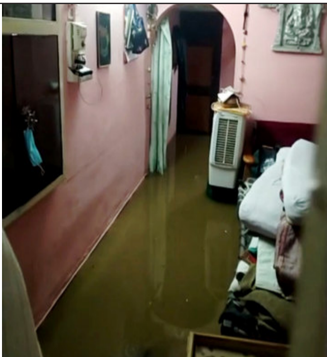
શિવ શક્તિ સોસાયટી (વાવડી બુઝર્ગ)