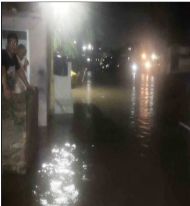
મેશરી નદીનો પટ વિસ્તાર