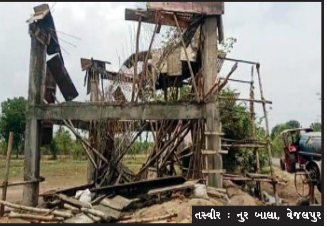
કોન્ટ્રાક્ટર અને ઈજનેરની ભ્રષ્ટાચારની પોલ ખુલી પાણીની ટાંકીનું કામ પૂર્ણ થાય તે પહેલાં સ્લેબ તૂટીને જમીન દોસ થતા

વેજલપુર, સરકાર દ્વારા વિવિધ યોજનાઓની લાખો રૂપિયાની ગ્રાન્ટો ફાળવવામાં આવે છે અને હાલ અનેક ગામોમાં નલ સે જલ યોજનાઓની લાખો રૂપિયાઓની ગ્રાન્ટો ફાળવવામાં આવી છે. ત્યારે કાલોલ તાલુકાના ઘૂસર ગામમાં નલ સે જલ યોજના અંતર્ગત પાણીની ટાંકીનું કામ લે ભાગુ કોન્ટ્રાક્ટર અને ઈજનેર દ્વારા પુરજોશમાં કરવામાં આવી રહ્યું છે. ત્યારે પાણીની ટાંકીના કામમાં ભ્રષ્ટાચાર આચાર્યો હોવાથી પાણીની ટાંકીનો સ્લેબ તૂટીને જમીન દોસ થયો જેથી