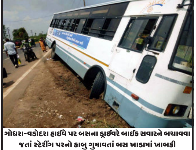
ગોધરા-વડોદરા હાઈવે પર બસના ડ્રાઈવરે ભાઈક સવારને બચાવવા જતાં સ્ટેરીંગ પરનો કાબુ ગુમાવતાં બસ ખાડામાં ખાબકી

લોકોમાં ચર્ચા કે હુજુ તો કામ પૂર્ણ થયો નથી તે પહેલાં તૂટી પડતા લોકોમાં ડરનો માહોલ કારણ કે હુજુ તો પાણીની ટાંકીમાં હજારો લીટર પાણી ભર્યા પેહલા સ્લેબ તૂટી પડતો હોય તો હજારો લીટર પાણી ભર્યા પછી તે ટાંકીની હાલત શું થશે તે પણ એક સવાલ થાય છે. જેથી આવા લેભાગુ કોન્ટ્રાક્ટર અને ઈજનેર સામે કાયદાકીય કાર્યવાહી થાય તે જરૂરી છે. તો શું આવા ભ્રષ્ટાચાર અને તકલાદી કામો કરનાર સામે પાણી પુરવઠાના જવાબદાર અધિકારી કાર્યવાહી હાથ ધરશે કેમ તે પણ એક મોટો સવાલ છે.