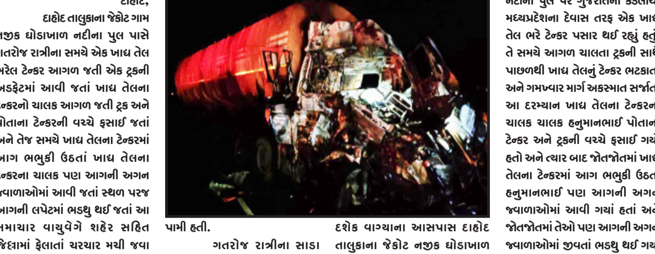
દાહોદ, દાહોદ તાલુકાના જેકોટગામ નજીક ઘોડાખાળ નદીના પુલ પાસે ગતરોજ રાત્રીના સમયે એક ખાદ્ય તેલ ભરેલ ટેન્કર આગળ જતી એક ટૂંકની અડફેટમાં આવી જતાં ખાદ્ય તેલના ટેન્કરનો ચાલક આગળ જતી ટૂંક અને પોતાના ટેન્કરની વચ્ચે ફસાઈ જતાં અને તેજ સમયે ખાદ્ય તેલના ટેન્કરમાં આગ ભભુકી ઉઠતાં ખાદ્ય તેલના ટેન્કરના ચાલક પણ આગની અગળ જવાનાઓમાં આવી જતાં સ્થળ પરજ આગની લપેટમાં ભડચુ થઈ જતાં આ સમાચાર વાચુવેગે શહેર સહિત જિલ્લામાં ફેલાતાં ચરચાર મચી જવા પામી હતી.