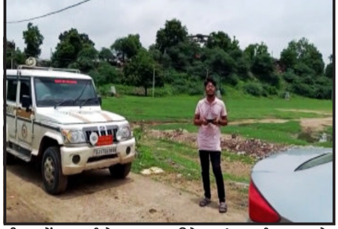
ફરિયાદ નોંધાવા પામી છે. ગોધરા ખાણ-ખનિજ વિભાગના રોયલ્ટી ઈન્સ્પેક્ટર

ખાણ-ખનિજ વિભાગ દ્વારા બેફામ બનેલા અને ગેરકાયદેસર રેતી ખનન કરતાં ખનિજ માફિયાઓને ઝડપી પાડવા માટે ડ્રોન કેમેરાની મદદ લેવાઈ છે.