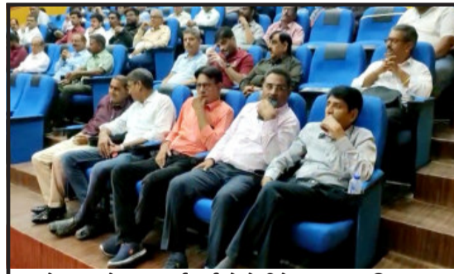
ગોધરા ખાતે આયુષ કંકટર્સ એસોશિએશન દ્વારા અભિવાદન સમારોહનું આયોજન કરાયું. આ સમારોહમાં પંચમહાલ અને મહિસાગર જિલ્લાના આયુષ તબીબો હાજર રહ્યા. ગોધરા ખાતે રાજ્યકક્ષાના આદિજાતિ મંત્રી નિમિષાબેન સુથારની ઉપસ્થિતિમાં આયુષ કંકટર્સ એસોશિએશન દ્વારા અભિવાદન સમારોહ યોજાયો હતો. આ કાર્યક્રમમાં રાજ્યમંત્રી નિમિષાબેન સુથાર સહિત ઉપસ્થિત તબીબોને સન્માન કરવામાં આવ્યું. આ સમારોહમાં પંચમહાલ અને મહિસાગર જિલ્લાના આયુષ તબીબો મોટી સંખ્યામાં હાજર રહ્યા હતા.

ગુજરાત રાજ્યમાં કથિત ભટ્ટા કાંડની ઘટના બાદ તમામ જીલ્લાઓ અને શહેરોમાં દેશી દારૂના અડ્ડાઓ તેમજ ભટ્ટીઓ ઉપર પોલીસ દ્વારા રેઈડ કરીને દારૂનો નાશ કરવામાં આવી રહ્યા છે. ત્યારે પંચમહાલ જિલ્લાના હાલોલ તાલુકાના ગ્રામ્ય વિસ્તારોમાં કથિત ભટ્ટાકાંડના બનાવ બાદ પણ દેશી દારૂની ભટ્ટીઓ ઘમઘમતી હોય તેવા મીડીયા અહેવાલ બાદ પોલીસ સક્રિય થઈને આવી દેશી દારૂની ભટ્ટીઓના નાશ કરી ગુનો નોંધાવામાં આવ્યો હતો. ત્યારે હાલોલ રૂલર વિસ્તારમાં ઘમઘમતી દેશી દારૂની ભટ્ટીઓ માટે જીલ્લા પોલીસવડાએ કાર્યવાહી કરી હાલોલ રૂલર પોલીસ મથકના ઈન્ચાર્જ એ.એસ.આઈ.ને સરપેન્ડ કરતાં પોલીસ બેડામાં ખડભડાટ મચી જવા પામ્યો.