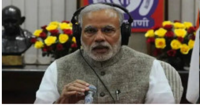
પીએમએ કહ્યું કે ૩૧ મી જુલાઈ એટલે કે આ દિવસે આપણે બધા દેશવાસીઓ શહીદ ઉધમની શહાદતને નમન કરીએ છીએ. હું

પર્વજનઆંદોલનનું સ્વરૂપ લઈ રહ્યો છે. થોડા અઠવાડિયા પહેલાં કણાટકમાં અમૃતા ભારતી કચડર્થી નામનું અનોખું અભિયાન શરૂ કરવામાં આવ્યું હતું. જેમાં રાજ્યમાં ૭૫ સ્થળોએ સ્વાતંત્ર્ય અમૃત પર્વને લગતા ભવ્ય કાર્યક્રમોનું આયોજન કરવામાં આવ્યું હતું. તેણે કણાટકના મહાન સ્વાતંત્ર્ય સેનાનીઓને યાદ કરવાનો તેમજ સ્થાનિક સાહિત્યિક સિદ્ધિઓને આગળ લાવવાનો પ્રયાસ કર્યો. મેઘાલયના બહાદુર યોદ્ધા યુ. તિરોતે સિંહની પુણ્યતિથિ પર લોકોએ તેમને યાદ કર્યાં. તિરોતે ખાસી પહાડીઓને અંકુશમાં લેવા અને ત્યાંની સંસ્કૃતિ પર હુમલો કરવાના અંગ્રેજોના કાવતરાનો વિરોધ કર્યો હતો.