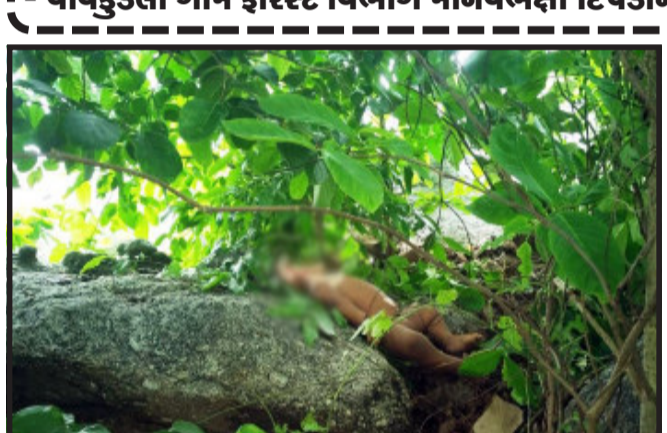
તસ્વીર : યોગેશ કનોજીયા, ઘોંઘા

ઘોંઘાના તાલુકામાં જંગલ વિસ્તારને અડીને આવેલ ગામોમાં દિપડાની રંજાડ વધી છે. અગાઉના વર્ષમાં પણ દિપડો માનવબક્ષી બનતા ચાર જેટલા બાળકોને ફાડી ખાવાના કિસ્સા બન્યા હતા. ત્યારે ફોરેસ્ટ વિભાગે ભારે જહેમત બાદ દિપડાને પાંજરે પુરતાં પંથકમાં રાહતનો શ્વાસ લીધો હતો. છતાં