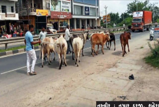
તસ્વીર : તુષાર દરજી, શહેરા

શહેરા, શહેરા નગરપાલિકા દ્વારા રખડતા પશુઓને પકડી પાડવા માટેની ઝુંબેશ હાથધરી હતી. સિંધી ચોકડી તેમજ બસ સ્ટેશન વિસ્તારમાંથી પાલિકાની ટીમે રસ્તા પર રખડતા સાત જેટલા પશુઓને પકડી પાડીને પાંજરાપોળ ખાતે મોકલી દેવામાં આવ્યા હતા.