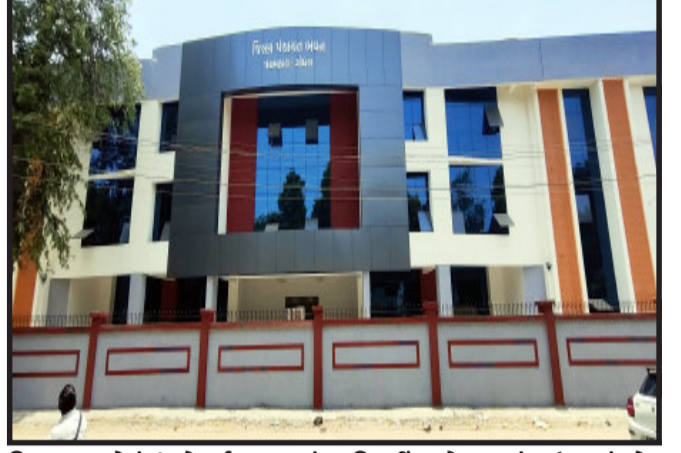
વિકાસના કામોનું ઈ-લોકાર્પણ કરવામાં આવ્યું હતું. આ ઈ-લોકાર્પણ કાર્યક્રમમાં ગોધરા ખાતે નિર્માણ થયેલ જિલ્લા પંચાયતના બિલ્ડિંગનું જે રૂપીયા ૨૩.૫ કરોડના ખર્ચે તૈયાર થયું છે. તેવા બિલ્ડિંગનું ઈ-લોકાર્પણ વડાપ્રધાનના વરદહસ્તે કરવામાં આવ્યું હતું. ગોધરા ખાતે નિર્માણ થયેલ જિલ્લા પંચાયત ભવનના નવા

ગોધરા, પંચમહાલના પાવાગઢ ખાતે વડાપ્રધાનની મુલાકાત દરમિયાન પાવાગઢ મંદિરના દ્યવજરોહન સહિત જિલ્લાના અનેક વિકાસના કામોનું ઈ-લોકાર્પણ કરવામાં આવ્યું હતું. આ ઈ-લોકાર્પણમાં ગોધરાની નવિન જિલ્લા પંચાયત ભવનનું ઈ-લોકાર્પણ કરવામાં આવ્યું હતું. ત્યારે હવે પંચમહાલ જિલ્લા પંચાયતના પ્રમુખ દ્વારા વડાપ્રધાનના હસ્તે થયેલ ઈ-લોકાર્પણ વાળી જિલ્લા પંચાયતની નવિન બિલ્ડિંગનું લોકાર્પણ કથા કરી કરશે કે રીબીનો કપાશે તે જોવું રહ્યું. પાવાગઢ ખાતે ૧૮ જુનના રોજ વડાપ્રધાન નરેન્દ્ર મોદી મુલાકાત માટે આવ્યા હતા. ત્યારે પાવાગઢ નીચ મંદિરના શિખર ઉપર ત્રણ દાયકા બાદ દ્યવજરોહણ તેમના વરદહસ્તે કરવામાં આવ્યું હતું. સાથે પંચમહાલ જિલ્લાના વિવિધ