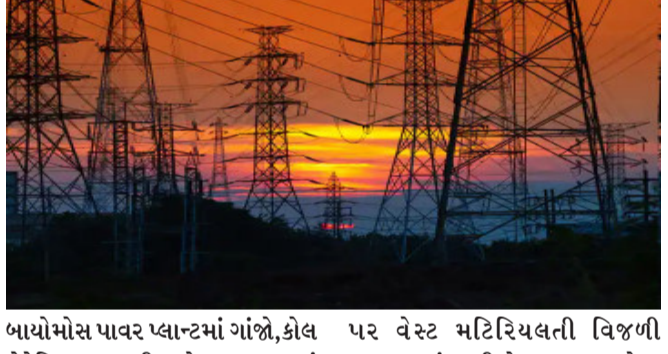
બાયોમાસ પાવર પ્લાન્ટમાં ગાંજા, કોલ મેટેરિયલ ભૂસાની સાથે સળગાવવામાં આવ્યા છે. આ પહેલા ગાંજાને ફર્નશ આઈલ ફેક્ટરીમાં સળગાવી નષ્ટ કરવામાં આવતો હતો પરંતુ બિલાસપુર રેંજના આઈજરતનલાલ ગંગીના નિર્દેશ

રાયપુર, છત્તીસગઢના બિલાસપુરના પાવર પ્લાન્ટમાં પહેલીવાર ગાંજાથી વિજળી ઉત્પાદન કરવામાં આવી છે. બિલાસપુર રેંજમાં જાત ૧૨ ટન ગાંજાને બાયોમાસ પ્લાન્ટમાં સળગાવી નષ્ટ કરવામાં આવ્યા છે. આ લગભગ એક કલાક સુધી સળગતો રહ્યો જેથી પ મેગાવોટ વિજળીનું ઉત્પાદન થયું રાજ્યમાં પહેલીવાર આવું થયા છે કે ગાંજાના નષ્ટકરણને વિજળી ઉત્પાદન માટે ઉપયોગમાં લેવામાં આવ્યો હોય. આ પહેલની હવે ભારે ચર્ચા થઈ રહી છે.