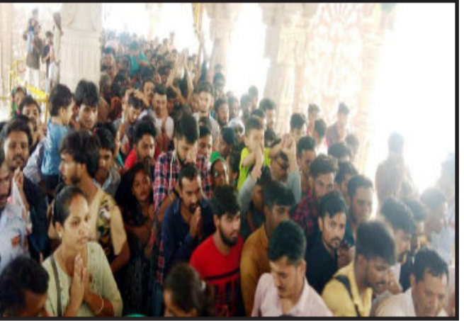
મળ્યો. પાવાગઢ યાત્રાધામના નવિનીકરણ બાદ યાત્રાળુઓને

પાવાગઢ, પંચમહાલના પાવાગઢ યાત્રાધામ ખાતે રવિવારના દિવસે યાત્રાળુઓનું ઘોડાપુર જોવા મળ્યું. એક દિવસમાં ૧ લાખ ઉપરાંત યાત્રાળુઓએ માતાજીના દર્શન કર્યા.