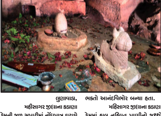
લુણાવાડા, મહીસાગર જિલ્લાના કડાણા

વડાપ્રધાન નરેન્દ્ર મોદીએ જગશાય યાત્રા, પંદરપુર યાત્રા, અમરનાથ યાત્રા, દક્ષિણ ભારતમાં સબરીમાલા યાત્રા નો ઉલ્લેખ કરી જણાવ્યું કે આ પ્રવાસો આપણને ગરીબોની સેવા કરવાની તક આપે છે. આ યાત્રાઓમાં એક ભારત, શ્રેષ્ઠ ભારતની ઝલક જોવા મળે છે. આ