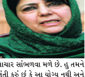
સમાચાર સાંભળવા મળે છે. હુ તમને વિનંતી કરું છું કે આ યોગ્ય નથી અને આ છોડી દેવું જોઈએ. કાશ્મીરી પંડિત પર હુમલા સંદર્ભે મુફતીએ કહ્યું કે લોકોને ધાર્મિક ગુરુઓએ આ વાતને ધ્યાનમાં લેવી જોઈએ કે પંડિત કાશ્મીરી સમાજનું ભાગ છે. કાશ્મીરી પંડિત આજે વિરોધ પ્રદર્શન કરી રહ્યાં છે. મારા સીએમ નરીકેના કાર્યકાળ દરમ્યાન જ્યારે સ્થિતિ ખરાબ હતી ત્યારે કોઈ કાશ્મીરી પંડિતને મારવામાં આવ્યું ન હતું. તેઓ ઘરે ધોવા છતાં અમે ૧૭ મહિનાનો પગાર ચૂકવ્યો હતો.

શ્રીનગર, જમ્મુ અને કાશ્મીર અશાંતિભર્યાં તબક્કામાંથી પસાર થઈ રહ્યું છે હુ તમને વિનંતી કરું છું કે આ યોગ્ય નથી અને આ છોડી દેવું જોઈએ પીડીપી પાર્ટીની ચીફ મહેબુબા મુફતીએ જણાવ્યું કે જમ્મુ-કાશ્મીરના યુવાનોએ આતંકવાદથી દૂર રહેવું જોઈ અને પોતાના જીવનને બચાવવું જોઈએ. દરરોજ ૩-૪ યુવાનો માર્યા જાય છે, તેવા અહેવાલ સાંભળવા મળે છે, એનો અર્થ એ થાય છે કે સ્થાનિક લોકોની ભરતી કરવામાં આવે છે. મુફતીએ વધુમાં જણાવ્યું કે હુ માતા પિતા અને બાળકોને વિનંતી કરું છું કે તેઓ પોતાનો જીવ બચાવે. તેમણે કહ્યું કે જમ્મુ અને કાશ્મીર અશાંતિભર્યાં તબક્કામાંથી પસાર થઈ રહ્યું છે અને આવાના સમયમાં તેને તેના યુવાનોની જરૂર પડશે. કોઈએ પણ હથિયાર ઉપાડવા નહિ. દરરોજ ૪-૫ યુવાનોની મોતના