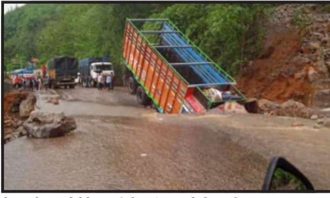
અસમમાં આશરે ૭ હજાર ગામડામાં પૂર આવ્યું છે અને ૪૩૦૦૦ હેક્ટર કૃષિ ભૂમિ પાણીમાં ડૂબી ગઈ છે. ઘણા બાંધ, પુલ અને રસ્તાને નુકસાન પહોંચ્યું છે. હોજઈ જિલ્લામાં પૂર્વ પ્રભાવિત લોકોને લઈને જઈ રહેલી એક હોડી ડૂબી ગઈ, જેમાં ત્રણ બાળકો લાપતા

વરસી રહેલાં વરસાદ બાદ પૂરને કારણે રાજ્યમાં ૧૦ હજારથી વધુ લોકો બેઘર થયા છે. તો છેલ્લા એક મહિનાથી ટ્રેન સેવાને અસર પડી છે. અધિકારીઓએ કહ્યું કે આ વચ્ચે રાષ્ટ્રીય રાજમાર્ગ-૬ પર ભારે વરસાદને કારણે આવેલા ભૂસ્ખલન બાદ ગુરુવારે ત્રિપુરા અને દેશના બાકી ભાગ વચ્ચે જમીની સંપર્ક તૂટી ગયો. પૂરનો પ્રકોપ પશ્ચિમ ત્રિપુરા જિલ્લામાં અગરતલા અને તેની આસપાસના વિસ્તાર સુધી સીમિત છે, જ્યાં હાલમાં નદીનું જળસ્તર ખુબ વધી ગયું છે અને અગરતલા કોર્પોરેશન તથા તેના નિયાંત્રણવાળા વિસ્તાર પાણીમાં ડૂબી ગયા છે. પાડોશી રાજ્ય અરૂણાચલ પ્રદેશમાં સુબનસિરી નદીના પાણીએ એક બાંધને જળમગ્ન કરી દીધો છે, જ્યાં એક હાઈડ્રોઇલેક્ટ્રિક પ્રોજેક્ટનું કામ ચાલી રહ્યું હતું. મેઘાલય, અસમ, ઉપ-હિમાલયી પશ્ચિમ બંગાળ અને સિક્કિમના અલગ-અલગ ભાગ પર વધુ વરસાદ નોંધાયો છે અને નાગાલેન્ડ અને ત્રિપુરામાં પણ ભારે વરસાદ થયો છે. મહિપુરાના ઈશ્વાલ વેસ્ટ જિલ્લામાં પૂરને કારણે એક વ્યક્તિના મોત બાદ કુલ મૃત્યુઆંક વધીને સાત થઈ ગયો છે. ઈશ્વાલમાં શનિવારે સવારે વરસાદ ઓછો થયો પરંતુ થાઉબલ, ઈશ્વાલ વેસ્ટ અને બિષ્ણુપુરમાં સ્થિતિમાં હજુ સુધાર થયો છે. સરકારી સૂત્રોએ જણાવ્યું કે મેઘાલયના મૌસિનરામ અને ચેરાપૂંજીમાં ૧૮૪૦ બાદથી રેકોર્ડ વરસાદ થયો છે. સરકારી સૂત્રોએ જણાવ્યું કે ઇલ્લા ૬૦ વર્ષમાં અગરતલામાં આ ત્રીજો સૌથી વધુ વરસાદ છે. અચાનક આવેલા પૂરને કારણે તમામ શિક્ષણ સંસ્થાઓ બંધ કરી દેવામાં આવી છે. મેઘાલયના મુખ્યમંત્રીએ પૂરમાં મૃત્યુ પામેલા લોકોના પરિવારજનોને ચાર લાખની સહાયતા આપવાની જાહેરાત કરી છે.