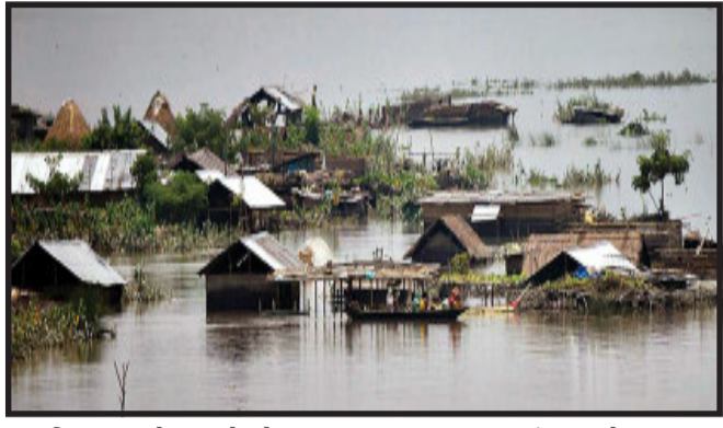
પ્રભાવિત થયા છે, જ્યારે એક લાખ જેટલા લોકો રાહત શિબિરમાં છે. પૂરમાં અસમમાં ૧૨ તો મેઘાલયમાં ૧૮ લોકોના મોત થયા છે. ત્રિપુરાની રાજધાની અગરતલા પણ પૂરનો સામનો કરી રહી છે. શહેરમાં માત્ર ૬ કલાકમાં ૧૪૫ મિમી વરસાદ થયો છે.

નવીદિલ્હી, ભારે વરસાદ બાદ આવેલા પૂર અને ભૂસ્ખલનને કારણે પૂર્વોત્તરના વિસ્તારમાં તબાહી મચી છે. અસમ, મેઘાલય, ત્રિપુરા અને અરૂણાચલ પ્રદેશમાં લાખો લોકો આ પૂરથી પ્રભાવિત થયા છે. અહીં ઘણા લોકો બેઘર થયા, પાક નષ્ટ થયો, રસ્તા તૂટી ગયા અને રેલ સેવાને પણ અસર પડી છે. તો પૂરને કારણે મૃત્યુઆંકમાં પણ વધારો થઈ રહ્યો છે. કુદરતના કહેર સામે લોકો અનેક મુશ્કેલીનો સામનો કરી રહ્યાં છે. સરકારે શરૂ કરેલી રાહત શિબિરોમાં લોકો હાલ પોતાના દિવસો પસાર કરી રહ્યાં છે.