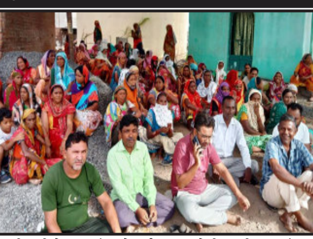
આવી નથી તે કરવામાં આવે વર્ષ ૨૦૧૪-૧૫ થી અત્યાર સુધી સફાઈ કામદારોના પગાર માંથી કપાત થતાં પી.એફ. જમા કરાવવામાં આવ્યા નથી. તે જમા કરાવવામાં આવે. ૩૬ ૨૦૧૩ના વર્ષમાં ૭૦ સફાઈ કામદારોની ભરતી કરવામાં આવી હતી. તેવા કર્મચારીને ૧૨,૨૪,૩૬૫ના તફાવત મળે તેમજ કાયમી સફાઈ કામદારોને ૧૮,૫૦૦/- રૂપિયા મુજબ ચુકવણું કરવામાં આવે. ૩૬ સફાઈ કામદારોની ભરતી પાલિકાએ

ગોધરા, ગોધરા નગર પાલિકાના સફાઈ કામદારોના છેલ્લા ચાર માસના પગાર તેમજ નિવૃત્ત સફાઈ કામદારોના પેન્શન નહી ચુકવવામાં આવતાં તેમજ પડતર માંગણીઓ જેવી કે, ૩૬ સફાઈ કામદારોની ભરતી કરવાની પ્રક્રિયા પુરી કરવાની માંગ સાથે ૭ દિવસનો સમય આપવામાં આવ્યો હતો. તે દરમિયાન સફાઈ કામદારોના પ્રશ્નોનું નિરાકરણ નહી આવતાં આજરોજ સફાઈ કામદારો અચોકકસ મુદતની હસ્તાળ ઉપર જતાં શહેરના મુખ્ય માર્ગો ઉપર ગંદકીનું સામ્રાજ્ય જોવા મળ્યું. ગોધરા નગર પાલિકાના સફાઈ કામદારો તેમજ નિવૃત્ત સફાઈ કામદારોને છેલ્લા ચાર મહિનાનો પગાર અને પેન્શન ચુકવણી કરવામાં