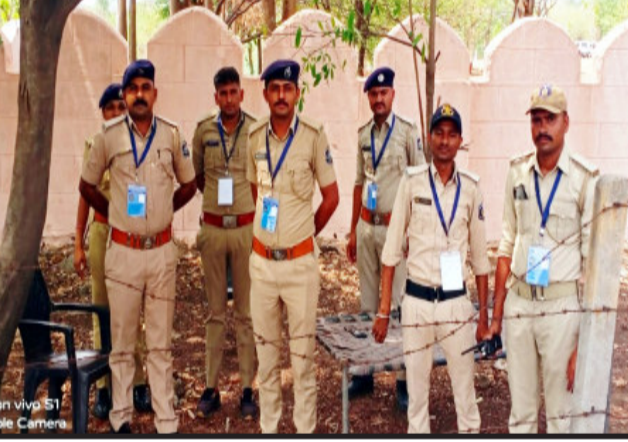
બરાબર ૧૧ વર્ષ બાદ વડાપ્રધાન નરેન્દ્રભાઈ મોદીના મુલાકાતને લઈ એલર્ટ તંત્ર કામે લાગી ગયું છે અને જિલ્લાની પ્રજામાં પણ વડાપ્રધાનની મુલાકાતને લઈને અનેરો ઉત્સાહ તેમ જ ધનગનાટ જોવા મળી રહ્યો છે. ઉદ્દેશનીય છે કે, તારીખ ૧૮ ના રોજ વડાપ્રધાન નરેન્દ્રભાઈ મોદી સૌપ્રથમ પાવાગઢ ખાતે મહાકાળી માતાના મંદિરે ધ્વજરોહણ કરી ત્યારબાદ વિરાસત વનની મુલાકાત લેશે અને ત્યાર પછી વડાપ્રધાન નરેન્દ્રભાઈ મોદી વડોદરા ખાતે જનાર હોવાનું જાણવા મળ્યું છે.

ગો ધરા, વડાપ્રધાન નરેન્દ્ર મોદીની મુલાકાત ને લઈ પાવાગઢ તથા વિરાસત વન ખાતે તડામાર તૈયારીઓ શરૂ કરી દેવામાં આવી છે. ગુજરાતના પત્રો અને ભારતના ચશસ્વી વડાપ્રધાન નરેન્દ્રભાઈ મોદી આગામી ૧૮ જૂનના રોજ પંચમહાલ જિલ્લાની મુલાકાતે આવી રહ્યા છે અને તેમાં પણ ખાસ કરીને વડાપ્રધાન શ્રી પાવાગઢ ખાતે મહાકાળી માતાનું મંદિરનો ધ્વજરોહણ પોતાના હસ્તે કરવાના હોવાથી પાવાગઢ મહાકાળી માતાના મંદિરે તેમજ સમગ્ર વિસ્તારમાં વડાપ્રધાનની મુલાકાતને લઈને તડામાર તૈયારીઓ ચાલુ કરી દેવામાં આવી છે. મહાકાળી ધામની મુલાકાત બાદ વડાપ્રધાન નરેન્દ્રભાઈ મોદી વિરાસત વનની પણ મુલાકાત લેવાના છે. ઉદ્દેશનીય છે કે, ૨૦૧૧માં નરેન્દ્ર ભાઈ મોદી ગુજરાતના મુખ્યમંત્રી હતા. ત્યારે તેઓના હસ્તે જ વિરાસત વનનું પાવાગઢ નજીક લોકાર્પણ કરવામાં આવ્યું હતું. જેના