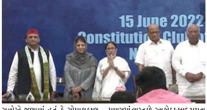
15 June 2022 Constitution Club

નવીદિલ્લી, રાષ્ટ્રપતિની ચૂંટણીમાં સત્તાપક્ષના ઉમેદવારની સામે કયો ઉમેદવાર ઊભો રાખવો તેની ચર્ચા કરવા માટે મમતા બેનરજીની આગેવાનીમાં ૧૭ વિપક્ષી પાર્ટીઓની એક મોટી બેઠક મળી હતી જેમાં મમતાએ ગોપાલ ગાંધી અને જમ્યુ કાશ્મીરના પૂર્વ મુખ્યમંત્રી ફારુક અબ્દુલ્લાના નામનો પ્રસ્તાવ મૂક્યો હતો. આ બેઠકમાં બેઠકમાં ૧૭ પાર્ટીઓના નેતા હાજર રહ્યા હતા.