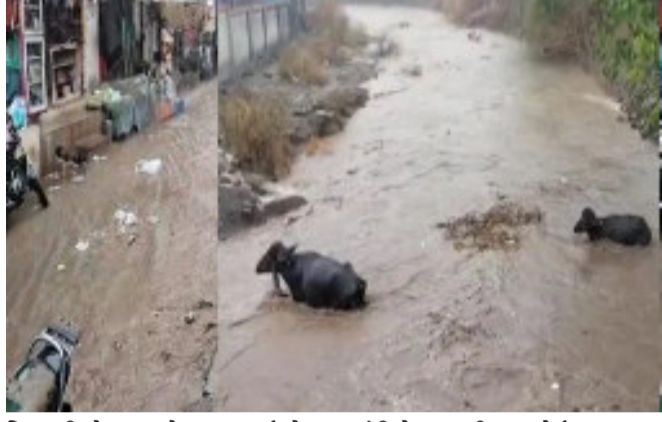
દિવસથી મેઘરાજાએ દસ્તક દઈ હેત વરસાવી રહ્યા છે. જિલ્લાના ઘણા વિસ્તારોમાં ભકારા અને ઉકળાટના કારણે લોકો ગરમીથી ત્રાહિમામ પોકારી ઊઠ્યા હતા અને આકાશ તરફ આશ માંડી મેઘરાજાની રાહ જોઈ રહ્યા હતા.

જૂનાગઢ, જૂનાગઢ જિલ્લાના તમામ તાલુકાના વાતાવરણમાં ગત રાત્રિથી આવેલા પવટા બાદ આજ સવારથી સાર્વત્રિક વરસાદ વરસી રહ્યો છે. જિલ્લાના માણાવદરમાં અઢી ઈંચ તેમજ માંગરોળમાં દોઢ ઈંચ જેટલો વરસાદ વરસી ચૂક્યો છે. માણાવદર શહેર અને પંથકમાં ભારે વરસાદના પગલે નીચાણવાળા વિસ્તારોમાં પાણી ભરાવા લાગ્યું હતું. જિલ્લામાં પડી રહેલા સાર્વત્રિક વરસાદના પગલે વાતાવરણમાં અનેરી ઠંડક પ્રસરી ગઈ છે તેમજ ખેડૂતો પણ ખુશખુશાલ જોવા મળી રહ્યા છે.