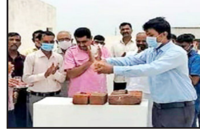
ઉપર જ આયોજન કરી તાલુકાના અધિકારીઓ અને પદાધિકારીઓની ઉપસ્થિતિમાં ખાતમુહૂર્ત કરવામાં આવ્યું હતું. આ આખે આખી ઘટના જાણે વિસરાઈ ગઈ હોય તેમ આજ લાયબ્રેરીનું સંજેલી તાલુકા પંચાયત ખાતે પુનઃ બીજીવાર વિધાનસભાના દંડક રમેશભાઈ કટારાના વરદહસ્તે ખાતમુહૂર્ત કરવામાં આવતા આ લાયબ્રેરીનું આ રીતે વારંવાર ખાતમુહૂર્ત કરવામાં આવશે કે પછી બિલ્ડીંગનું બાંધકામ કરી લાયબ્રેરી ખુદી મુકવામાં આવશે તે પણ એક લોકોમાં ચર્ચાનો વિષય બન્યો છે. સાથે સાથે એક જ લાયબ્રેરીનું બીજી વખત ખાતમુહૂર્ત કરાતા લોકોમાં આશ્ચર્ય સર્જાયું છે.

દાહોદ, તાલુકા પંચાયત કચેરીમાં ૧૦ માસ અગાઉ તત્કાલીન તાલુકા વિકાસ અધિકારી અને અન્ય મહાનુભાવોના હસ્તે નવીન લાયબ્રેરીનું ખાતમુહૂર્ત કરવામાં આવ્યું હતું. જેથી નગરના બીજી વખત ગત રોજ તારીખ ૨-૬-૨૦૨૨ ને ગુરૂવારના રોજ વિધાનસભાના દંડકના હસ્તે આજ લાયબ્રેરીનું ફરીવાર ખાતમુહૂર્ત કરવામાં આવતા નગરજનોમાં ભારે આશ્ચર્ય સર્જવાની સાથે સાથે બીજી વખતના ખાતમુહૂર્તના મામલે અનેક પ્રકારના તર્ક વિભાગોના કર્મીઓને નોટીસ આપી ખુલાસો માંગો રહ્યો.