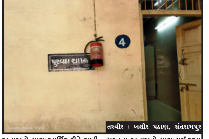
તસ્વીર : ખશીર પડાણ, સંતરામપુર

સંતરામપુર, સંતરામપુર તાલુકામાં NFSA રેશનીંગ ગ્રાહકોના સંતરામપુર તાલુકાના ૩૫૦૨૬ ની સંખ્યા ધરાવતા તપાસ હાથ ધરવામાં આવશે. સંતરામપુર તાલુકામાં ગુજરાત સરકાર અને મહિસાગર જિલ્લાના ગામ મામલતદારના આદેશ મુજબ રેશનીંગ ગ્રાહકોમાં સરકારના નિયમ મુજબ સરકારી નોકરી, બાઈક, ફોરવોલ્ટર તમામ વસ્તુઓથી જણાશે તો કાયદેસરની કાર્યવાહી કરીને રેશનીંગ કાર્ડ માંથી પરત ખેંચવામાં આવશે અને ફોજદારી ગુનો દાખલ કરવામાં આવશે. મહિસાગર જિલ્લાના મામલતદાર જાહેર નીતીના પરિપત્ર બહાર પાડવામાં આવેલો હતો. જિલ્લાના તમામ તાલુકા અને સંતરામપુર તાલુકામાં ૩૫૦૨૬ રેશનીંગકાર્ડના ગ્રાહકો પર ભાજ નજર રાખવામાં આવશે એન.એફ.એસ.એ યોજના ગરીબોનું વિતરણ કરવામાં આવતા મફત