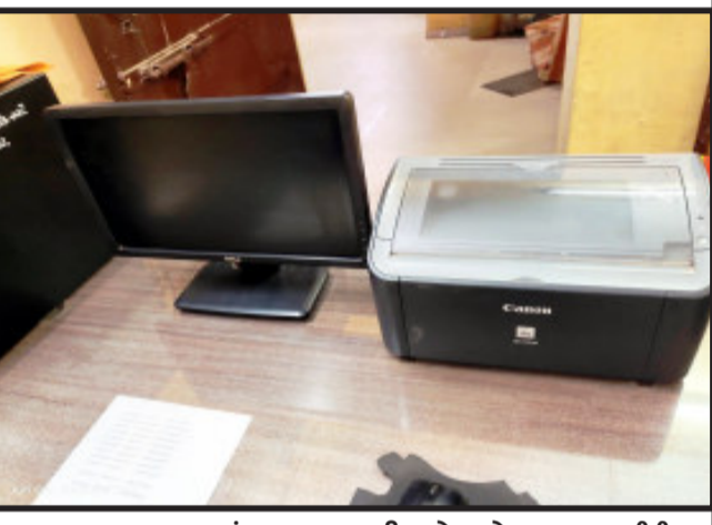
સંતરામપુર, પોલીસ સ્ટેશનમાં વોલ્ટેજ વધવાના કારણે સાત જેટલા કોમ્પ્યુટર બળી ગયા છે. હાલમાં વોલ્ટેજ વધવાના કારણે પોલીસ સ્ટેશનના કમ્પ્યુટર અને મોટાપાયે નુકસાન થયું હતું અને કોમ્પ્યુટર બગડી ગયા હતા. હાલના સમયમાં દરેક જગ્યાએ આધુનિક જમાનામાં કોમ્પ્યુટરનો ઉપયોગ કરવામાં આવતો હોય છે અને સોથી વધારે કોમ્પ્યુટર કામગીરી થતી હોય છે. ત્રણ દિવસથી કોમ્પ્યુટર બંધ રહેવાના કારણે કામગીરી કરવામાં બારે મુશ્કેલી પડી રહી છે.