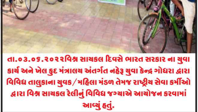
તા.૦૩.૦૬.૨૦૨૨ વિશ્વ સાયકલ દિવસે ભારત સરકાર ના યુવા કાર્ય અને ખેલ કુદ મંત્રાલય અંતર્ગત નહેરૂ યુવા કેન્દ્ર ગોધરા દ્વારા વિવિધ તાલુકાના યુવક/મહિલા મંડળ તેમજ રાષ્ટ્રીય સેવા કર્મીઓ દ્વારા વિશ્વ સાયકલ રેલીનું વિવિધ જગ્યાએ આયોજન કરવામાં આવ્યું હતું.