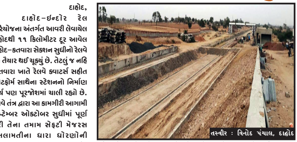
તસ્વીર : વિનોદ પંચાલ, દાહોદ

દાહોદ, દાહોદ-ઈન્દોર રેલ પરિયોજના અંતર્ગત આયરી લેવાયેલ દાહોદથી ૧૧ કિલોમીટર દૂર આવેલ દાહોદ-કતવારા સેક્શન સુધીનો રેલવે ટ્રેક તૈયાર થઈ ચૂક્યું છે. તેવું જ નહિ કાતવારા ખાતે રેલવે ક્વાર્ટર્સ સહીત પ્લેટફોર્મ સાથેના સ્ટેશનનો નિર્માણ કાર્ય પણ પૂરજોશમાં ચાલી રહ્યો છે. રેલવે તંત્ર દ્વારા આ કામગીરી આગામી સપ્ટેમ્બર ઓક્ટોબર સુધીમાં પૂર્ણ કરી તેના તમામ સેક્ટોર મેજરસ (સલામતીના ધારા ધોરણોની તપાસણી કરવાનું લક્ષ્ય બનાવ્યું છે. અને રીતે સ્થળ ઉપર કામગીરી કરાઈ રહી છે. પરંતુ હાલ સુધી પૂર્ણ થયેલ ૭૦ થી ૭૫ ટકા કામગીરી પછી પણ કામની ગતિ અને સ્થાનિક પ્રતિકૂળતાઓના કારણે આ કામ ડિસેમ્બર જાન્યુઆરી સુધી પૂર્ણ થવાની ધારણા ત્યાં ખુદ કામ કરતા શ્રમજીવીઓ અને સંબંધિતોનું કહેવું છે.