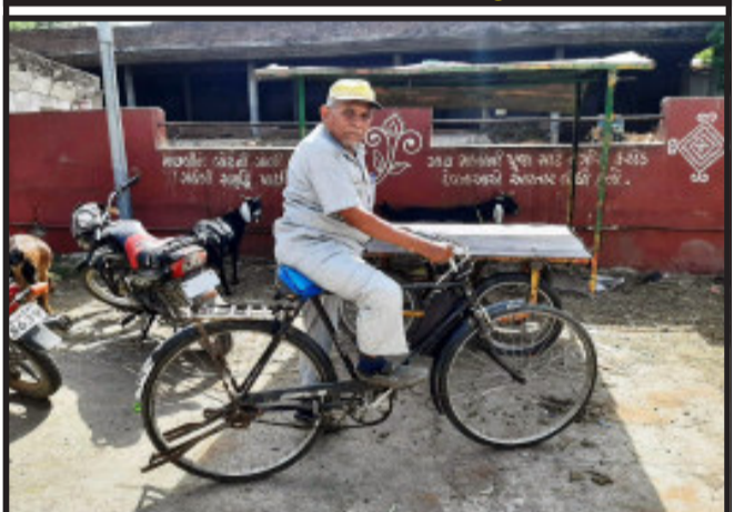
તસ્વીર : ચોગેશ કનોજીયા, ઘોઘંબા