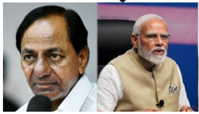
વડાપ્રધાન નરેન્દ્ર મોદી અને એ.ય.ડી. દેવગોડા સાથે જનતા દળ (સેક્યુલર)ના પ્રમુખ

હૈદરાબાદ, તેલંગાણાના મુખ્યમંત્રી કે. ચંદ્રશેખર રાવ, વડાપ્રધાન નરેન્દ્ર મોદી હૈદરાબાદ પહોંચે તેના થોડા કલાક અગાઉ જ ગુરુવારે સવારે બેંગ્લોર જવા માટે રવાના થઈ ગયા. એમ ૪ મહિનામાં બીજી વખત થયું છે જ્યારે કે. ચંદ્રશેખર રાવે વડાપ્રધાન નરેન્દ્ર મોદીના હૈદરાબાદ પ્રવાસ દરમિયાન મળતા દૂરી બનાવી