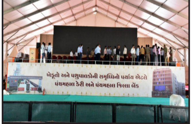
મત્સ્યોદયોગ, ભારત સરકાર કેબિનેટ મંત્રી, પરશોત્તમભાઈ રૂપાલા, ભા.જ.પા.પ્રદેશ અધ્યક્ષ સી.આર.પાટીલની પ્રેક્ષ ઉપસ્થિતિમાં

ગોધરા, પંચમહાલ જિલ્લામાં કેન્દ્રીય ગૃહ અને સહકાર મંત્રી, ભારત સરકાર અમિતભાઈ શાહના અધ્યક્ષસ્થાને ૨૯મી મે-૨૦૨૨ ના રોજ સવારે ૦૮.૦૦ કલાકે, ધી પંચમહાલ જિલ્લા સહકારી દૂધ ઉત્પાદક સંઘ લી. ના ઓકિસજન પ્લાન્ટ અને પંચમહાલ કિરિટકોટ કો.ઓ.બેન્કના નવનિર્મિત ભવનનું લોકાર્પણ તેમજ પંચામૃત બટર કોલ્ડ સ્ટોરેજ (તાડવા) અને પંચામૃત ડેરી પ્લાન્ટ (માલેગાંવ - મહારાષ્ટ્ર)નું ઈ-લોકાર્પણ તથા પંચામૃત ડેરી પ્લાન્ટ (ઉજ્જૈન-મધ્યપ્રદેશ)નો ઈ-શિલાન્યાસ સમારોહ યોજાશે. તેમાં મુખ્યમંત્રી ભુપેન્દ્રભાઈ પટેલ, ગુજરાત સરકાર, કેન્દ્રીય પશુપાલન, ડેરી અને