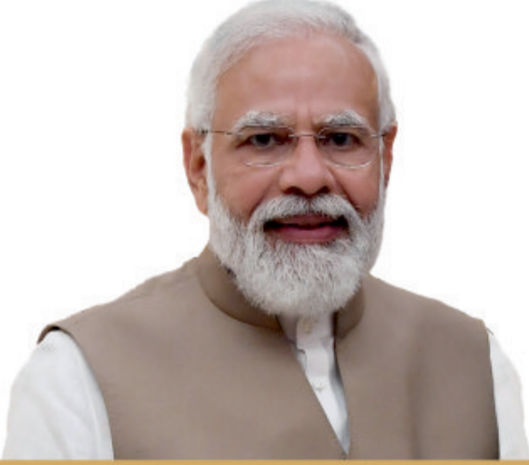
શ્રી નરેન્દ્રભાઈ મોદી માન. વડાપ્રધાન

આવો, સહુ સાથે મળી, સહકારી ચળવળને વેગવંતી બનાવીએ