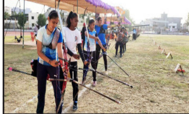
ગોધરા, ગોધરા શહેરમાં આવેલ જિલ્લા રમત પ્રશિક્ષણ કેન્દ્ર ખાતે રાજ્ય કક્ષાની આર્ચરી સ્પર્ધાનું આયોજન કરવામાં આવ્યું હતું. જેમાં અલગ અલગ વિભાગો મુજબ રાજ્યના અલગ-અલગ જિલ્લાના આર્ચરી સ્પર્ધાના ખેલાડીઓએ ભાગ લીધો હતો. રાજ્ય કક્ષાની સ્પર્ધામાં વિજેતા થયેલા ખેલાડીઓએ આ સ્પર્ધામાં ભાગ લીધો હતો. રાજ્ય કક્ષાની સ્પર્ધામાં વિજેતા થનાર ખેલાડીઓને રોકડ પુરસ્કાર અને અલગ અલગ શ્રેણી મુજબ મેડલ એનાયત કરવામાં આવશે. ગોધરા ખાતે યોજાયેલ રાજ્ય કક્ષાની આર્ચરી સ્પર્ધામાં અંદર-૧૪ શ્રેણીમાં ૬૦ ભાઈઓ અને ૭૦ બહેનો મળી કુલ ૧૩૦, અંદર-૧૭ શ્રેણીમાં ૬૮ ભાઈઓ અને ૮૨ બહેનો મળીને કુલ ૧૮૦ ખેલાડીઓ તથા ઓપન વિભાગમાં અંદાજે ૧૫૦ ઉપરાંત ખેલાડીઓ ભાગ લેશે.