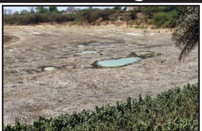
તસ્વીર : બશીર પઠાણ, સંતરામપુર

સંતરામપુર, સંતરામપુર પ્રતાપુરા વિસ્તાર અને માલણપુર ગરાહીયા ગ્રામ પંચાયત માં સમાવેશ થયેલો વર્ષો જૂનું આ તળાવ સંતરામપુર નગરપાલિકા દ્વારા અને વર્ષોથી ગણપતિની વર્ષોથી આ તળાવમાં પીઓપીની મૂર્તિઓ વિસર્જન કરવામાં આવતી હોય છે, પરંતુ આજ દિન સુધી આ તળાવની અંદરના સફાઈ કરાઈ તેને ઉંડુ કરવામાં આવ્યું. સૌથી જુનો અને સૌથી ઊંડો શીતળા માતાનું તળાવ ગણવામાં આવતું હતું. આજે તળાવ છોડકારાઓ માટે રમવાનું મેદાન બની ગયું છે. દેખરેખ વગર અને આ તળાવની હવે દુર્દશા બેઠી