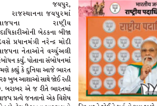
જયપુર, રાજસ્થાનના જયપુરમાં ભાજપના રાષ્ટ્રીય પદાધિકારીઓની બેઠકના બીજા દિવસે પ્રધાનમંત્રી નરેન્દ્ર મોદી ભાજપના નેતાઓને વચ્ચે અલી સંબોધન કર્યું. પોતાના સંબોધનમાં તેમણે કહ્યું કે દુનિયા આજે ભારત તરફ મુખ આશાઓ સાથે જોઈ રહી છે. બરાબર એ જ રીતે ભારતમાં ભાજપ પ્રત્યે જનતાનો એક વિશેષ સ્નેહ છે. દેશની જનતા ભાજપ પ્રત્યે મુખ આશાથી જુએ છે.

વિસ્તારને જોઈને ગર્વ તો થાય જ છે સાથે સાથે તેના નિર્માણમાં પોતાને ખપવાની દેનાર પાર્ટીની તમામ વિભૂતિઓને પણ હું આજે નમન કરું છું. તેમણે કહ્યું કે પંડિત દીનદયાલ ઉપાધ્યાયનો એકાત્મ માનવવાદ અને અંત્યોદય આપણું દર્શન છે, ડોક્ટર શ્યામા પ્રસાદ મુખરજીની સાંસ્કૃતિક રાષ્ટ્રનીતિ આપણું ચિંતન છે અને 'બધાનો સાથ, બધાનો વિકાસ, બધાનો વિશ્વાસ અને બધાનો પ્રયાસ' એ આપણો મંત્ર છે. અગાઉની સરકારો પર આકરા પ્રહારો કરતા પીએમ મોદીએ કહ્યું કે આપણા દેશમાં એક