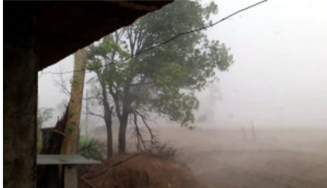
સહરસામાં ઓએચઈ વાયર તૂટવાને કારણે ત્રણ કલાક સુધી ટ્રેનની કામગીરી અટકી પડી હતી. લગભગ ૬૦ કિમીની ઝડપે આગળ વધી રહેલા આ ધૂળના તોફાનના કારણે થોડો સમય અંધારપટ છવાઈ ગયો હતો.

પટણા, બિહારમાં વાવાઝોડાના પાણીએ તબાહી મચાવી હતી. આ વાવાઝોડામાં ૨૭ લોકોના મોત થયા છે. ભાગલપુર અને મુઝફ્ફરપુરમાં છ-છ લોકોના મોત થયા છે. લખીસરાઈ જિલ્લામાં ત્રણ લોકોના મોત થયા છે. વૈશાલી અને મુંગેરમાં બે-બે, બાંકા, જમુઈ, કટિહાર, કિશનગંજ, જહાનાબાદ, સારણ, નાલંદા અને બેગુસરાઈમાં એક-એક મૃત્યુ પામ્યા. એનએચ અને રેલ્વે ટ્રેક પર વાયરો અને વૃક્ષો પડતાં રોડ અને રેલ વ્યવહાર ખોરવાઈ ગયો હતો.