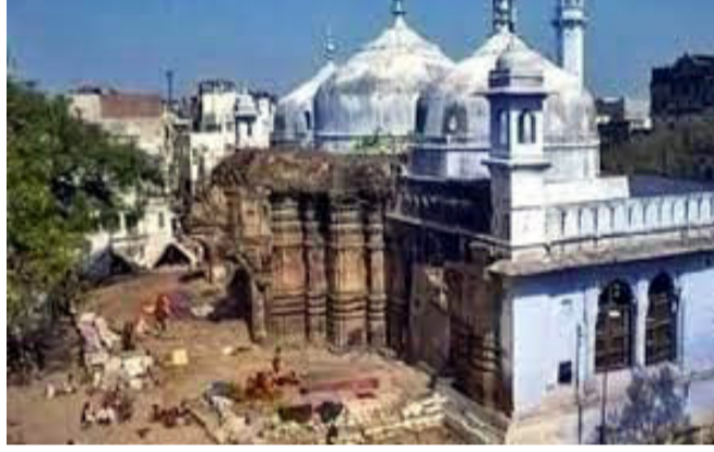
મેરિટ પર વાત કરો. સુપ્રીમ કોર્ટના ત્રણ સૂચનો આપ્યા છે તેમાં ૧. અમે આદેશ આપી શકીએ છીએ કે ઓર્ડર ૭ રૂલ ૧૧ ડેફેન્ટ ટ્રાયલ કોર્ટ અરજીનો નિકાલ કરે., ૨. અમે જે વ્યગાળાનો આદેશ જારી કર્યો છે તે ઓર્ડર ૭ રૂલ ૧૧ ડેફેન્ટ અરજીનો નિકાલ થવા સુધી જારી રહે. અને ૩. આ મામલાની જટિલતા અને સંવેદનશીલતાને જોતા અમારો વિચાર છે કે કેસની સુનાવણી જિલ્લા જજને કરવી જોઈએ કે કેમ તેમની પાસે ૨૫ વર્ષનો અનુભવ છે. જિલ્લા જજના વિવેક પર પ્રશ્ન કરવા જોઈએ નહીં. સમાવેશ થાય છે

મામલાને ઝડપથી સાંભળવામાં આવે. અહમદીએ કહ્યું કે પૂજા સ્થળના ધાર્મિક ચરિત્રને બદલવા પર સ્પષ્ટરૂપથી પ્રતિબંધ છે. આયોગની રચના કેમ કરવામાં આવી હતી? એ જોવાનું હતું કે ત્યાં શું હતું? જસ્ટિસ ચંદ્રચૂડ- કોઈપણ સ્થળના ધાર્મિક ચરિત્ર વિશે શોધવું વર્જિત નથી. માની લો કે કોઈ અગિયારી છે અને તેના બીજા ભાગમાં કોસ છે. શું અગિયારીની ઉપસ્થિતિ કોસને અગિયારી બનાવે છે? આ કોસની ઉપસ્થિતિ અગિયારીને ઈસાઈનું સ્થાન બતાવે છે? ઈસાઈ ધર્મના એક લેખની ઉપસ્થિતિ તેને ઈસાઈ નહી બનાવે અને પારસીની ઉપસ્થિતિ તેને આમ નહી બનાવશે. શું ટ્રાયલ જજ અધિકાર ક્ષેત્રની બહાર જતા રહ્યા અને શું રિપોર્ટ લીક થયો હતો. આ અલગ-અલગ મુદ્દા છે. અમે પછીથી જોઈશું. કોર્ટમાં ભારે ભીડ જામી હતી જેને કારણે દરવાજા બંધ કરવામાં આવ્યા હતાં.