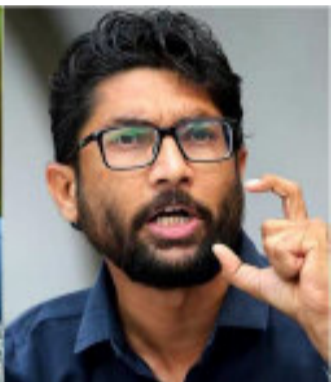
રાજીનામું આપતી વેળાએ રાહુલજીને ચિકન સેન્ટરવિષે આપવાની વાત કર્યાં આવી? ઉપરાંત તેને પ્રેસ-કોન્ફરન્સમાં અંબાણી અને અદાણી કેમ યાદ આવ્યા? જીજ્ઞેશ મેવાણીએ સરકારને સવાલ કર્યો હતો કે માત્ર પાટીદારો સામે જ કેમ કેસ પરત ખેંચાયા. ઉનામાં દલિતો સામેના કેસ હજી પરત નથી લેવાયા. પદ્માવતી ફિલ્મના વિરોધ વખતે થયેલા કેસ કેમ પરત નથી

લેવાયા. છતાં હાર્દિકે બધું ભૂલી ગયા છે. જીજ્ઞેશ મેવાણીએ વધુ વાત કરતા જણાવ્યું હતું કે, કોંગ્રેસે હાર્દિકને ઘણું આપ્યું છે. હાર્દિકે સીધા જ રાષ્ટ્રીય નેતૃત્વના સંપર્કમાં રહેતા હતાં. ચૂંટણીઓમાં સ્ટાર પ્રચારક બનાવ્યા હતાં. પ્રચાર માટે હેલિકોપ્ટર-ચોપર આપ્યા હતાં. જે લોકોએ હાર્દિકને પ્રેમ આપ્યો તે લોકોને હાર્દિકે હવે ગાળો બોલી રહ્યો છે. હાર્દિકે પર ૩૨ કેસ છે એટલે બની શકે કે તેમના પર દબાણ હોઈ શકે એટલે રાજીનામું આપ્યું છે. અસામમાં ફરિયાદ મામલે મારી માટે અડધી રાતે રાહુલ ગાંધી ઉઠ્યા છે. વિચારધારા એ વસ્તુ નથી, એ રગોમાં હોવી જોઈએ. અમે ઝુકવાના નથી, એકાદ મિત્રો છોડી જાવ એ યોગ્ય નથી. ગુજરાત કોંગ્રેસ વિરોધી છે એ બોલવું યોગ્ય નથી. આગામી ૨૨ મી મેના રોજ વાત માટે સર્વ જ્ઞાતિ સંમેલન યોજાશે.