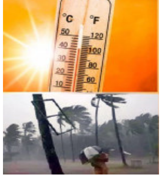
તાપમાન નોંધાયું હતું.

નવીદિલ્હી, કાળજાળ ઉનાળા વચ્ચે દેશના જુદા-જુદા ભાગોમાં અલગ-અલગ વાતાવરણ સર્જાયું છે. દિલ્હીમાં પ્રથમ વખત તાપમાનનો પારો ૪૯ ડિગ્રીએ પહોંચવા સાથે રાજસ્થાન, પંજાબ, હરિયાણા સહિતના રાજ્યોમાં ગરમીનો કાળો કેર થવાત છે ત્યારે ચોમાસાનું આગમન વેલુ થઈ જવાની આગાહી વચ્ચે કેરળમાં ભારે વરસાદ વચ્ચે પુરપ્રકોપ સર્જાયો છે. હવામાન વિભાગ દ્વારા રેડ એલર્ટની ઘોષણા કરવામાં આવી છે. પાટનગર દિલ્હીમાં રેકોર્ડતોડ તાપમાન નોંધાયું હતું. મંગેશપુર તથા નજકગઢમાં પારો ૪૯ ડિગ્રીને વટાવી ગયો હતો. દિલ્હીમાં આટલુ ઉંચુ તાપમાન પ્રથમવાર નોંધાયું છે જેને પગલે લોકો રીતસર અકળાઈ ગયા હતા. સમગ્ર દેશમાં સૌથી ઉંચુ તાપમાન હતું અને ભુતકાળમાં ક્યારેય આ સ્તરે પહોંચ્યું નથી. ગુડગાંવમાં ૫૬ વર્ષનો રેકોર્ડ તૂટ્યો હતો. જ્યાં તાપમાનનો પારો ૪૮.૧ ડિગ્રી પર પહોંચ્યો હતો. ફરીદાબાદમાં ૪૭.૧ ડિગ્રી તથા ગાઝીયાબાદ-નોઈડામાં ૪૫ ડિગ્રીથી વધુ તાપમાન હતું. દિલ્હી ઉપરાંત પંજાબ-હરિયાણા તથા રાજસ્થાન પણ અગનભઢી બન્યા હતા. રાજસ્થાનમાં અર્ધોડગન શહેરોમાં પારો ૪૮ ડિગ્રી થયો હતો જ્યારે હરિયાણાના પુરૂષામમાં ૪૮.૧ ટકા નોંધાયો હતો. પંજાબના મુક્તસરમાં ૪૭.૪ ડિગ્રી, હરિયાણાના હિસ્સારમાં ૪૭.૩ ડિગ્રી, સિરસામાં ૪૭.૨ ડિગ્રી, રોહતકમાં ૪૬.૭ ડિગ્રી તથા ભીવાનીમાં ૪૬ ડિગ્રી તાપમાન નોંધાયું હતું. ભટીડામાં ૪૬.૮