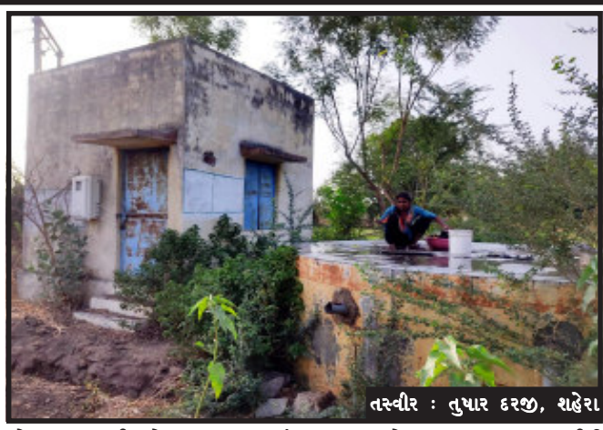
તસ્વીર : તુષાર દસ્ટ, શહેરા

શહેરા, શહેરા તાલુકાના ખરેડીયા અને મીઠાપુર ગામની વણાંકબોરી પાણી પુરવઠા યોજનાનો સંપ પાણીથી ભરાતો હોવા છતાં ગ્રામજનોને પાછલા ત્રણ વર્ષથી પાણી નહિ મળતા આ યોજના ગ્રામજનો માટે શોભાના ગાંધિયા સમાન બની છે. ભરેલાને આ બે ગામના ગ્રામજનો હેન્ડ પંપ અને કુવાના સહારે પીવા માટે અને ઘર વપરાશનું પાણી મેળવતા હોય જ્યારે સંપમાં આવતું પાણીનો બગાડ થતો જોઈને ગ્રામજનોનો પાણી પુરવઠા તંત્ર સામે ભારે નારાજગી જોવા મળી રહી હતી.