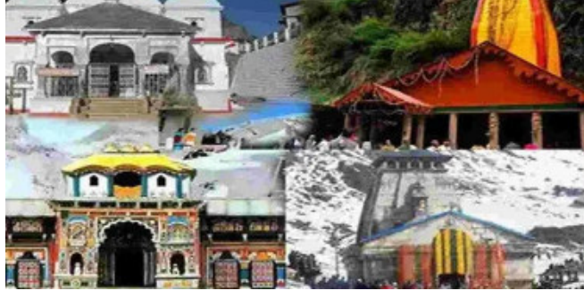
૧૦જુન સુધી ચારધામ યાત્રાનું ભુક્કું ફૂલ થઈ ગયું છે. તો આવા સંજોગો માં આ યાત્રાળુઓ ને વિના દર્શન પાછા ફરવાનો વારો આવી શકે છે. જો કે એક અધિકારીએ કહ્યું કે

દહેરાદુન, ઉત્તરાખંડમાં ચારધામ યાત્રા માટે ભક્તોની મોટી ભીડ લાગી છે. ત્યારે ભીડને નિયંત્રિત કરવા માટે આવરશે નિયમો કડક બનાવવામાં આવ્યા છે. માત્ર નોંધાયેલા તીર્થયાત્રીઓને જ ચારધામ યાત્રા માટે મંજૂરી આપવામાં આવે છે. આવી પરિસ્થિતિમાં અનેક ગુજરાતી યાત્રીઓ વિના નોંધણીએ ગયા હતા. અને હાલમાં હાલાકીનો સામનો કરવો પડી રહ્યો છે. નોંધણી વિના ગયેલા ગુજરાતીઓને અટકાવી દેવામાં આવ્યા છે. પ્રાપ્ત વિગતો અનુસાર ઋષિકેશમાં આ યાત્રાળુઓને અટકાવી દેવામાં આવ્યા છે. આગામી