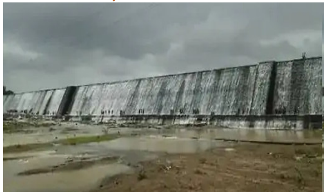
ડેમોમાં પાણીનો સ્તર ઓછો થઈ રહ્યો છે. ગુજરાતના ૨૦૭ ડેમમાં અત્યારે ૪૬ ટકા જેટલો પાણીનો જથ્થો બચ્યો છે. જોકે ઉત્તર ગુજરાતમાં સૌથી વધુ કફોડી સ્થિતિ છે, ત્યાંના ૧૫ ડેમમાં માંડ ૧૩.૬૯ ટકા જેટલું પાણી છે.

ગાંધીનગર, ઉનાળામાં પડી રહેલા આકરા તાપની સાથે ગ્રામીણ વિસ્તારોમાં પાણીની તંગી ખૂબ તીવ્ર બની છે. પાણીની પરેશાનીને કારણે સરકાર દ્વારા ઘણા ડેમોમાં નર્મદા ડેમમાંથી પાણી છોડવામાં આવી રહ્યું છે છતાં ઘણાં ગામડાં ધોમધપાતં તાપમાં તરસ્યાં છે, એવામાં ટેકર દ્વારા ત્યાં પાણી પહોંચાડવાના પ્રયાસ થઈ રહ્યા છે. બીજા તરફ, રાજ્યના ૧૭ મુખ્ય ડેમમાં હાલની સ્થિતિએ માત્ર ૪૬ ટકા પાણીનો જથ્થો રહેલો છે. જો આ વર્ષે ગુજરાતમાં ચોમાસું સારું નહીં રહે તો આગામી વર્ષે પણ પાણીની સમસ્યા વધુ ગંભીર બની શકે છે. ઉત્તર ગુજરાત અને કચ્છ બાદ હવે સૌરાષ્ટ્રમાં પણ જળસંકટની સ્થિતિ