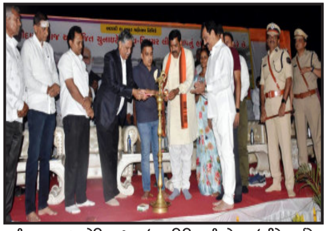
પાટીદાર સમાજ આયોજિત યુથ નાઈટ ક્રિકેટ ટુર્નામેન્ટનો ગૃહ રાજ્ય મંત્રી હર્ષ સંઘવીએ રાજ્યના ઉચ્ચ શિક્ષણ રાજ્ય મંત્રી કુબેરભાઈ ડોંગર અને પંચમહાલ સાંસદ રતનસિંહ રાઠોડ તેમજ લુણાવાડાના ધારાસભ્ય જીજ્ઞાભાઈ સેવકની ઉપસ્થિતિમાં પ્રારંભ કરાવ્યો હતો. સાથે મહિસાગર

લુણાવાડા, ગૃહ રાજ્ય મંત્રી હર્ષ સંઘવીએ મહિસાગર જિલ્લાના યુવાનો પોતાની પ્રતિભા કૌશલ્ય ઉપસાવી વૈશ્વિક સ્તરે ગુજરાત અને દેશનું નામ રોશન કરે તે હેતુથી રાજ્યના મુખ્ય મંત્રી ભૂપેન્દ્રભાઈ પટેલના નેતૃત્વમાં મહિસાગર જિલ્લામાં ગોહિલના મુખ્યાલયે લુણાવાડાની વચ્ચે દેશના અત્યાધુનિક સ્પોર્ટ્સ સેન્ટરો જેવું જ આધુનિક સ્પોર્ટ્સ સેન્ટર બનાવવા માટે ૧૫ એકર જમીનમાં બનાવવાનું નક્કી કરવામાં આવ્યું છે તેમ જણાવ્યું હતું. તેમણે ઉમેર્યું હતું કે, આ માટે રાજ્ય સરકારે જરૂરી કામગીરી પૂર્ણ કરી દીધી છે અને સ્પોર્ટ્સ સેન્ટરના પ્લાન માટે કામગીરી ચાલુ કરી દેવાની સાથે રૂ. ૫૦ કરોડની ફાળવણી કરી દેવામાં આવી છે. મહિસાગર જિલ્લાના ચાવડાબાઈના મુવાડા ખાતે બાવન