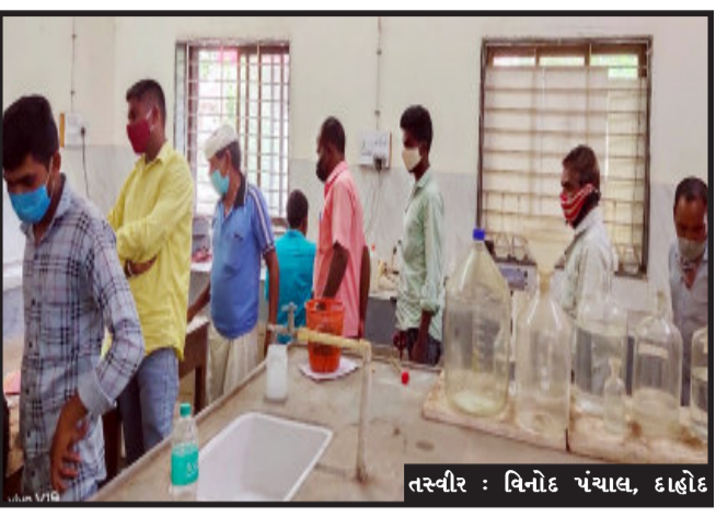
પાકો માટે અનુકુળ છે, ખેતી પાકોને યોગ્ય અને સમતોલ માત્રામાં ખાતર આપવા જમીનનું બંધારણ નક્કી કરવા, જમીનના