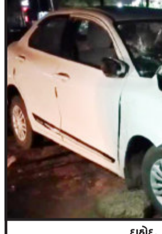
દાહોદ, દાહોદ ખાતે ઈન્દોર અમદાવાદ હાઈવે રોડ ઉપર કાર અને પીકઅપ વચ્ચે અકસ્માત સર્જાયો હતો. જેમાં કારમાં સવાર એક વ્યક્તિનું મોત નીપજ્યું હોવાનું જાણવા મળી રહ્યું છે.