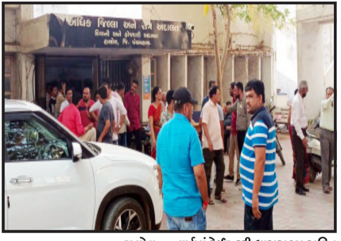
હાલોલ, હાલોલ શિવરાજપુરના ઝીમીરા રીસોર્ટમાં ૨૦૨૧ના વર્ષમાં રેઈડ કરી ધારાસભ્ય સહિત ૨૬ લોકોને જુગાર રમતા પાવાગઢ પોલીસ અને એલ.સી.બી.