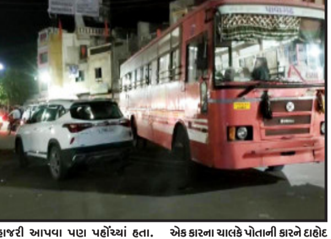
હાજરી આપવા પાડા પહોંચ્યાં હતા. ત્યારે બીજી તરફ ગતરોજ ગાંધીનગર જિલ્લા કોંગ્રેસ સમિતિનું બોર્ડ મારેલ

દાહોદ, દાહોદ શહેરના બસ સ્ટેશનની આગળ કોંગ્રેસના ગાંધીનગર જિલ્લા પ્રમુખ લખેલ એક કારના ચાલકે ગાડી રસ્તાની વચ્ચેવચ્ચે ઉભી કરી દેતાં બસ સ્ટેશન વિસ્તારમાં ભારે ટ્રાફિક જામના દ્રશ્યો પાડા સર્જ્યાં હતા. ત્યારે અહીંથી અવર જવર કરતાં લોકોમાં પાણ ભારે આક્રોશ જોવા મળ્યો હતો. ગતરોજ દાહોદ ખાતે કોંગ્રેસના અધ્યક્ષ રાહુલ ગાંધીએ આદિવાસી સત્યાગ્રહ કાર્યક્રમમાં હાજર રહ્યાં હતા. ત્યારે બીજી તરફ ગુજરાત ભરના કોંગ્રેસના અગ્રણીઓ સહિત કાર્યકરો દાહોદ ખાતે આ કાર્યક્રમમાં