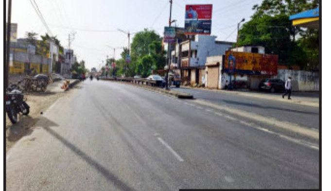
મહિસાગર માં તાપમાનનો પારો ૪૭ થી ૪૭ ડિગ્રીએ પહોંચ્યો હતો. મહિસાગર સહિત રાજ્યમાં તાપમાનમાં સતત વધારો થઈ રહ્યો છે. ત્યારે મે ની શરૂઆત ગરમ બનતી જતાં લોકોને

લુણાવાડા, મહિસાગર જિલ્લામાં દર વર્ષે કરતા આ વખતે ઉનાળા ની મધ્ય માં આ વખતે સૌથી વધુ ગરમીની અસર શરૂ થઈ હોય તેવો ઘાટ સર્જાયો છે. જે પ્રકારે મે ની શરૂઆત થઈ છે તેમ તેમ સૂર્યનારાયણ વધુ આકરા બનતા જાય છે. જેના કારણે જિલ્લામાં છેલ્લા એક સપ્તાહમાં સૌથી વધુ તાપમાનનો પારો બુધવાર ના રોજ જોવા મળ્યો જ ૪૭ ડિગ્રીએ જોવા મળતા તેની અસર જનજીવન અને પશુપંખી પર થઈ છે. જિલ્લામાં સૌથી વધુ વૃક્ષો નું નિકંદન થવાના કારણે જિલ્લાને ખાસ કરીને ઉનાળામાં સૌથી વધુ ગરમી સહન કરવાનો દર વર્ષે વારો આવે છે. જે ના કારણે આ વર્ષે પછા