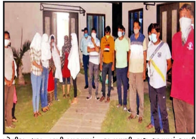
પોલીસ દ્વારા ઝડપી પાડવામાં આવ્યા હતા. આ કેસ હાલોલ કોર્ટમાં ચાલી જતાં આજરોજ સુનાવણી હાથ ધરવામાં આવી હતી. હાલોલ કોર્ટ દ્વારા ધારાસભ્ય કેશરીસિંહ સોલંકી સહિતના ૨૬