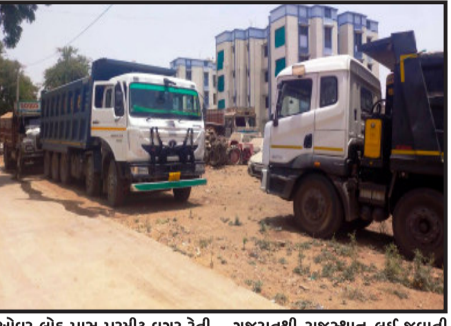
ઓવર લોડ પાસ પરમીટ વગર રેતી ભરેલ હતી. પોલીસે આઠેય ડમ્પરોનો કબજો લઈ પોલીસ મથકે લઈ આવ્યાં હતાં ત્યારે આ ડમ્પરોમાં રેતી ભરી

દાહોદ, દાહોદ જિલ્લામાં રેતી ખનન માફિયાઓનો ત્રાસ દિન પ્રતિદિન વધી રહ્યો ત્યારે ગતરોજ ઝાલોદ પોલીસે ઝાલોદ બાયપાસથી રાજસ્થાન જતાં ઓવર લોડ રેતી ભરેલ આઠ ડમ્પર (ટ્રકો) ઝડપી પાડતાં ચક્રાચર મચી જવા પામી છે. ગતરોજ ઝાલોદ પોલીસને મળેલ બાતમીના આધારે ઝાલોદ બાયપાસ થી રાજસ્થાન જતાં માર્ગ ઉપર વીચ ગોઠવી ઉભા હતા. તે સમયે બાતમીમાં દર્શાવેલ ડમ્પરો (ટ્રક) એકપછી એક ત્યાંથી પસાર થતાં પોલીસ સાબલી બની હતી અને આઠેય ડમ્પરોને ઉભી રખાવી ડમ્પરોની તલાસી લેતાં તેમાં