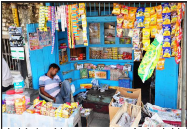
દિવસે દિવસે ગરમીનું પ્રમાણ આસમાન ઉપર ચડી રહ્યું. ત્યારે લોકો ગરમીથી બચવા પંખા ફૂલર એ.સી અને રાહદારીઓ તો અનુક્રવા ઝાડ નીચે બેસી ગરમી થી બચવાના પ્રયત્નો કરતા હોય છે, પછા નાનકડી દુકાન ઘનાર એક નાનો વેપારી દુકાનની અંદર ઊંઘીને ગરમીનો સમય પસાર કરી તેવો એક દ્રશ્ય પંચમહાલ જિલ્લાના ગોધરા વિશાલ કોપલેક્સ નજીક બરબપોરે ગેઝેરી ઊંઘમાં નજરે પડી રહ્યો છે.

લુણાવાડા, વૈશ્વિક મહામારી કોરોના સામે લડત આપવા માટે માનવ શરીરમાં જરૂરી રોગપ્રતિકારક શક્તિ મજબૂત કરવા અર્થે રસીકરણ એક મજબૂત અને અસરકારક સાબિત થયું છે. રાજ્યના ૧૮ થી ૫૯ વર્ષની વય જૂથની વ્યક્તિઓ કે જેઓએ બે ડોઝ લીધા હોય તેવી વ્યક્તિઓ બીજો ડોઝ મૂકાવાના લ(નવ) માસ બાદ પ્રીકોશન (બુસ્ટર) ડોઝ લઈ શકે છે. રાજ્ય સરકાર દ્વારા આયોજિત પ્રીકોશન ડોઝ ફ્રન્ટ લાઈન કાર્યકર, આરોગ્ય કર્મચારી તેમજ સીનિયર સિટીઝનને નિઃશુલ્ક આપવામાં આવે છે. જયારે અન્ય વ્યક્તિઓએ ખાનગી રસીકરણ કેન્દ્ર ખાતે આયોજિત પ્રીકોશન ડોઝ (બુસ્ટર) લેવાનો રહે છે. આ માટે રાજ્ય સરકાર દ્વારા ખાનગી હોસ્પિટલોને રસીકરણ કેન્દ્રો શરૂ કરવા માટેની માન્યતા આપવામાં આવી રહી છે. આ ખાનગી હોસ્પિટલોના રસીકરણ કેન્દ્રો ખાતે પ્રીકોશન ડોઝ ઘટાડેલા દરે મળી રહે તે માટે ભાવ નિયત કરવામાં આવ્યા છે. તદ્દનુસાર આ ખાનગી હોસ્પિટલોના રસીકરણ કેન્દ્રો ખાતે હોસ્પિટલ લાભાર્થી વ્યક્તિ પાસેથી રૂ. ૨૨૫/- વેકિસન ખર્ચ + ૫ % જીએસટી + વધુમાં વધુ રૂ. ૧૫૦/- સર્વિસ ચાર્જ મળી પ્રતિ ડોઝ રૂ. ૩૮૪/- નિયત કરવામાં આવ્યા છે. રાજ્ય સરકાર દ્વારા આપવામાં આવેલ મંજૂરી અનુસાર મહિસાગર જિલ્લામાં પછા ચાર ખાનગી હોસ્પિટલોની ૧૮ થી ૫૯ વર્ષની વયજૂથની વ્યક્તિઓને પ્રીકોશન ડોઝ માટે માન્યતા આપવામાં આવી છે જેમાં લુણાવાડાની લીલાવતી હોસ્પિટલ અને આયુષ મટ્ટી સ્પેશીયાલિટી હોસ્પિટલ, સંતરામપુરની સુકમાલનગી હોસ્પિટલ તથા બાલાસિનોરની કે.એસ.પી. હોસ્પિટલને માન્યતા આપવામાં આવી હોઈ આ હોસ્પિટલ ખાતે આ વયજૂથની વ્યક્તિઓ નિયત કરવામાં આવેલ દરે પ્રીકોશન ડોઝ મૂકાવી શકશે એમ મહિસાગર-લુણાવાડાના મુખ્ય જિલ્લા આરોગ્ય અધિકારીએ એક યાદી દ્વારા જણાવ્યું છે.