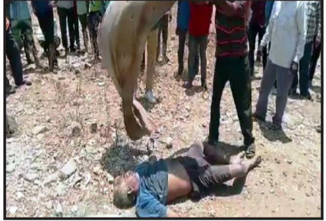
દાહોદ, દાહોદ જિલ્લાના રાજકારણમાં પણ ભૂકંપ સર્જાયો હતો અને તરેહની ચર્ચાઓ એ પણ જોર પકડ્યું હતું.

દાહોદ, દાહોદ જિલ્લાના લીમખેડા તાલુકાના પરમારના ખાખરીયા ગામે એક પિતાના પુત્ર એ લીમખેડા તાલુકા માં રહેતી એક યુવતીને પત્ની તરીકે રાખવા સારૂ લઈ આવ્યો હતો જેની અદાવત રાખી યુવતીના પિતા તેમજ દાહોદ જિલ્લા પંચાયતના મહિલા સભ્ય તથા તેના પતિ જેઓ તાલુકા પંચાયતના પૂર્વ પ્રમુખ રહી ચૂકેલ છે અને અને હાલમાં ખીરખાઈ ગામ ના સરપંચ તરીકે ફરજ બજાવી રહ્યા છે તથા તેમની સાથે કુલ મહિલા સહિત જ જેટલા ઈસમોએ યુવકના પિતા નું અપહરણ કરી બોધક પદાર્થ વડે માથાના ભાગે તેમજ શરીરે ગંભીર ઘુવલેણા ઈજાઓ પહોંચાડી મોતને ઘાટ ઉતારી દેતાં પંચક થઈ જિલ્લામાં ખળભળાટ મચી જવા પામ્યો છે ત્યારે બીજી તરફ આ હવાના કેસમાં જિલ્લા પંચાયતના સભ્ય તથા તેમના પતિનું નામ આરોપીઓની સિસ્ટમમાં સામેલ