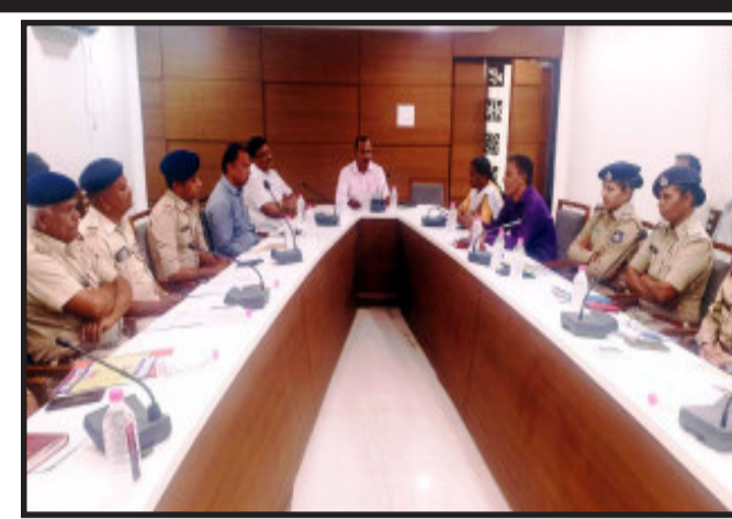
લુણાવાડા, મહિસાગર જિલ્લામાં આગામી તા.૦૩/૫/૨૨ના રોજ વૈશાખ સુદ ત્રીજ અક્ષય તૃતિયા નિમિત્તે કે ગમે ત્યારે યોજનાર લગ્નોમાં તંત્ર દ્વારા આકસ્મિક તપાસ કરવામાં આવશે.

લુણાવાડા, મહિસાગર જિલ્લામાં આગામી તા.૦૩/૫/૨૨ના રોજ વૈશાખ સુદ ત્રીજ અક્ષય તૃતિયા નિમિત્તે કે ગમે ત્યારે યોજનાર લગ્નોમાં તંત્ર દ્વારા આકસ્મિક તપાસ કરવામાં આવશે. આ તપાસ દરમિયાન છોકરીની ઉંમર ૧૮ અને છોકરાની ઉંમર ૨૧ વર્ષ કરતાં ઓછી હોવાનું માલુમ થશે તો કાયદાકીય રીતે ફરિયાદ દાખલ કરવામાં આવશે જેની જિલ્લાના નાગરિકો તથા સમૂહલગ્નના આયોજકોને ખાસ નોંધ લેવા મહિસાગરના બાળલગ્ન પ્રતિબંધક અધિકારી સહ જિલ્લા સમાજ સુરક્ષા અધિકારી એક યાદી દ્વારા જણાવ્યું છે.