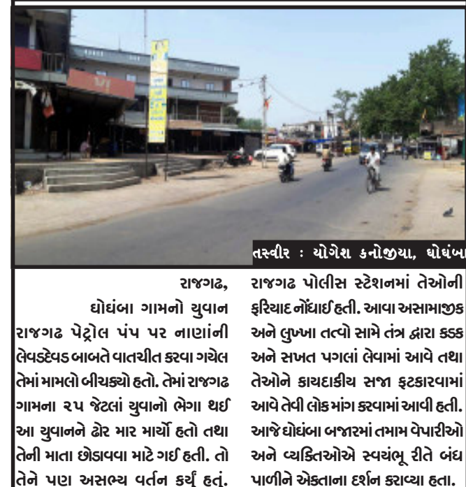
તસ્વીર : યોગેશ કનોજીયા, ઘોંઘા

હાલોલ, હાલોલ શહેરની બહાર હાલોલ વડોદરા હાઈવે રોડ પર મંગળવારના રોજ બપોરના સુમારે એક કન્ટેનર અને આઈશર ટેમ્પો વચ્ચે અકસ્માત સર્જાયો હતો. જેમાં વડોદરા તરફથી હાલોલ તરફ રહેલ આઈશર ટેમ્પો સાથે એક કન્ટેનર ડૂક પાછળના ભાગે ઘડાકાભેર અથડાતા અકસ્માત થવા પામ્યો હતો. જેમાં અસ્માતના પગલે થોડા સમય માટે મુખ્ય હાઈવે રોડ પર ટ્રાફિક જામની પરિસ્થિતિ સર્જાઈ હતી. જોકે,