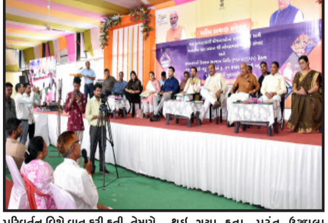
પરિવર્તન વિશે વાત કરી હતી. તેમણે જણાવ્યું કે, અગાઉ રસોઈ બનાવવા તેમને ખૂબ મૂશ્કેલી પડતી હતી. જંગલમાંથી લાકડા લાવવાથી લઈને ચૂલામાં થતા ધૂમાડાથી તેઓ ત્રસ્ત થઈ ગયા હતા. પરંતુ ઉચ્ચલા યોજનાનો લાભ મળતા તેઓ સરળતાથી રસોઈ બનાવી લે છે અને કોઈ પરેશાનીનો સામનો કરવો પડતો નથી.