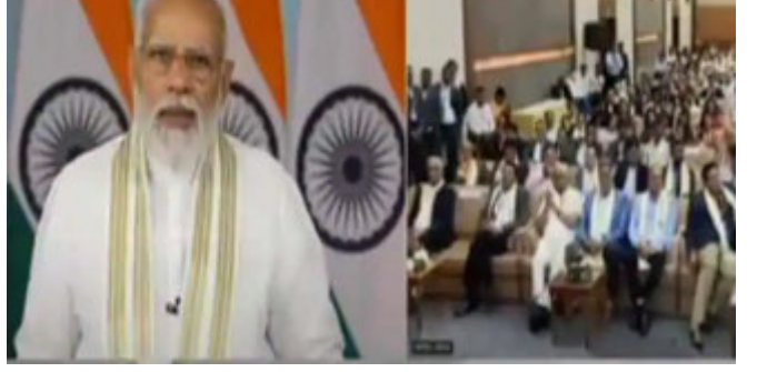
ફક્ત આપણુ દિમાગ તેના સદુપયોગ માટે લગાવવુ પડશે. આગામી ૨૫ વર્ષમાં જયારે આપણે સંકલ્પ સાથે નીકળીએ તો સરદાર પટેલની આ વાતને ભૂલવુ ન જોઈએ. આજે ભારત પાસે સમિટમાં દેશ વિદેશ અનેક પાટીદાર ઉદ્યોગપતિઓ જોડયા હતા.

સુરત, આજથી સુરતના સરઘણામાં ગ્લોબલ પાટીદાર બિઝનેસ સમિટ ૨૦૨૨નો પ્રારંભ થઈ રહ્યો છે. ત્રણ દિવસ ચાલનારા આ સમિટનું ઉદ્ઘાટન પ્રધાનમંત્રી નરેન્દ્ર મોદી વચ્ચે અલી માધ્યમથી કર્યું હતું. આ સમિટમાં મુખ્યમંત્રી ભૂપેન્દ્ર પટેલ પણ વચ્ચે અલી જોડયા હતા. આ વખતના સમિટમાં ૩૬ કિલો ચાંદીના ભગવાનના વાધા આકર્ષણનું કેન્દ્ર બન્યા છે. પ્રેમવતી ગોલ્ડ દ્વારા ભગવાનના આ વાધા તૈયાર કરાયા છે. ૧૮ કારીગરોએ ૯૫ દિવસને મહેનત બાદ આ ખાસ વાધા બનાવ્યા છે. ગ્લોબલ પાટીદાર સમિટમાં દેશ વિદેશ અનેક પાટીદાર ઉદ્યોગપતિઓ જોડયા હતા. પોતાના સંબોધનમાં પીએમ મોદીએ કહ્યું કે, દુનિયાના સૌથી તેજશી વિકસિત થઈ રહેલા શહેરોમાં એક શહેર સુરત છે. આજે સૌ સુરતમાં બેસીને નવો સંકલ્પ લઈ રહ્યાં છીએ. ગુજરાત પ્રતિ અને ભારત પ્રતિ આપણા સહિયારા પ્રતિબદ્ધતાનું પરિણામ છે. દેશને નવી આજાદી મળી હતી ત્યારે સરદાર પટેલે કહ્યું હતું કે, ભારતમાં સંપદાની કોઈ અછત નથી. આપણે