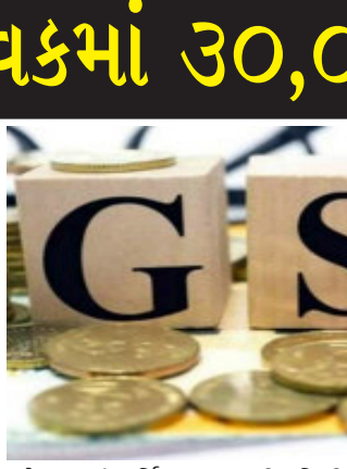
કલેક્શનમાં વાર્ષિક ૧૪ ટકાની વૃદ્ધિની ધારણા મૂકીને આવકમાં ઘટાડાની ગણતરી કરવામાં આવી હતી. ૧ જુલાઈ ૨૦૧૭થી એકસમાન કરવ્યવસ્થા લાગુ કરવામાં આવી હોવાથી પાંચ વર્ષનો આ સમયગાળો જૂન ૨૦૨૨માં પૂરો થાય છે. અનેક રાજ્યોએ જૂન ૨૦૨૨ બાદ જાહેસીટી વળતરને લંબાવવાની માગણી કરી હોવા છતાં તેમ જ કેન્દ્રીય નાણાપ્રધાન નિર્મલા સીતારમણે એને સ્વીકૃતિ આપી હોવા છતાં હજી રાજ્યોને એની પાતરી આપવામાં આવી નથી.

એક ઉચ્ચ ઔદ્યોગિક રાજ્ય હોવાને કારણે મહારાષ્ટ્ર એકલા કરાયેલા કુલ કેન્દ્રીય જાહેસીટીમાં લગભગ ૧૫ ટકા ફાળો આપે છે જે કેન્દ્ર સરકારને જાય છે. જો જાહેસીટી વળતર પ્રણાલીને જૂન પછીથી લંબાવવાનો ઈનકાર કરે છે તો મહારાષ્ટ્રને આવકમાં ૩૦,૦૦૦ કરોડનું નુકસાન થાય એમ છે. ૨૦૨૦-૨૧માં કેન્દ્રએ રાજ્ય પાસેથી ૪૬,૬૬૪ કરોડ રૂપિયા એકલા કર્યા હતા અને રાજ્યને ૫૨૧ કરોડ મળ્યા હતા. કેન્દ્ર જુલાઈ મહિનામાં ચુકવણી કરે છે અને એમાં વિલંબ થાય તો વહીવટી ગૂંચવણો સર્જાય છે એમ અધિકારીએ જણાવ્યું હતું.