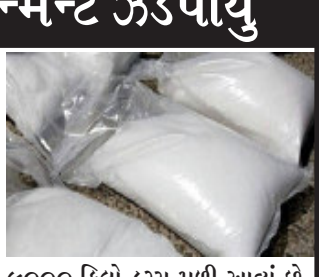
૯૦૦૦ કિલો ડ્રગ્સ મળી આવ્યું છે, જે અત્યાર સુધીનું દેશનું સૌથી મોટું ડ્રગ્સ કન્સાઈન્મેન્ટ હોવાની સંભાવના પ્રમાણમાં નશીલી દવાઓનો જથ્થો મળ્યો છે. ડ્રગ્સને પગલે હાલમાં તમામ સેન્ટ્રલ એન્જ-સીઓના સિનિયર અધિકારીઓના પીપાવાવ પોર્ટ પર પહોંચી ગયા છે. પીપાવાવ પોર્ટ પર અંદાજે