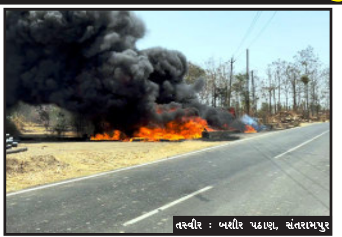
તસ્વીર : બશીર પઠાણ, સંતરામપુર

સંતરામપુર, સંતરામપુર તાલુકાના કાળીબેલ ગામે રોડની પાસે ખેતરોમાં ૧૭૪ સિંચાઈ વિભાગ દ્વારા કામગીરી માટે પાઈપોનો મોટો જથ્થો કરવામાં આવેલો હતો. લિપ એરીગેશન કામગીરી ચાલતી હતી અને ખેતરમાં મુકેલી પાઈપો કોને આગ લગાવી જે તપાસનો વિષય બન્યો છે. જયંતિ એજન્સી દ્વારા તપાસ હાથ ધરવામાં આવેલી છે અને પોલીસ ફરિયાદ પણ કરવામાં આવેલી છે. સિંચાઈ વિભાગ દ્વારા ખેડૂતોને એજન્સી દ્વારા પાઈપી નાખીને ખેડૂતોને પાઈપી પૂરું પાડવામાં આવતું હોય છે. નુકશાન કેમ કરે છે, આવી રીતે કોન્ટ્રાક્ટર દ્વારા ખેડૂતો પર આરોપ મૂકવામાં