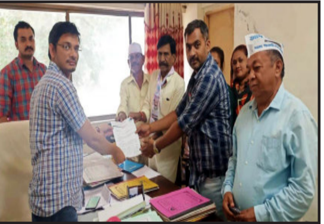
પાલિકાએ જાહેર કરતા વધેલા વેરાને લઈ આમ આદમી પાર્ટી દ્વારા પાલિકાના વેરા વધારાને કારણે એક તરફ ત્રણ વર્ષથી કોરોનાની મહામારીને લઈ હજુ તેની આડ અસર વર્તાઈ રહી છે. જેમાં હજુ પણ

દાહોદ, પ્રાપ્ત વિગતો મુજબ દેવગઢ બારીયા નગરપાલિકા દ્વારા દિવાબતી, પાણી, સફાઈના વેરાને લઈ સામાન્ય સલામાં ઠરાવ કરી સો ટકા જેટલો વેરાનો ઘરખમ વધારો કરતા નગરજનો ઉપર વધુ એક બોજ જાણે પાલિકાએ ઠોકી દીધો હોઈ તેમ જોવાઈ રહ્યું છે. ત્યારે દિવાબતીનો જુનો વેરો રૂપિયા ૧૨૦ હતો. જે વધીને ૨૪૦, પાણીનો જુનો વેરો રૂપિયા ૩૦૦ હતો જે વધીને ૬૦૦ રૂપિયા બીન રહેણાંકમાં જુનો પાણીનો વેરો ૧૦૦૦ હતો. જે વધીને રૂપિયા ૧૨૦૦ જ્યારે સફાઈમાં જુનો ૧૨૦ રૂપિયા જે વધીને ૨૪૦ અને બિનરહેણાંકમાં જુનો ૨૪૦ રૂપિયા વેરો જે વધીને ૩૬૦ રૂપિયા વેરો