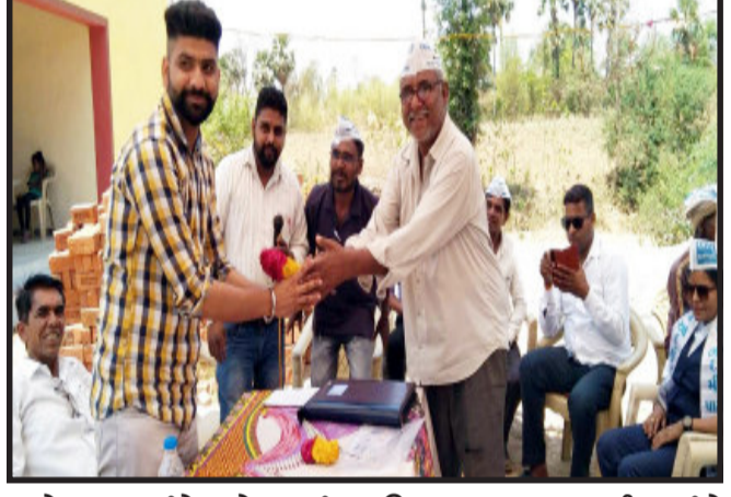
ગામેગામ જઈને ઓનલાઈન સભ્ય બનાવવામાં આવે છે અને તમામ કાર્યકરોને આ બાબતેની ટ્રેનિંગ બ્લોક લેવલ પર આપવામાં આવે છે. હાલોલ વિધાનસભા પ્રભારી દ્વારા આગામી