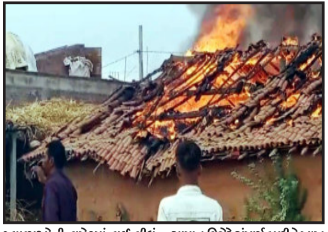
જવાળાઓની લપેટમાં લઈ લીધું હતું. મકાનમાં મુકી રાખેલ, દાગીના, અનાજ, કપડા, ઘરવખરીનો

દાહોદ, દાહોદ તાલુકાના ખરેડી ગામે એક મકાનમાં અકસ્માતે આગ લાગતાં આગની અગળ જવાળાઓમાં સંપૂર્ણ મકાન બળીને ખાખ થઈ ગયું હતું. ફાયર ફાયટરના લાશ્કરોએ ભારે જહેમત બાદ આગ ઉપર કાબુ મેળવ્યો હતો. આગમાં અંદાજે ૧૦ લાખનું નુકશાન થવા પામ્યું હતું. ગતરોજ ખરેડી ગામે એક કાચા મકાનમાં અગભ્યકારણોસર આગ લાગી હતી. આગે વિકરાળ રૂપ ધારણ કરતાં જોતજોતામાં આગે સંપૂર્ણ મકાનને પોતાની અગળ