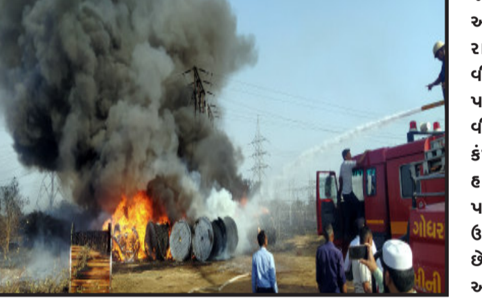
આસપાસના ઘાસ અને કચરાને લઈને આગ પકડાઈ જવા પામી હતી. જોતજોતામાં આગે વિકરાળ સ્વરૂપ ધારણકર્તા ગોધરા, હાલોલ કાલોલ તેમજ કંપનીઓના ફાયર ફાયટરો ઘટના સ્થળે દોડી આવ્યા હતા.

ગોધરા, ગોધરા શહેર લીલેસરા મધ્ય ગુજરાત વીજ કંપનીના ફીટરમાં અચાનક ઘડાકો થતાં આસપાસના કચરા અને ઘાસમાં આગ ફેલાઈ હતી. આગ ઝડપથી ફેલાતા ગોધરા, હાલોલ, કાલોલ તેમજ કંપનીઓના પ્રાઈવેટ ફાયર ફાયટરો ઘટના સ્થળે દોડી આવ્યા હતા અને આગ ઉપર કાબુ મેળવવાના પ્રયાસ ચાલુ છે. લીલેસરા પાવર સ્ટેશનમાં આગ લાગવાની ઘટનાને લઈ લાઈટો ડુલ થઈ હતી. અમુક વિસ્તારમાં લાઈટો પુનઃ શરૂ કરાઈ છે. ગોધરા લીલેસરા મધ્ય ગુજરાત વીજ કંપનીના પાવર સ્ટેશનના ફીટરમાં બપોરના ૩ વાગ્યાના સમયે ઘડાકો થતાં