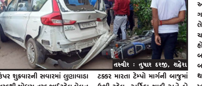
ઉપર શુક્રવારની સવારમાં લુણાવાડા તરફથી ગોધરા તરફ જઈ રહેલ લેલન ટૂકના ચાલકે ટેમ્પાના પાછળના ભાગે ટક્કર મારતા ટેમ્પો માર્ગની બાજુમાં ઉભી રહેલ અર્ધિકા ગાડી અને બે બાઈકને અડકેટ માં લીધી હતી. હાઈવે

શહેરા, શહેરા અણીયાદ ચોકડી પાસે પસાર થતા મુખ્ય હાઇવે માર્ગ ઉપર પુરઝડપે ગોધરા તરફ જઈ રહેલ લેલન ટૂકના ચાલકે ટેમ્પાના પાછળના ભાગે ટક્કર મારતા ટેમ્પો સહિત અર્ધિકા ગાડી અને બે બાઈકને નુકશાન પહોંચ્યું હતું. જ્યારે આ અકસ્માતના બનાવમાં કોઈ જાનહાનિ નહી થવા સાથે સ્થળ ખાતે મોટી લોકટોળા ઉમટી આવ્યા હતા.