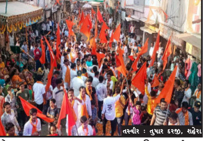
શહેરા, શહેરા મુખ્ય બજાર થી થઈ ઘાંચીવાડ વિસ્તારમાંથી થઈ સિંધી બજાર સિંધી ચોકડી બસ મથક તુષાર ઘરજી પરત રામજી મંદિર ફરી હતી. નોંધનીય છે કે, છેલ્લા કેટલાય દિવસથી વિશ્વ

શહેરા, શહેરા બે વર્ષથી કોરોના મહામારીના કારણે કેટલાયે તહેવારોમાં ઉજવણી શક્ય ન હતી બની પરંતુ કોરોનાની ત્રીજી લહેર પણ અસરદાર ન થતા સરકાર દ્વારા છૂટછાટ આપવામાં આવી હતી. આથી રવિવારના રોજ રામનવમી હોવાથી શહેરામાં રામજી મંદિરેથી શોભાયાત્રા કાઢવામાં આવે છે. જે અનુસંધાનમાં વિશ્વ હિન્દુ પરિષદ સંસ્થા દ્વારા રવિવારના રોજ બપોરના ચાર કલાકે રામજી મંદિરેથી મર્ચાંદા પુરુષોત્તમ રામની શોભાયાત્રા કાઢવામાં આવી હતી.