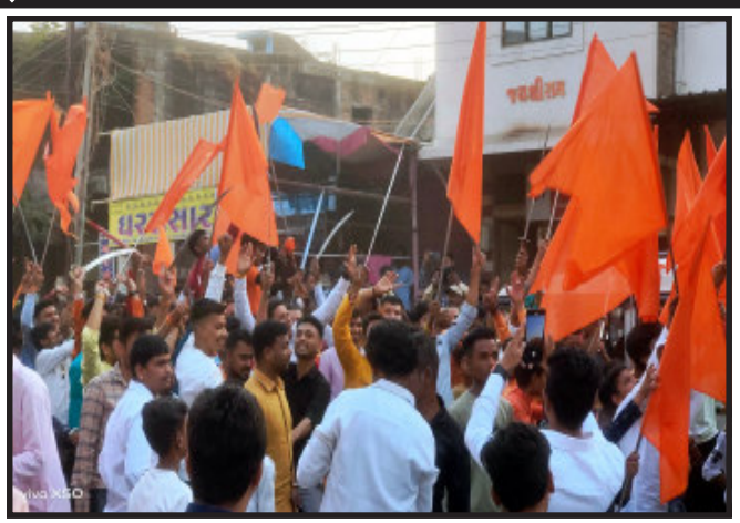
કેસરિયા ઘજ સાથે રંગત જમાવી શોભાયાત્રાની શરૂઆત