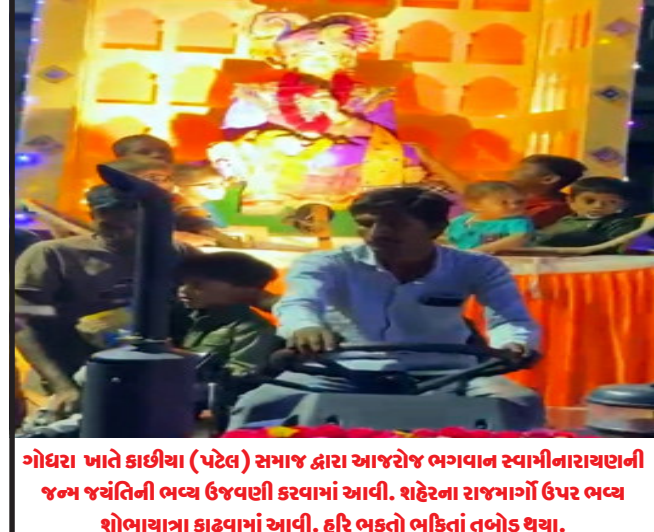
ગોધરા ખાતે કાલીયા (પટેલ) સમાજ દ્વારા આજરોજ ભગવાન સ્વામીનારાયણની જન્મ જયંતિની ભવ્ય ઉજવણી કરવામાં આવી. શહેરના રાજમાર્ગો ઉપર ભવ્ય શોભાયાત્રા કાઢવામાં આવી. દરિ ભક્તો ભક્તિ તંબોડ થયા.

ગોધરા, ગોધરા શહેરની સ્ટાડ ગોધરા સબ પોસ્ટ ઓફિસને વ્યવસ્થા પામે છે. ગોધરા શહેરની ને લાખની વસ્તી હોઈ ગોધરા શહેરમાં બામરોલી રોડ ખાતે નવીન સબ પોસ્ટ ઓફિસ બનાવવા લેખિત રજુઆત કરેલ હતી. જેને લઈને આ વિસ્તારમાં આવેલ ૧૦૦ થી વધુ સોસાયટીઓ ઉપરાંત નજીકના ગ્રામ્ય વિસ્તારના લોકો પણ સેવાનો લાભ લઈ શકે તેવી રજુઆત કરી હતી. માજી સાંસદની રજુઆતના પગલે પોસ્ટ વિભાગની વડી કચેરી દ્વારા બામરોલી રોડ ખાતે નવીન સબ પોસ્ટ ઓફિસ મંજૂર કરેલ છે. અને ચૌહાણને ગોધરાના શહેરીજનો અને ગ્રામજનોએ રજુઆત કરતા સાંસદે પોસ્ટ વિભાગના ઉચ્ચ અધિકારીઓને