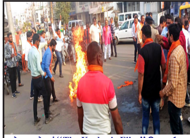
ગોધરા શહેરમાં “The Kashmir Files” પિકચર ઉપર દિલ્હીના મુખ્યમંત્રી અરવિંદ કેજરીવાલે જે ટિપ્પણી કરી છે. તેના વિરોધમાં અરવિંદ કેજરીવાલના પૂતળાનું દહન કરવામાં આવ્યું. અરવિંદ કેજરીવાલે વડાપ્રધાન નરેન્દ્રભાઈ મોદી માટે જે નિમ્નકક્ષાની રાજનીતિ કરી તેને ભારતીય જનતા યુવા મોરચો ગોધરા તાલુકા તથા ગોધરા શહેરના યુવા સભ્યો દ્વારા વખોડી કરાવ્યું હતું.

સુધી લાંબા થવું પડતું હોય છે. તેમાં પણ કસ્બા તલાટી કચેરી અનિયમિત ખુલવાના કારણે તેમજ કચેરી ખુલ્લી હોય ત્યારે તલાટી હાજર મળતા ન હોવાથી અરજદારોને પરેશાની વેઠવાનો વખત આવ્યો છે. જ્યારે આજરોજ કસ્બા કચેરી ન ખુલવા મુદ્દે મામલતદારને રજુઆત કરવામાં આવી છે. ત્યારે આશા રાખી શકાય કે કસ્બા કચેરી નિયમિત ખુલ્લી રહેશે.