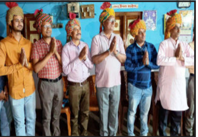
પોણા અગિયાર વાગ્યા સુધી સૌ આબાલવૃદ્ધ ગ્રામજનોએ સભામાં બેસી રહી સતત કવિઓને ધ્યાનથી સાંભળ્યા, અને ખોબલે ખોબલે દાદ આપી હતી.

ગોધરા, રાયસિંગપુરા પ્રાથમિક શાળા ખાતે જિલ્લાના કવિમિત્રોની સાથે કવિ સંમેલનનું આયોજન થયું હતું. એક અદભુત અને અવિસ્મરણીય અનુભવ. ગામને પાદર આવીને તમામ ગામલોકોએ કવિઓને સાફ પહેરાવ્યા, વાજતે-ગાજતે ઢોલ નગારા અને સ્વાગતગીતોના ગાન સાહિત ભવ્ય શોભાયાત્રા કરી, ગામના ચોકમાં આવ્યા બાદ કંકુ ચોખા કર્યા, શિરે પુષ્પોનો અભિષેક કર્યો હતો અને સભાસ્થળે લાવીને સાદર આસનસ્થ કર્યા. આ શોભાયાત્રા ગામના મુખ્ય માર્ગો પર ફરી ત્યારે પાટણના સિદ્ધરાજ જયસિંહનાં એ સમચની યાદ આવી ગઈ હતી.