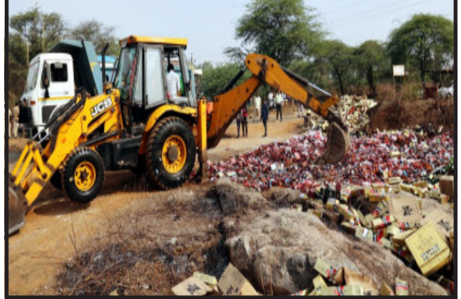
કોર્ટ દ્વારા મંજૂરી આપવામાં આવતા આજે ગોધરા તાલુકાના ભેખડીયા ગામ પાસે ગોધરા શહેરા પ્રાંત અધિકારી અને ગોધરા ડીવાયએસપીની ઉપસ્થિતિમાં બુલડોઝર ફેરવી નાશ કરવામાં આવ્યો હતો.

ગોધરા, ગોધરા ડીવીઝનના છ પોલીસ મથકમાં એક વર્ષ દરમિયાન ૩૬૭ ગુનાઓમાં ઝડપાયેલા ૪.૨૦ કરોડના વિદેશી દારૂના જથ્થાનો આજે ગોધરા તાલુકાના ભેખડીયા ગામે સરકારી પડતર જમીનમાં ડીવાયએસપી અને પ્રાંત અધિકારીની ઉપસ્થિતિમાં બુલડોઝર ફેરવી નાશ કરવામાં આવ્યો હતો.