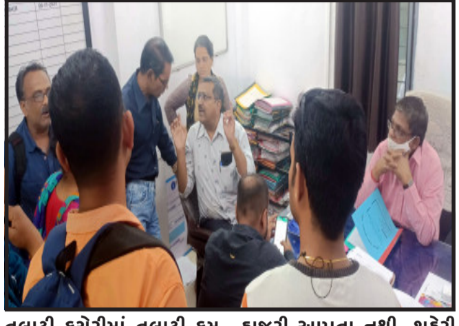
તલાટી કચેરીમાં તલાટી કમ હાજરી આપતા નથી. શહેરી મંત્રીઓ રેગ્યુલર કચેરીમાં વિસ્તારના અરજદારોને

ગોધરા, ગોધરા કસ્બા તલાટીની કચેરી નિયમિત અને સમયસર નહીં ખોલવા આવતાં અરજદારોને ઘડકા ખાવા પડી રહ્યા છે. આજરોજ કસ્બા તલાટી કચેરી બપોર સુધી નહીં ખોલવામાં આવતાં કચેરી બહાર રાહ દેખતા અરજદારો દ્વારા ગોધરા મામલતદાર કચેરી ખાતે પહોંચીને રજુઆત કરવામાં આવી.