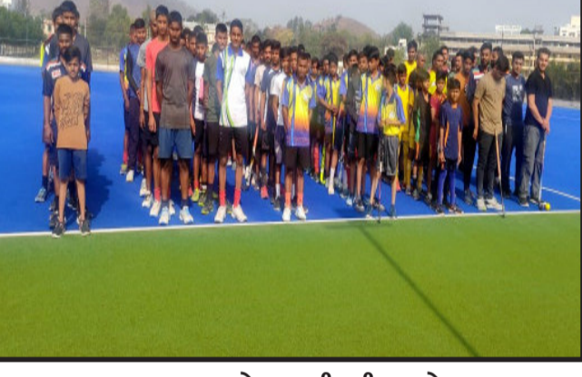
દાહોદ, આ મેદાન પર રાષ્ટ્રીય રમત હોકીના મહારથીઓ તૈયાર થઈ રહ્યાં છે. આ ખેલ મહાકુંભ ૨૦૨૨ નો શાનદાર નજારો છે. દાહોદના આદિવાસી ખેલાડીઓએ નવનિર્મિત દેવગઢ બારીયાના હોકીમેદાન પર બરાબરની જમાવટ