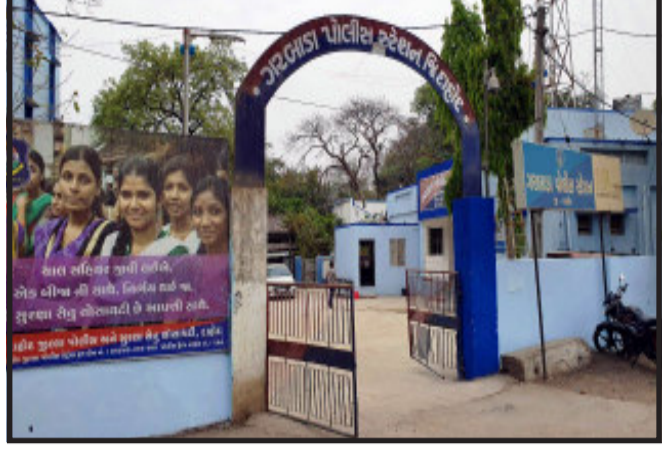
લઈ જતા દરમિયાન પોલીસના ગેટને પહોં નુકશાન કર્યું હોવાનું જાણવા મળ્યું છે.

દાહોદ, દાહોદ જિલ્લાના ગરબાડામાં પોલીસે ગતરોજ પેટ્રોલિંગ દરમિયાન પ્રોહીના મુદ્દામાલ સાથે એક ફોર વહીલર ગાડી સાથે એક ઈસમને ઝડપી લીધો હતો જેમાં એક ઈસમ પોલીસને ચક્રમો આપી ભાગી ગયો હતો. ત્યારબાદ પોલીસે પ્રોહીનો મુદ્દામાલ તેમજ ગાડીનો કબ્જો મેળવી પોલીસ મથકમાં મૂકી દેવામાં આવી હતી. જે દારૂનો મુદ્દામાલ ભારલી ગાડીને મધ્યરાત્રીએ આવેલા ચાર ઈસમોએ પોલીસને પડકાર ફેંકી વિદેશી દારૂનો જથ્થો ભરેલી ગાડીને પોલીસ મથકમાંથી ઉઠાવી લઈ જતા પંથક સહીત પોલીસ બેડામાં ખળભળાટ મચી જવા પામ્યો છે. પંથકમાં ભુલેગર તત્વો બેફામ બન્યા હોઈ તેમ વિદેશી દારૂની ગાડીને પોલીસ મથકમાંથી બિનદારૂત પહોં ઉઠાવી