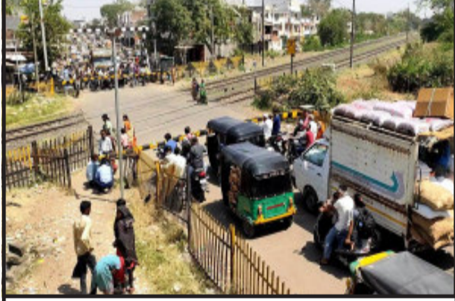
રેલ્વે વિભાગની ટીમ કામે લાગી હતી. હોળીના તહેવારને લઈ ખરીટી માટે ભારે ભીડ વચ્ચે ફાટક ખોરકાતા લોકો હેરાન પરેશાન થયા હતા. શહેરા ભાગોળ દ્વારા ફાટકના રીપેરિંગ કામ શરૂ કરાયું હતું. નગરજનો માંગ કરી રહ્યા છે કે, રેલ્વે અંદર પાસની કામગીરી વહેલી શરૂ કરીને ફાટકની સમસ્યાથી કાચમી છુટકારો અપાવે તે જરૂરી છે. ગોધરા શહેરા ભાગોળ રેલ્વે ફાટક આજરોજ બપોરના સમયે ખોરકાતા ફાટકની બંને તરફ ટ્રાફિક જામના દ્વંશ્યો સર્જ્યા હતા. બપોરના સમયે કાળઝાળ ગરમી વચ્ચે બંને તરફ વાહન ચાલકો મુશ્કેલીમાં મુકાયા હતા. શહેરા ભાગોળ રેલ્વે ફાટકનું રીપેરિંગ કામ