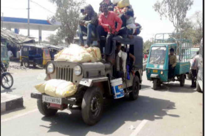
રણાતા આખરે આવા પરિવારો પરપ્રાંતમાં મજુરી કામ અર્થે નીકળી જતા હોય છે. આમેય દાહોદ જિલ્લામાં રોજગારીના અભાવે પણ આવા પરિવારોનો મોભીયો, વડીલો જતા હોય છે.

દાહોદ, દિવાળી તો અટકે કટકે પણ હોળી તો ઘરે જ ની કહેવત પ્રમાણે દાહોદ જિલ્લાના આદિવાસી ભાઈઓ-બહેનો જે મજુરી કામ અર્થે પરપ્રાંતમાં ગયા હતા. જેઓ હવે દાહોદ જિલ્લામાં હોળીનો તહેવાર મનાવવા પરત ફરી રહ્યા છે. શહેરના બસ સ્ટેશન, રેલ્વે સ્ટેશન ખાતેની બસો તેમજ ટ્રેનોમાં આ સમાજના લોકોની ભારે ભીડ જવા મળી હતી. પોતાની સાથે ઘરવખરીનો સામાન સહિત ખાણીપીણીની ચીજ સાથે જવા મળ્યા હતા. આદિવાસી સમાજમાં હોળીનું અનેરૂ મહત્વ હોય છે.