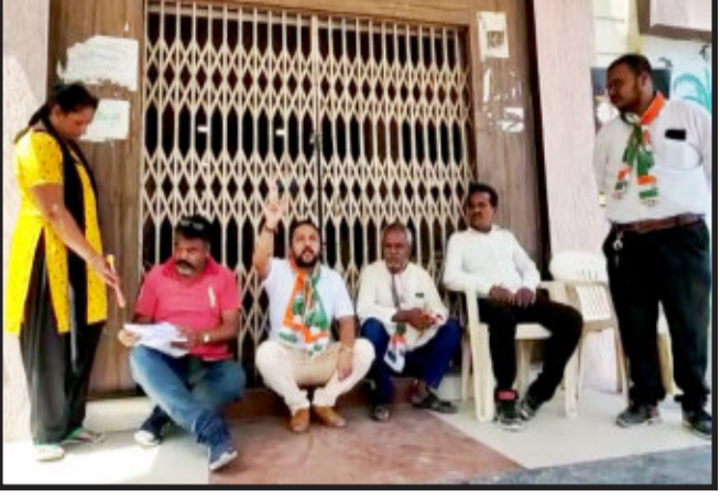
હાલોલ, જાહેર માર્ગો ઉપર ઉડતી ઘાલોલ નગરમાં ધુળની ડમરી તેમજ શહેરના