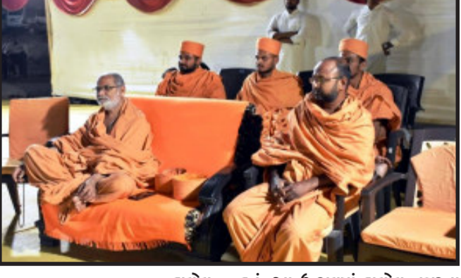
હાલોલ, હાલોલ, હાલોલ ખાતે આવેલ

ઉત્સવ પ્રિય : ખલુ માનવા એ જ નમાનસના મર્મજા ભગવાન સ્વામિનારાયણે વારંવાર ઉત્સવ ઉજવીને મુખ્યકોને વિશેષ ધર્માભિમુખ કર્યા છે. લોથા ગામમાં ભગવાન સ્વામિનારાયણે જાતે ૧૮ મણ ધીનો વધાર કરી, ૬૦ મણ રીંગણાનું શાક બનાવી ભક્તોને જાતે પીરસીને જમાડેલા એ ઉત્સવની સ્મૃતિ પ.પૂ.મહંત સ્વામી મહારાજની પ્રેરણાથી હાલોલ ગોધરા બાયપાસ રોડ પર આવેલ BAPS સ્વામિનારાયણ મંદિર ખાતે શાકોત્સવનું આયોજન કરવામાં આવેલ હતું. આ ઉત્સવમાં હાલોલ નગરના તેમજ આજુબાજુના ભક્તો તેમજ મહાનુભાવો પધાર્યા હતા. આ ઉત્સવ સાથે સાથે ક્ષીરન ભક્તિનું આયોજન પણ કરવામાં આવ્યું હતું. જેમાં સંતો તેમજ યુવકો દ્વારા સંગીતમય ભક્તિ રજુ કરવામાં આવી હતી. આ અવસરે BAPS સ્વામિનારાયણ મંદિર, ગોધરાના કોશ્લરી સ્વામી પૂ.બ્રહ્મજીવન સ્વામી પધાર્યા હતા. તેમજ આ સમગ્ર કાર્યક્રમનું આયોજન વિસ્તારના સંત નિર્દેશક પૂ. વાણીરાજ સ્વામી તેમજ હાલોલ સત્સંગ મંડળ દ્વારા કરવામાં આવ્યું હતું.