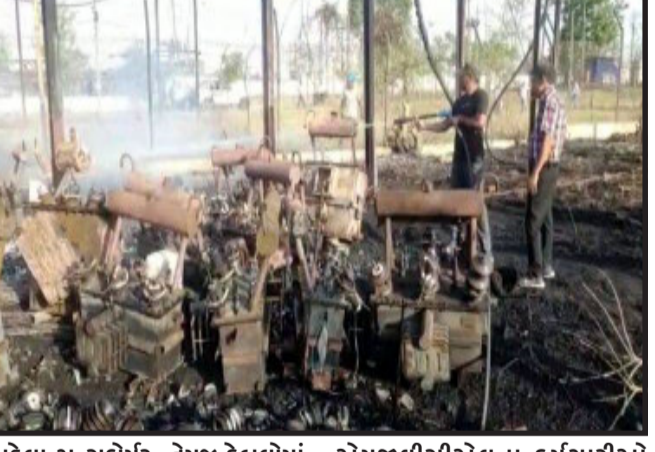
પડેલા ટ્રાન્સફોર્મર, તેમજ કેબલોમાં આગના ફાટાળા

સ્થળે દોડી આવ્યા હતા અને આ આગના બનાવની જાણ દાહોદ અગત્યસમક ઇન્જનેરીના અગત્યસમક ઇન્જિનિયરના કર્મચારીઓ ઘટનાસ્થળે પહોંચી આગ પર પાણીનો મારો ચલાવી આગને ઓલવી મોટી હોનારત સર્જતા બચાવી લીધી હતી. જોકે, આગના બનાવના પગલે દાહોદના મોટાભાગના વિસ્તારોમાં વીજ પુરવઠો બંધ થઈ જતા દાહોદના શહેરીજનોને હાલાકીનો સામનો કરવો પડ્યો હતો. આગના બનાવના પગલે એમજીવીસીએલ કંપનીને અંદાજે લાખો રૂપિયાનું નુકસાન પહોંચ્યું હતું.