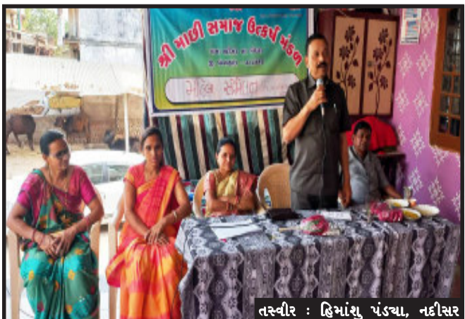
તસ્વીર : હિમાંશુ ચંડયા, નદીસર

નદીસર, માઈ સમાજ ઉત્કર્ષ મંડળ નદીસર દ્વારા માઈ સમાજની મહિલાઓ માટે મહિલા સંમેલન યોજવામાં આવ્યું. આ સંમેલનમાં સમાજની ૨૦૦ ઉપરાંત બહેનોએ રસપૂર્વક ભાગ લીધો હતો. મહિલા સંમેલન દરમ્યાન સમગ્ર કાર્યક્રમનું સંચાલન મહિલા દ્વારા કરવામાં આવ્યું હતું. આ સંમેલનમાં સમાજની કર્મચારી બહેનોનું સન્માન કરવામાં આવ્યું હતું. સમાજની ત્રણ દીકરીઓ પી.એચ.ડી. કરતી હોવાથી તેમનું પુરસ્કારનું પ્રતિષ્ઠાપત્ર આપવામાં આવ્યું હતું.