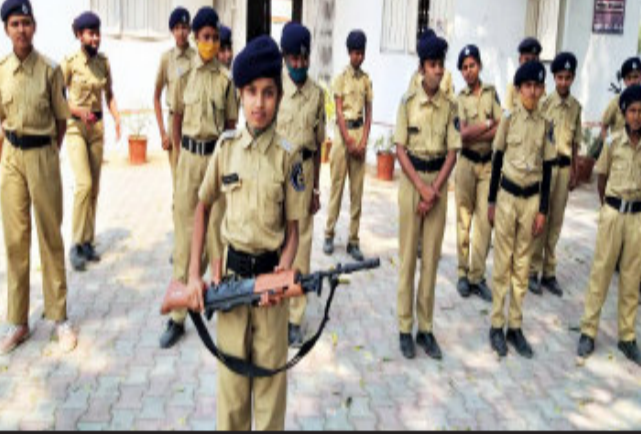
ડસ્ટાવેજ સાથે રાખી ઈન્ડ બર્થો પહે તેના કલ્પા સાવચેત રહેવા માટે S.P.C. બાળકો દ્વારા સલાહ આપી હતી. તેમજ કાંકણપુર પોલીસ

ગોધરા, પંચમહાલ જીલ્લા સુરક્ષા સોસાયટી અંતર્ગત કાંકણપુર પોલીસ સ્ટેશન અને રતનપુર(કાં) પ્રાથમિક શાળાના સ્ટુડન્ટ પોલીસ કેડેટ એ ૬૧-યોકડી ઉપર ચાર રસ્તા ઉપર વાહન ચાલકોને ગુલાબફૂલ આપીને ડ્રાફ્ટ નિયમનું પાલન કરવા સમજાવ્યા હતા. બાળકો ગાણેશ પહેરીને અમદાવાદ-ઈન્દોર હાઈવે પર આવતા જતા વાહન ચાલક ને ડ્રાફ્ટ ના નિયમ સ્થિર કરી હતી. વાહનની સાથે પી.યુ.સી., ડ્રાઈવિંગ લાઈસન્સ અને સીટ બેલ્ટ લાગવા માટે અપીલ કરી હતી. ડ્રાફ્ટિંગના નિયમો હવે કડક પાલન કરવા માટે ઈન્ડિયા રકમમાં તોરિંગ વધારો કરવામાં આવ્યો છે. ત્યારે જરૂરી