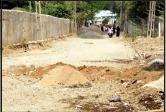
તસ્વીર : તુષાર દરજી, શહેરા

ગોધરા, ગોધરા શહેરના પશ્ચિમ વિસ્તારમાં લાંબા સમયથી અટકી પડેલ રસ્તાની કામગીરી શરૂ કરવામાં આવી છે પરંતુ રસ્તાની કામગીરી કરતા કોન્ટ્રાક્ટર દ્વારા રોડની કામગીરીમાં હલ્કી ગુણવત્તાવાળું મટીરીયલ્સ ઉપયોગ કરવાના આક્ષેપો સ્થાનિકો દ્વારા લગાડવામાં આવ્યા છે. હલ્કી ગુણવત્તાના આક્ષેપના મામલે તંત્ર દ્વારા યોગ્ય તપાસ કાર્યવાહી કરવાની ખાત્રી