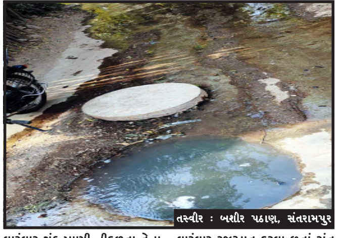
તસ્વીર : બશીર પઠાણ, સંતરામપુર

સંતરામપુર, સંત વિસ્તારમાં ભૂગર્ભ ગટરની ઉભરાતી ગટરો સ્થાનિક રહીશોએ લેખિત અને મૌખિક માં છેલ્લા બે માસથી અનેકવાર રજૂઆત કરવા છતાં નગરપાલિકા દ્વારા કામગીરી કરવામાં આવતી નથી. આના કારણે સ્થાનિક રહીશોની રસ્તા ઉપરથી પસાર થવા માટે રોડ ઉપર ફેલાવું ગંદુ પાણી માંથી પસાર થવું પડતું હોય છે. મચ્છર નો ઉપદ્રવ વધી રહ્યો છે. ગંભીર બીમારીનો પણ પ્રશ્ન ઉભો થયો છે. આ વિસ્તારમાં સ્થાનિક રહીશોની અવરજવર કરવા માટે માત્ર એક જ રસ્તો સ્થાનિક રહીશોએ કંટાળીને