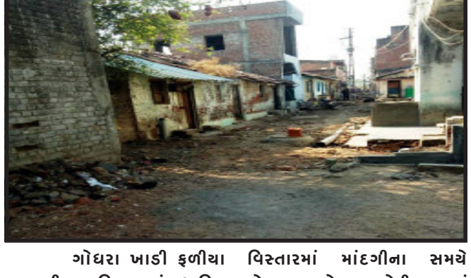
ગોધરા ખાડી ફળીયા મારવાડીવાસ વિસ્તારમાં સ્થાનિક રહીશો દ્વારા જાહેર સરકારી રસ્તા ઉપર પરના દબાણો માટે કાયદેસર કાર્યવાહી કરવામાં આવે તે જરૂરી છે.

ગોધરા, ગોધરા પાલિકા વિસ્તારના ખાડી ફળીયા, મારવાડીવાસમાં જાહેર રસ્તા ઉપર દબાણ કરવામાં આવેલ હોય જેને લઈને બિમારી અને આકસ્મિક સંજોગોમાં એમ્બ્યુલન્સ કે ફાયર ફાઈટર આવી શકે તેવી સ્થિતિ ન હોય જેને લઈ રસ્તા ઉપરના દબાણો દુર કરવા રજુઆત કરવામાં આવતાં દબાણકર્તાઓને નોટીસ આપીને સ્વેચ્છાએ દબાણો દુર કરવા નોટીસ આપવામાં આવી હતી. તેમ છતાં દબાણો દુર કરવામાં નહિ આવતાં સ્થાનિક રહીશો દ્વારા જાહેર સરકારી રસ્તા ઉપર પરના દબાણો માટે કાયદેસર કાર્યવાહી કરવામાં આવે તે જરૂરી છે.