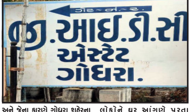
અને જેના કારણે ગોધરા શહેરના વેપાર ધંધા અને વિકાસ ઉપર તેની માઠી અસરો આજદિન સુધી જોવા મળે છે, પણ હવે ગોધરા વિકાસ ઝંપે છે અને ઔદ્યોગિક શહેર તરીકેની નવી ઓળખ માંગે છે. ગોધરા રાજ્યના અન્ય મહાનગરોની સરખામણીમાં ઘણું પાછળ છે, ગોધરા શહેરની જીઆઈડીસીનો અને ઔદ્યોગિક વિકાસ થઈ શક્યું નથી. શહેરમાં કોઈ મોટા ઉદ્યોગો કે કંપનીઓ નથી, ઉલ્ટાનું જે તે સમયે પંચમહાલ જિલ્લામાંથી દાહોદ અને મહીસાગર જિલ્લાનું વિભાજન થવાના કારણે ગોધરા શહેરના વેપાર ધંધા ખલાસ થઈ ગયા છે, જેના કારણે સ્થાનિક

ગોધરા, ગોધરા શહેરમાં બેરોજગાર યુવાનોને રોજગારીની તકો ઊભી થાય તે માટે તંત્ર દ્વારા વિચારવામાં આવે તે હાલની પરિસ્થિતિને જોતા અત્યંત જરૂરી છે. જ્યારે જીઆઈડીસી વિસ્તારમાં વધુ ઉદ્યોગો અને કંપનીઓ આવે તો રોજગારીની તકો ઊભી થાય તેવી શક્યતા હાલ રહેલી હોય જેને લઈને સામાજિક કાર્યકર દ્વારા રાજ્યના મુખ્યમંત્રી ભુપેન્દ્ર પટેલને આ મામલે રજૂઆત કરાઈ હતી.