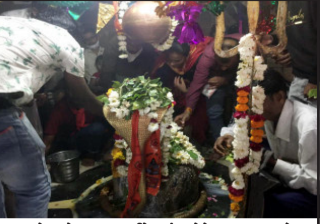
દાહોદ શહેર નજીક કાળીકેમમાં ખાતે કેદારનાથ ધામએ શિવજીના મંદિરમાં શિવરાત્રી નિમિત્તે ભક્તજનો પૂજા અર્ચના કરવા મોટી સંખ્યામાં લોકો ઉમટ્યા.

દેવામાં આવ્યા હતા. શિવરાત્રીની રાત્રીએ પણ શિવ મંદિરો ખાતે મોટી સંખ્યામાં શિવ ભક્તો દર્શન માટે ઉમટી પડ્યા હતા. દાહોદ તાલુકાના ગામે આવેલ પૌરાણિક શિવ મંદિર ખાતે મેળાનું આયોજન પણ કરવામાં આવ્યું હતું. મેળામાં મોટી સંખ્યામાં લોકો ઉમટી પડ્યા હતા તેવી જ રીતે દાહોદ તાલુકાના કાળી કેમ ખાતે આવેલ શિવ મંદિર ખાતે પણ લોકો દર્શન માટે ઉમટી પડ્યા હતા. દાહોદમાં સિંધી સમાજ દ્વારા પણ શિવરાત્રિ ધામધૂમપૂર્વક ઉજવણી કરવામાં આવી હતી. ઘણી જગ્યાએ શિવરાત્રી નિમિત્તે પ્રસાદી તેમજ ભંડારાનું પણ આયોજન કરવામાં આવ્યું હતું.