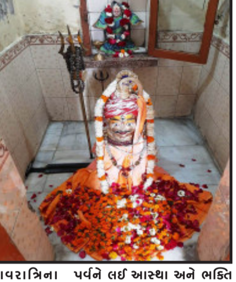
શિવરાત્રિના પર્વને લઈ આસ્થા અને ભકિત

ગોધરા, પંચમહાલ જિલ્લામાં શિવરાત્રિના પાવન પર્વએ શિવાલયો હર હર મહાદેવના નાંદથી ગુંજી ઉઠ્યા. વહેલી સવારથી ભાવિ ભકતો શિવાલયોમાં પહોંચી ભકિતમાં લીન બન્યા હતા. ગોધરા શહેર સહિત તમામ શિવાલયોમાં ભાવિ ભકતોનો જમાવડો જોવા મળ્યો હતો. ગોધરા શહેરના અંકલેશ્વર મહાદેવ મંદિર, લાલબાગ ટેકરી મહાદેવ મંદિર, આદિત્યનાથ મહાદેવ મંદિર, સહિતના શિવાલયોને શિવરાત્રિના પાવન પર્વને લઈ કુલ ૧૧ થી શણગારવામાં આવ્યા હતા. જિલ્લાના શહેરાના મરડેશ્વર મહાદેવ, ગળતેશ્વર મહાદેવ મંદિર સહિતના પાવન પર્વને શિવરાત્રિના પર્વને લઈ આસ્થા અને ભકિત