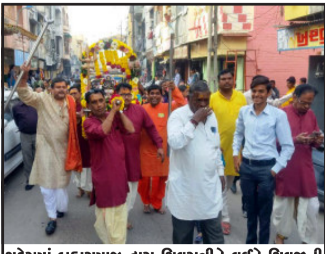
શહેરામાં બ્રહ્મસમાજ દ્વારા શિવરાત્રીને લઈને શિવજીની ભવ્ય શોભાયાત્રા નગરના મેઈન બજાર, હોળી ચકલા સહિત વિસ્તારોમા નીકળી હતી. જ્યારે શોભાયાત્રા દરમિયાન શિવજીના ભકિતમય ગીતો વચ્ચે શિવ ભકતો ખુશીથી ઝુમી ઉઠવા સાથે વાતાવરણ ભકિતમય બની ગયું હતું.

દર્શન કરવાથી જ્યોતિર્લિંગ મેળોભરાયો હતો આ ના દર્શન જેટલું જ પુણ્ય શિવલિંગ શિવરાત્રીની રાત્રીએ ચોખા ના દાણા જેટલું વધતું હોવાની લોક માન્યતા પણ છે. મંદિર ખાતે બ્રહ્માકુમારી દ્વારા આધ્યાત્મિક પ્રદર્શન રાખવામા આવેલ હતુ આ વર્ષે પણ પરંપરા મુજબ