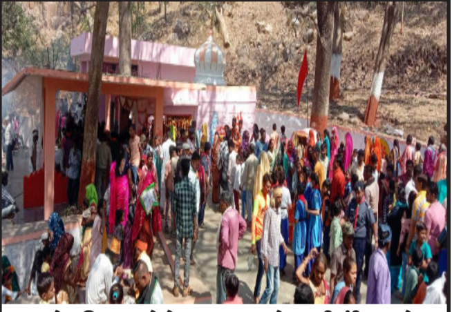
દાહોદ જિલ્લાના જેકોટ ગામ નજીક દેવ જરી મંદિર ખાતે શિવરાત્રી નિમિત્તે ભક્તજનો પૂજા અર્ચના કરવા મોટી સંખ્યામાં લોકો ઉમટ્યા.