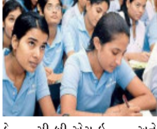
કે સી.બી.એસ.ઈ. અને આઈ.સી.એસ.ઈ. બોર્ડ આ કેસમાં પક્ષકાર નથી. તેથી તેમને નિર્દેશ આપી શકાય નહીં. આગામી શૈક્ષણિક વર્ષમાં શાળાઓ ખૂલે ત્યારે પરિસ્થિતિ પ્રમાણે નિર્ણય કરવામાં આવશે. વધુ સુનાવણી માટે કેસને સાતમી જૂનના રોજ નિયત કરવામાં આવી છે અને જરૂર લાગે તો અરજદારને વેકેશન બેન્ચ સમક્ષ રજૂઆત કરવાની છૂટ અપાઈ છે. રિટમાં અરજદાર તરફથી રજૂઆત કરવામાં આવી હતી કે રાજ્યમાંથી હજુ પણ કોરોનાનો ખતરો સંપૂર્ણપણે ટપ્યો નથી. આવી પરિસ્થિતિમાં રાજ્ય સરકારે ધોરણ ૧થી ૧૨માં ૧૦૦ ટકા ઓફલાઈન હાજરીની જરૂર નથી. જેથી અરજદારે દલીલ કરી હતી કે રાજ્ય બોર્ડની શાળાઓ જ નહીં પરંતુ સરકાર જોખમ લઈ રહી છે. તેથી કોર્ટે રાજ્ય સરકારને જરૂરી આદેશો આપવા જોઈએ. જેથી કોર્ટે કહ્યું હતું

અમદાવાદ, ગુજરાતના સ્કૂલોમાં વિદ્યાર્થીઓને ૧૦૦ ટકા ઓફલાઈન હાજરી અંગેના રાજ્ય સરકારના નિર્ણય સામે ગુજરાત હાઈકોર્ટમાં કરવામાં આવેલી રિટમાં રાજ્ય સરકારે આજે સ્પષ્ટતા કરી હતી કે ચાલુ ધોરણ ૧થી ૧૨માં શૈક્ષણિક વર્ષ ૨૦૨૧-૨૨માં પરીક્ષામાં બેસવા માટે ૧૦૦ ટકા ઓફલાઈન હાજરીની ફરજિયાત નથી. આ ઉપરાંત કોર્ટે કહ્યું હતું કે જ્યારે શાળાઓ ફરી ખૂલે ત્યારે પરિસ્થિતિ પ્રમાણે નિર્ણય કરવામાં આવશે. કેસની વધુ સુનાવણી સાતમી જૂનના રોજ નિયત કરવામાં આવી છે.