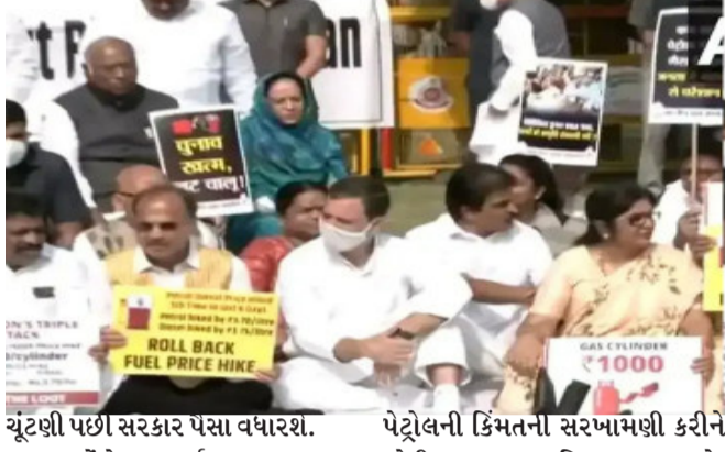
ચૂંટણી પછી સરકાર પૈસા વધારશ. કોંગ્રેસના પૂર્વ અધ્યક્ષ રાહુલ ગાંધીએ પેટ્રોલ અને ડીઝલના ભાવોમાં થઈ રહેલા સતત વધારાને લઈને કેન્દ્ર સરકાર પર નિશાન સાધ્યું છે. રાહુલ ગાંધીએ દિવટ દ્વારા પણ પડોશી દેશોમાં પેટ્રોલની કિંમતો સાથે ભારતમાં

કોંગ્રેસના નેતાઓ સહિત કાર્યકરોએ મોટી સરકાર વિરુદ્ધ સૂત્રોચ્ચાર કર્યા હતા. આ દરમિયાન રાહુલ ગાંધીએ કહ્યું કે આજે અહીં અમારા કોંગ્રેસના સાંસદો અને દરેક રાજ્યમાં અમારા નેતાઓ પેટ્રોલ અને ડીઝલના ભાવ વધારાનો વિરોધ કરી રહ્યા છે. અમારી માંગણી છે કે પેટ્રોલ અને ડીઝલના ભાવ વધારાને રોકવામાં આવે. તેની અસર ગરીબોને પડી રહી છે. ગેસ સિલિન્ડરના ભાવ બમણા થઈ ગયા, આનું ઇતિહાસમાં ક્યારેય બન્યું નથી. સરકારનો સ્પષ્ટ એજન્ડા છે કે ગરીબોમાંથી પૈસા કાઢીને બંધી ત્રણ અબજપતિઓને આપવામાં આવે. રાહુલે વધુમાં કહ્યું કે ચૂંટણી સમયે પણ અમે લોકોને કહ્યું હતું કે હવે પેટ્રોલ લો,