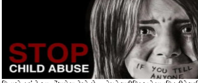
સિવાએ કહ્યું કે આ નોંધાયેલા કેસો છે અને એવા ઘણા કેસ છે જે નોંધાયા પણ નથી. કોવિડ રોગચાળાના સમયગાળા દરમિયાન ૨૦૨૦ માં બાળકોના જાતીય શોષણના કેસોની સંખ્યામાં ઘટાડો થયો હતો પરંતુ હવે તે ફરીથી વધવા લાગ્યો છે. શિવે કહ્યું કે 'આપણા સમાજમાં બાળકો મૂબ નબળા હોય છે. તેમની સામે આ પ્રકારનું યૌન શોષણ

નવીદિલ્હી, દેશમાં સતત વધી રહેલાં બાળ શોષણનાં કેસ પર ચિંતા જતાવાતા દ્રમ્યુક નેતા તિરુચિ શિવાએ રાજ્યસભામાં જોર આપીને કહ્યું કે, વિદ્યાર્થીઓ અને શિક્ષકોમાં આ માટે જાગૃત બનાવવા પર જોર દેતા કહ્યું કે, આ માટે સ્કૂલોમાં નિયમિત રૂપથી કાર્યશાળાઓનું આયોજન કરવું જોઈએ. રાજ્યસભામાં શૂન્યકાળ દરમિયાન આ મુદ્દો ઉઠાવતા દ્રમ્યુક સાંસદ તિરુચિ શિવાએ કહ્યું કે, રાષ્ટ્રીય અપરાધ રેકોર્ડ બ્યૂરોનાં રિપોર્ટ અનુસાર, ૨૦૧૮ અને ૨૦૨૦ની વચ્ચે યૌન અપરાધથી બાળકોનું સંરક્ષણ નિયમ હેઠળ આશરે ૪૦,૦૦૦ કેસ દાખલ કરવામાં આવ્યાં છે. ડીએમકેના સાંસદ તિરુચિ શિવાએ કહ્યું કે આ નોંધાયેલા કેસો છે અને એવા ઘણા કેસ છે જે નોંધાયા પણ નથી. કોવિડ રોગચાળાના સમયગાળા દરમિયાન ૨૦૨૦ માં બાળકોના જાતીય શોષણના કેસોની સંખ્યામાં ઘટાડો થયો હતો પરંતુ હવે તે ફરીથી વધવા લાગ્યો છે. શિવે કહ્યું કે 'આપણા સમાજમાં બાળકો મૂબ નબળા હોય છે. તેમની સામે આ પ્રકારનું યૌન શોષણ