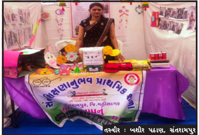
માર્ગદર્શન અંગે હતું. જેને અધિકારીઓ અને શિક્ષક

સંતરામપુર, શિક્ષણવિભાગ અને ઇ.સી.ઈ.આર.ટી ગાંધીનગર પ્રેરિત જિલ્લા શિક્ષણ અને તાલીમ ભવન ઈડર આયોજિત રાજ્યકક્ષાના એ જ્યુકેશન ઈનોવેશન ફેસ્ટિવલ ૨૦૨૧-૨૨માં સંત ગામની સંત શિક્ષણાનુભવ પ્રાથમિક શાળાના વર્ષાબિન પ્રજાપતિએ પોતાનું ઈનોવેશન 'હું કોણ? ઘરનો મોલ કે શોભ? રજૂ કર્યું હતું. જે ઈકીટીઓને લાગતા વિવિધ પ્રશ્નો, મુંજવાણ