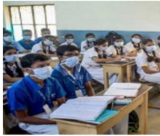
કારણે માર્ચ ૨૦૨૦થી સ્કૂલો-કોલેજો તબક્કાવાર બંધ કરાઈ હતી અને સમયાંતરે શરૂ પણ કરાઈ હતી. જોકે, તેમાં ઓનલાઈન શિક્ષણ અને ઓફલાઈન શિક્ષણ એમ બંને વિકલ્પો અપાયા હતા. પરંતુ હવે ઓનલાઈન

અમદાવાદ, રાજ્યમાં બે વર્ષ બાદ ફરી આજથી સ્કૂલો-કોલેજો ઓફલાઈન થયા છે. આજથી ઓનલાઈન શિક્ષણનો વિકલ્પ આપવામાં નહીં આવે. જેથી વિદ્યાર્થીઓની હાજરી ફરજિયાત રહેશે. સરકારની કોર કમિટીની બેઠકમાં આ મહત્વનો નિર્ણય લેવામાં આવ્યો હતો. જેથી ફરી આજથી સ્કૂલો વિદ્યાર્થીઓ અભ્યાસ માટે શાળા કોલેજોમાં પહોંચ્યા હતાં. કોરોનાનાં