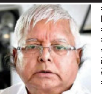
જજ એસકે શર્માએ વીડિયો કોન્ફરન્સિંગ દ્વારા સજાની જાહેરાત કરી છે. હાલમાં રિસ્સમાં દાખલ છે. હકીકતમાં, સોમવારે બપોરે એક વાગ્યે સીબીઆઈની સ્પેશિયલ કોર્ટમાં વીડિયો કોન્ફરન્સિંગ દ્વારા ડોરોડા ટ્રેડર કેસની સુનાવણી ચાલી

રાંચી, દેશના સૌથી મોટા અને જાણીતા ઘાસચારા કૌભાંડના મામલામાં ડોરોડા ટ્રેડર કેસમાં સીબીઆઈની વિશેષ અદાલતે પોતાનો ચુકાદો આપ્યો છે. બિહારના પૂર્વ મુખ્યમંત્રી અને રાષ્ટ્રીય જનતા દળના સુપ્રીમો લાલુ પ્રસાદ યાદવને આ મામલામાં દોષિત ઠેરવવામાં આવતા તેમને ૫ વર્ષની જેલની સજા ફટકારવામાં આવી છે. આ સાથે ૬૦ લાખનો દંડ પણ ફટકારવામાં આવ્યો છે. ૧૩૮ કરોડ રૂપિયા ગેરકાયદે ઉપાડવાના કેસમાં ૧૫ કેન્દ્રોમાંથી જ તેને દોષિત ઠેરવવામાં આવ્યો છે. જણાવી દઈએ કે સ્પેશિયલ બીઆઈ