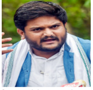
વિજય રૂપાણીની સરકાર આવી. રૂપાણી સરકારમાં પણ પાટીદારો પર થયેલા કેસને પરત ખેંચવાની માગ કરવામાં આવી.

અમદાવાદ, રાજ્યમાં પાટીદાર અનામત આંદોલન દરમિયાન પાટીદાર યુવાઓ પર થયેલા કેસ અંગે કોંગ્રેસના નેતા હાર્દિક પટેલે સરકારને આંદોલનની ચીમકી આપી. હાર્દિક પટેલે પ્રેસ કોન્ફરન્સ સંબોધતા જણાવ્યું કે, સરકાર ૨૩મી માર્ચ સુધીમાં પાટીદાર પર થયેલા કેસ પરત નહીં ખેંચે તો ઉગ્ર આંદોલન કરવામાં આવશે. રાજ્યમાં જ્યારે આંદોલન પટેલની સરકાર હતી ત્યારે પાટીદારો પર કેસ પરત ખેંચવાની વાત કરવામાં આવી હતી. જે બાદ રાજ્યમાં