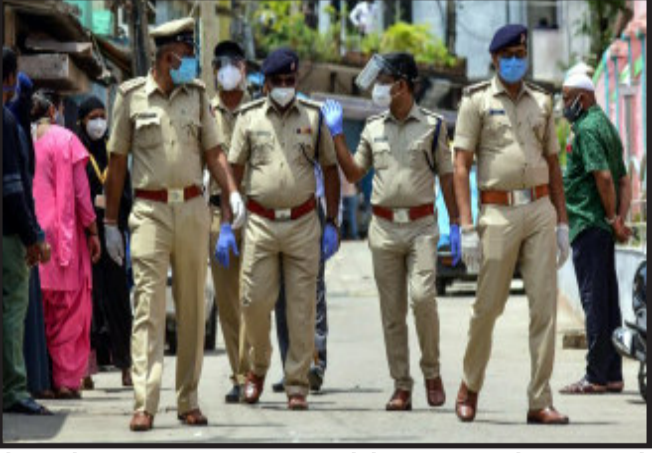
એક્ટિવ કેસની કુલ સંખ્યા ૧૮ લાખ ૭૩૪૩ અને ૨૦૭૧૮, ૧૬ જાન્યુઆરીએ ૧૮,૨૮૬ અને ૧૭ જાન્યુઆરીએ ૧૨,૫૨૭ કેસ નોંધાયા હતા. દિલ્હી સરકાર તેના સિનિયર નર્સિંગ અધિકારીઓને પાનગી હોસ્પિટલમાં નોડલ ઓફિસર તરીકે નિયુક્ત કરશે. આ કોવિડ-૧૯ દર્દીઓના મેનેજમેન્ટમાં મદદ કરશે અને વેક્સિનેશનનું મોનિટરિંગ પણ કરી શકશે. જમ્મુ-કાશ્મીરમાં છેલ્લા ૨૪ કલાકમાં ૪,૬૫૧ કોરોનાના નવા કેસ નોંધાયા છે. રાજ્યમાં એક જ દિવસમાં કોરોનાના નવા કેસની આ સૌથી વધુ સંખ્યા છે. જમ્મુ-કાશ્મીરમાં એક્ટિવ કેસ ૨૧,૬૭૭ છે. ૧૫-૧૮ વય જૂથના ૫૦%થી વધુ કિશોરોને ૨૨.૪૭% હતો. રાજધાનીમાં એક્ટિવ કેસ ૭૮,૧૨૨ છે. દિલ્હીમાં ૧૩ જાન્યુઆરીથી સતત કેસમાં ઘટાડો થઈ રહ્યો છે. દિલ્હીમાં ૧૩ જાન્યુઆરીએ ૨૮,૮૬૭ નવા કેસ અને ૧૪

મુંબઈ, છેલ્લા ૨૪ કલાકમાં મહારાષ્ટ્રમાં ટોચના ૯૫ પોલીસ અધિકારીઓ સહિત ૪૯૯ કર્મચારીના કોરોના રિપોર્ટ પોઝિટિવ આવ્યા છે. મહારાષ્ટ્રમાં અત્યાર સુધીમાં ૮૨૧ પોલીસ અધિકારીઓ અને ૩૨૬૯ કર્મચારીઓ મળીને કુલ ૪૦૯૦ લોકો પોઝિટિવ છે. જેમાં અમુક હોમઆઈસોલેશનમાં અને અમુક હોસ્પિટલમાં સારવાર લઈ રહ્યા છે. દેશમાં કોરોનાના વધી રહેલા કેસ વચ્ચે સુપ્રીમ કોર્ટના ૧૦ જજ અને ૪૦૦થી વધુ કર્મચારીઓને કોરોના થયો છે. ચીફ જસ્ટિસ સહિત સુપ્રીમ કોર્ટના ૩૨ જજોમાંથી અત્યાર સુધીમાં ૧૦ જજ કોરોનાથી પોઝિટિવ થયા છે. આ સાથે જ લગભગ ૩,૦૦૦ કર્મચારીઓમાંથી ૪૦૦થી વધુ લોકો કોરોનાથી સંક્રમિત થયા છે. સુપ્રીમ કોર્ટ ૨ જાન્યુઆરીએ કોરોનાના કેસોની વધતી સંખ્યાને ધ્યાનમાં રાખીને ૩ જાન્યુઆરીથી બે અઠવાડિયા સુધી