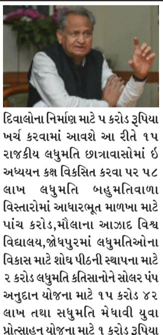
મુખ્યમંત્રી અશોક ગહલોતે લઘુમતિ સમુદાયના સમાવેશી વિકાસ માટે રચાયેલ ૧૦૦ કરોડ રૂપિયાના વિકાસ કોષથી વિવિધ યોજનાઓમાં ૯૮ કરોડ ૫૫ લાખ રૂપિયા ખર્ચ કરવાના સંશોધિત પ્રસ્તાવને મંજૂરી આપી છે. પ્રસ્તાવ અનુસાર લઘુમતિ સમુદાયના લોકોના પરંપરાગત હુનર વિકાસ માટે ૫૦ લાખ, લઘુમતિ શિલ્પકારોને પ્રોત્સાહન અને સહાયતા માટે ૧ કરોડ ૨૫ લાખ, જયપુરમાં અંગ્રેજી માધ્યમની આવાસીય વિદ્યાલયના નિર્માણ માટે ૨૧ કરોડ ૮૦ લાખ, લઘુમતિ સમુદાયના લોકોની રોજગારી માટે આંતરરાષ્ટ્રીય ભાષાઓની તાલીમ માટે ૨ કરોડ, વક્ર ભૂમિ કે જાહેર ભૂમિ પર બનેલ કબ્રસ્તાન મદરેસા અને વિદ્યાલયોમાં ચાર

ખર્ચ કરવાની મંજૂરી આપી છે. મુખ્યમંત્રી અશોક ગહલોતે જોધપુરમાં પાવટા કળ શાકભાજી મંડી વિસ્તારમાં આધુનિક બસ સ્ટેન્ડ નિર્માણ માટે ૧૦ કરોડ રૂપિયાની વધારાની રકમની મંજૂરી આપી છે. ગહલોતની આ મંજૂરીથી પગપાળા યાત્રીકો, બે પૈડા અને ચાર પૈડાના વાહનોના બસ સ્ટેન્ડ પરિસરમાં આવરજવર છોટો અને ટેક્સ્ટાઇલ બસોના માર્દનર મેટીનેસ માટે બિની વર્કશોપ સહિત અન્ય વિકાસ કાર્ય યોગ્ય રીતે થઈ શકે છે. એ યાદ રહે કે આ આધુનિક બસ સ્ટેન્ડના નિર્માણ માટે પૂર્વમાં ૩૮ કરોડ રૂપિયાની મંજૂરી આપી ચુક્યા છે. હવે મુખ્યમંત્રીએ વધારાના વિકાસ કાર્યો માટે ૧૦ કરોડ રૂપિયાની રકમ વધુ મંજૂર કરી છે. મુખ્યમંત્રી અશોક ગહલોતે ડો