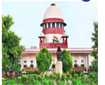
સુપ્રીમ કોર્ટ આ અરજીની સુનાવણી માટે તૈયાર થઈ ગઈ છે. બીજી તરફ ઉત્તર પ્રદેશમાં ભાજપ ઉમેદવારોની અત્યાર સુધીમાં જે યાદી જાહેર કરી છે તેમાં ૨૫ ઉમેદવારો એવા છે કે જેમની સામે કોઈને કોઈ કિમિનલ કેસ દાખલ છે. આવા ઉમેદવારોમાં ઉ. પ્રદેશના ઉપ મુખ્યપ્રધાન કેશવ પ્રસાદ મોર્યનો પણ સમાવેશ થાય છે. ભાજપે આવા કિમિનલ કેસો ધરાવતા ઉમેદવારોને કેમ ટિકિટ આપી તેનું કારણ પણ જણાવ્યું છે. ભાજપે કેશવ પ્રસાદ મોર્યને કેમ ટિકિટ આપી તેનું કારણ જણાવતા ઠાવો કર્યો છે કે

નવીદિલ્હી, હાલ ઉત્તર પ્રદેશ સહિત પાંચ રાજ્યોમાં ચૂંટણીઓ યોજાવા જઈ રહી છે. એવામાં રાજકીય પક્ષો કિમિનલ રેકોર્ડ ધરાવતા ઉમેદવારોની વિગતો જાહેર કરતા બંધી રહ્યા હોવાના આરોપો સાથે મામલો સુપ્રીમ કોર્ટ પહોંચ્યો છે. જાહેર હિતની અરજીમાં ઠાવો કરવામાં આવ્યો છે કે ૧૩ જાન્યુઆરી ૨૦૨૨ના રોજ સમાજવાદી પાર્ટીએ કુખ્યાત ગેંગસ્ટર નાહિદ હસનને કેરળા બેઠક પરથી ટિકિટ આપી છે. જોકે સુપ્રીમ કોર્ટના આદેશનું પાલન નથી થયું અને ૪૮ કલાકની અંદર આ ગેંગસ્ટરનો કિમિનલ રેકોર્ડ ઈલેક્ટ્રોનિક, પ્રિન્ટ અને સોશિયલ મીડિયામાં પ્રકાશિત નથી કરવામાં આવ્યું. સાથે એવી માગણી સુપ્રીમ કોર્ટમાં થઈ છે કે જેણે પક્ષો કિમિનલ રેકોર્ડની માહિતી જાહેર ન કરે તેવા પક્ષોની નોંધણી રદ કરવા ચૂંટણી પંચને સુપ્રીમ કોર્ટ આદેશ આપે.