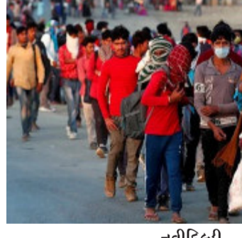
નવીદિલ્હી, કોવિડ સંક્રમણને કારણે વર્ષ ૨૦૨૨માં પણ બેરોજગારી ઉંચી રહેશે. ઈન્ટરનેશનલ લેબર ઓર્ગેનાઈઝેશન દ્વારા બહાર આંકડામાં આવેલા ૨૦૨૨માં બેરોજગારી લોકોની સંખ્યા ૨૦૭ મિલિયન સુધી પહોંચી શકે છે. જે વર્ષ ૨૦૧૯ કરતા ૨.૧ કરોડ વધુ છે. રિપોર્ટમાં કહેવામાં આવ્યું છે કે ૨૦૨૩ સુધીમાં વૈશ્વિક બેરોજગારીનો આંકડો મહામારી પહેલાંના સ્તર કરતા વધારે રહી શકે છે. આઈએલઓના ડાયરેક્ટર-જનરલ ગાય રાયડરનું કહેવું છે કે કોવિડ સંક્રમણને બે વર્ષ પછી પણ પરિસ્થિતિ હજુ પણ ગંભીર છે. તેમણે કહ્યું કે ફરી નોકરીઓનો માર્ગ ધીમો અને અનિશ્ચિતતાઓથી ભરેલો હતો. ઘણા કામદારોને નવા પ્રકારનાં કામ તરફ વળવું પડે છે. રિપોર્ટમાં ચેતવણી આપવામાં

આવી છે કે રોજગાર પરની કુલ અસર અંદાજિત આંકડા કરતા વધારે હોઈ શકે છે. આનું કારણ એ છે કે મોટી સંખ્યામાં લોકોએ શ્રમભળ છોડી દીધું છે. રિપોર્ટમાં કહેવામાં આવ્યું છે કે, ૨૦૨૨માં શ્રમ દળની ભાગીદારી ૨૦૧૯ની સરખામણીમાં ૧.૨ ટકા ઓછી હોઈ શકે છે. કોરોનાનાં ડેલ્ટા અને ઓમિક્રોન જેવા વેરિએન્ટનાં ઉદભવને આ કારણભૂત ગણવામાં આવે છે આઈએલઓ કામ કરેલા કલાકોની સંખ્યાનાં આધારે રોજગારમાં વધારો અથવા ઘટાડાની ગણતરી કરે છે. આ સંસ્થા અઠવાડિયામાં ૪૮ કલાક કામ કરવાના ધોરણનાં આધારે રોજગારની ગણતરી કરે છે. રિપોર્ટમાં કહેવામાં આવ્યું છે કે, કોરોના સંક્રમણને કારણે લગભગ દરેક દેશમાં આર્થિક, નાણાકીય અને સામાજિક માળખું નબળું પડી રહ્યું છે. આ નુકસાનને રીકવર કરવામાં ઘણા વર્ષો લાગી શકે છે. રિપોર્ટ અનુસાર, ઉચ્ચ આવક ધરાવતા દેશોમાં રીકવરી મજબૂત છે, જ્યારે નિમ્ન-મધ્યમ આવક ધરાવતા અર્થતંત્રો સૌથી ખરાબ સ્થિતિનો સામનો કરી રહ્યા છે.