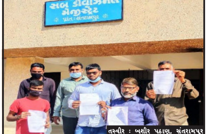
સંતરામપુર નગરમાં ઓટો રીક્ષા ચાલક એસોસિએશન દ્વારા કાયમી ધોરણે રીક્ષા સ્ટેન્ડના હોવાના કારણે ભારે મુશ્કેલી પડતી હોય છે. ઓટો રીક્ષા ચાલકો આના કારણે કોઈ જગ્યાએ કાયમી

સંતરામપુર, સંતરામપુર નગરમાં ઓટો રીક્ષાનું સ્ટેન્ડ ન હોવાના અભાવે તમામ ઓટો રીક્ષા ચાલકોની ભારે હાલાકી ભોગવવી પડતી હોય છે, આના કારણે રીક્ષા ચાલકો પોતાની રોજગારી માટે ઓટો રીક્ષા સમયસર ફરતી શકતા નથી. સંતરામપુર નગરમાં વર્ષોથી ઓટોરીક્ષા માટેનું કાયમી ધોરણે રીક્ષા સ્ટેન્ડના હોવાના કારણે ભારે મુશ્કેલી પડતી હોય છે. ઓટો રીક્ષા ચાલકો આના કારણે કોઈ જગ્યાએ કાયમી