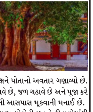
પીપળાના વૃક્ષનું હિન્દુ ધર્મમાં આદરણીય સ્થાન છે. એવું કહેવાય છે કે તેની નિયમિત પૂજા અને જળ યદાવવાથી વ્યક્તિ મોક્ષની પ્રાપ્તિ કરે છે. ગીતામાં ભગવાન શ્રી કૃષ્ણએ આ વૃક્ષને પોતાનો અવતાર ગણાવ્યો છે. લોકો પીપળાના ઝાડ નીચે દીવો પ્રગટાવે છે, જળ યદાવે છે અને પૂજા કરે છે. પરંતુ તેને ઘરમાં મૂકવાની કે ઘરની આસપાસ મૂકવાની મનાઈ છે. ઘણીવાર તમે જોવું હશે કે પીપળા લોકોની છત કે દીવાલોમાંથી જાતે જ બહાર આવવા લાગે છે. તેને જડવું અથવા કાપવું પ્રતિબંધિત છે. પરંતુ તેને ઘરમાં રહેવા દેવાથી તે દિવાલોને પણ નુકસાન પહોંચાડી શકે છે. કહેવાય છે કે ઘરમાં પીપળાને ઉપાડવાથી ઘરમાં પિતૃદોષનો અનુભવ થાય છે. આવી સ્થિતિમાં જો તમે પીપળાને જડવુંથી ઉપાડી નાખો તો તેને કોઈ બીજી જગ્યાએ લગાવો અને તેની નિયમિત પૂજા કરો. આનાથી તમને કોઈ પ્રકારનો દોષ નથી લાગતો. શાસ્ત્રોમાં કહેવામાં આવ્યું છે કે પીપળા ઝાડના મૂળમાં બ્રહ્મા, મધ્યમાં વિષ્ણુ અને અગ્રભાગમાં શિવનો વાસ છે. અથર્વવેદમાં લખ્યું છે કે 'અથથ દેવો સદન, અથથ્ય પૂજિતે યાત્રા પૂજિતો સર્વ દેવતાક્ષ એટલે કે પીપળાની પૂજા કરવાથી તમામ દેવતાઓની પૂજા થાય છે. ધાર્મિક માન્યતા છે કે પીપળાના ઝાડ નીચે જપ, તપ, યજ્ઞ, અનુષ્ઠાન અને સાધના કરવાથી અપૂર્વ ફળ મળે છે. આટલું જ નહીં નિયમિત રીતે પીપળાને જળ યદાવવાથી પિતૃઓની કૃપા પણ પ્રાપ્ત થાય છે. શાસ્ત્રો અનુસાર જે ઘરના સભ્યોમાં પીપળાનું ઝાડ હોય કે આ ઝાડનો પડછાંયો આવે છે, ત્યાંના સભ્યોની પ્રગતિ અટકી જાય છે. આવા ઘરમાં અનેક પ્રકારની સમસ્યાઓ મૂળ બની જાય છે. તેથી પીપળાનું વૃક્ષ ક્યારેય પણ ઘરમાં કે ઘરની આસપાસ ન લગાવવું જોઈએ. તેનાથી ઘરમાં ગરીબી આવે છે. નકારાત્મકતા પ્રવર્તે છે.

સહિત તમામ પદાધિકારીઓનો આભાર માનું છું. હું મારી ભક્ત મુજબ જેટલું થઈ શકશે તે તમામ કામ કરીશ. અપર્ણાએ કહ્યું કે મારા માટે રાષ્ટ્ર ધર્મ સૌથી ઉપર છે અને હવે હું રાષ્ટ્ર માટે કામ કરવા જઈ રહી છું. બીજી તરફ કેશવ પ્રસાદ મૌર્યએ આ પ્રસંગે કહ્યું કે અભિલેશ યાદવ પોતાનું જ ઘરમાં સંભાળવામાં નિષ્ફળ છે. હું આ પ્રસંગે વધુ કંઈ કહેવા માંગતો નથી. તેમણે કહ્યું કે સમાજવાદી પાર્ટીએ અમારી તમામ યોજનાઓનો શ્રેય લેવાનો પ્રયાસ કર્યો. પરંતુ તેણે હજુ સુધી પોતાની સીટ જાહેર નથી કરી. મૌર્યએ કહ્યું કે ભાજપે પહેલી જ યાદવની મારી અને સીએમ યોગી આદિત્યનાથની સીટની જાહેરાત કરી છે. અભિલેશ યાદવે કહ્યું હતું કે તેમણે વિકાસ કર્યો છે. જો તેમનો આટલો