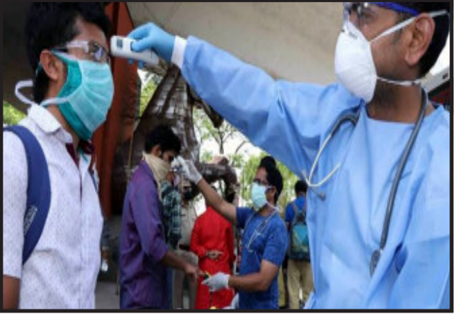
આર.ટી.પી.સી.આર. અર્બન વિસ્તાર રહ્યો છે. દાહોદ ના ૧૫૫૬ પૈકી ૩૪ અને રેવીડ ટેસ્ટના ૮૩૭ પૈકી ૪૧ મળી આજે કુલ ૭૫ કોરોના પોઝીટીવ કેસો

દાહોદ, દાહોદમાં કોરોના નો કાળો કેર વર્ત્યો છે આજે કોરોના સેન્યુરીને પાર કરવા જઈ રહ્યું છે. ત્યારે આજે એકજ દિવસમાં ૭૫ કોરોના કેસો નોંધાતાં દાહોદ જિલ્લાવાસીઓમાં ચિંતાનું મોજુ ફરી વળ્યું છે. દાહોદની સરકારી હોસ્પિટલો હવે ધીમે ધીમે હાઉસફૂલ થવા માંડી છે અને તેમાં જ ખાસ કરીને કોરોના વોર્ડોમાં દર્દીઓની સંખ્યામાં પણ વધારો જોવા મળી રહ્યો છે. દાહોદમાં આવનાર દિવસો પડકારરૂપ હશે તેમ કહી શકાય કારણકે, હવે છેલ્લા બે દિવસથી ૫૦ ઉપરાંત કોરોના