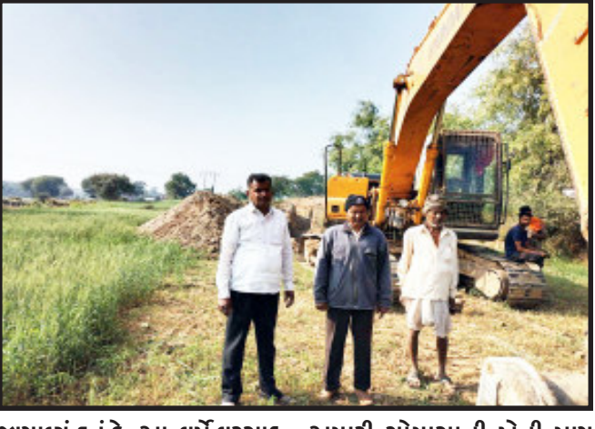
જણાવ્યું હતું કે, આ વર્ષે વરસાદ અમારી ચોમાસાની ખેતી પણ પછા સારો નથી પડ્યો જેથી નિષ્ફળ ગઈ હતી અને હાલ રવિ