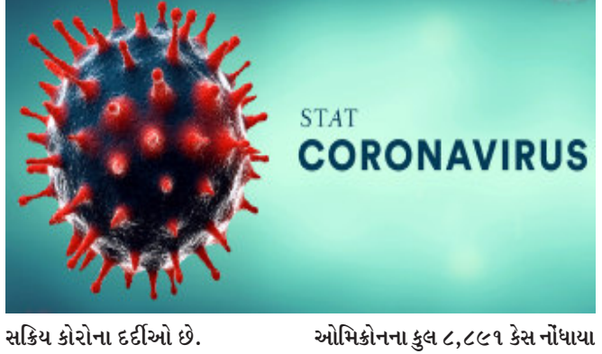
સક્રિય કોરોના દર્દીઓ છે. ભારતીય આરોગ્ય મંત્રાલયે સ્વીકાર્યું છે કે, હાલમાં ૧૭,૩૬,૬૨૨ સક્રિય દર્દીઓ છે. આ સિવાય કોરોના વાયરસના નવા પ્રકાર

નવીદિલ્હી, ભારતમાં કોરોના વાયરસથી સંક્રમિતોની સંખ્યા દિવસેને દિવસે વધી રહી છે. જો કે, છેલ્લા ૨૪ કલાકમાં નવા કોરોના દર્દીઓ મળવાની ગતિ થોડી ધીમી પડી છે. આરોગ્ય મંત્રાલયે મંગળવારના રોજ જણાવ્યું હતું કે, છેલ્લા ૨૪ કલાકમાં ભારતમાં ૨,૩૮,૦૧૮ કેસ નોંધાયા છે, જે એક દિવસ પહેલા કરતાં ૨૦,૦૭૧ ઓછા છે. તેમજ રવિવારના રોજ ૧,૫૭,૪૨૧ લોકો સાજા થયા હતા અને ૩૧૦ લોકોના મોત થયા હતા. ૧૭ લાખથી વધુ એક્ટિવ કેસ ચિનાની વાત એ છે કે, ભારત હવે એવા ૧૦ દેશોમાં શામેલ છે, જ્યાં સૌથી વધુ