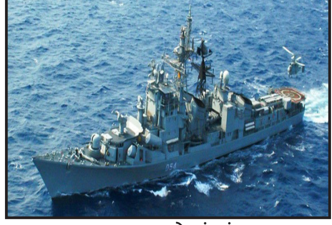
ઘટના બાદ દેવાયું હતું. જહાજના ચાલક તાકીદના ઘોરણે રાહત દળના સભ્યોએ તરત અચાપ અભિયાન શરુ કરી સ્થિતિને નિયંત્રણમાં

મુંબઈ, મુંબઈમાં ઈન્ડિયન નેવીના જહાજ INS રણવીરમાં એક કચ્છા ઘટના બની છે. INS રણવીરના અંદરના ભાગમાં અચાનક કોઈ કારણોસર બ્લાસ્ટ થયો હતો જેમાં નેવીના ૩ જવાનો શહીદ થયા હતા તથા બીજા કેટલાક જવાનો ઘાયલ થયા હતા. આ ઘટનામાં ૧૧ જવાન ઘાયલ થયાની પણ ખબર છે. INS રણવીર જ્યારે એક