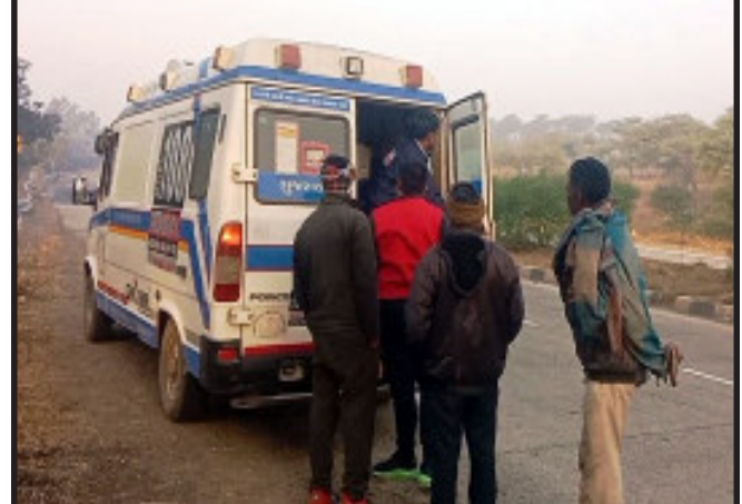
દાહોદ જેકોટ ગામે એક ખાનગી એમ્બ્યુલન્સ અમદાવાદથી દર્દીને મૂકી પરત દાહોદ તરફ ફરતી હતી. તે દરમિયાન રાત્રિના સમયે એક અજાણી ગાડીએ તેને પાછળથી ટક્કર મારતા એમ્બ્યુલન્સનો સ્ટેરિંગ પર થી કાબુ બગાડતાન એમ્બ્યુલન્સ રસ્તા વચ્ચે ફિવાઈડરમાં નીચે ગરનાળા માં પડી હતી. ઘટનામાં ચાલકને ઈજાઓ આવતા આસપાસના લોકોએ તેને સારવાર માટે ૧૦૮ બોલાવી તાત્કાલિક દાહોદ સિવિલ હોસ્પિટલમાં ખસેડાઈ હતી. ઘટનામાં કોઈ જાનહાનિ ના થતા રાહત ખોવા મળી હતી. જોકે, એમ્બ્યુલન્સનો અકસ્માત થતા વિસ્તારમાં ધિંતા સેવાઈ.