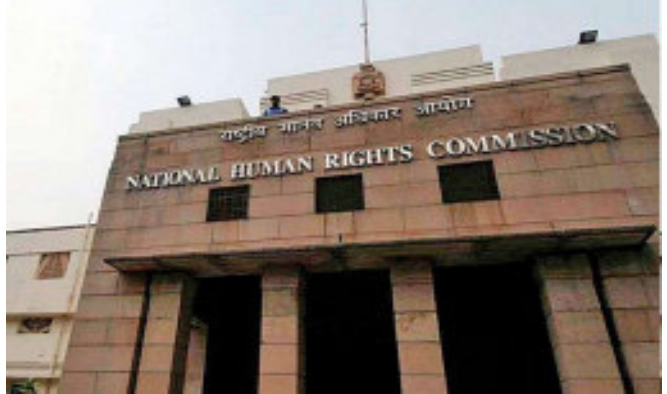
કમિશને કહ્યું કે રક્તપિત્ત સંપૂર્ણપણે સાધ્ય છે તે અંગે જાગૃતિ કેળવવી જોઈએ. રક્તપિત્ત પીડિત વ્યક્તિ MDT નો પ્રથમ ડોઝ મેળવ્યા પછી હવે ચેપી નથી. આવી વ્યક્તિ સામાન્ય પરિણીત જીવન જીવી શકે છે, બાળકો પેદા કરી શકે છે, સામાજિક કાર્યક્રમોમાં ભાગ લઈ શકે છે અને શાળા-કોલેજમાં સામાન્ય રીતે જઈ શકે છે. કમિશને કહ્યું કે તે પ્રિન્ટ અને ઈલેક્ટ્રોનિક

નવીદિલ્હી, રાષ્ટ્રીય માનવ અધિકાર આયોગે કુદરતી રોગીઓના મામલે કેન્દ્ર અને રાજ્ય સરકાર માટે ગાઈડલાઈન જારી કરી છે. એનએચઆરસીએ નોટિસમાં આવા ૯૭ કાયદાનો બ્યોરા આપ્યો છે, જેના પ્રાવધાનોને રક્તપિત્ત પીડિત સાથે ભેદભાવ કરવા વાળા જણાવ્યા છે. આયોગે આ પ્રાવધાનોને હટાવવાની માંગ કરી છે.