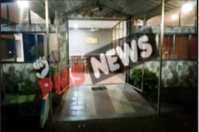
શિવરાજપુરના રિસોર્ટમાં પડી રેડ હતી જેમાં ભાજપના MLA સાથે ૧૫ લોકોની જુગાર રમતા ધરપકડ કરાઈ હતી.