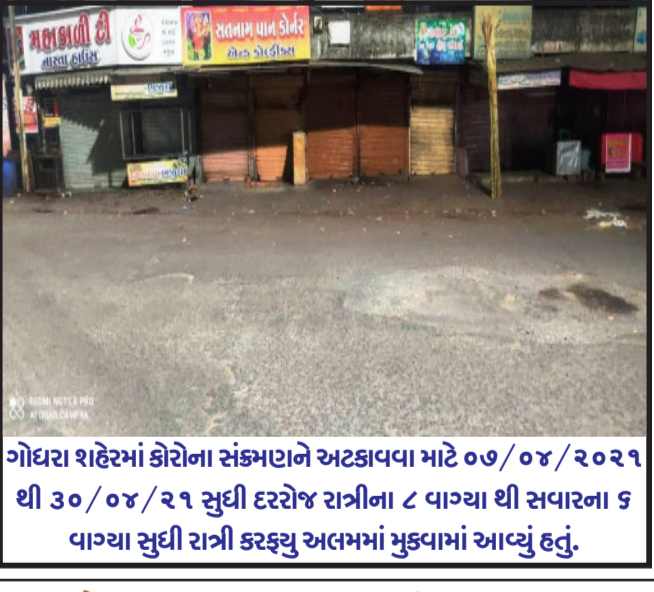
ગોધરા શહેરમાં કોરોના સંક્રમણને અટકાવવા માટે ૦૭/૦૪/૨૦૨૧ થી ૩૦/૦૪/૨૧ સુધી દરરોજ રાત્રીના ૮ વાગ્યા થી સવારના ૬ વાગ્યા સુધી રાત્રી કરક્યુ અલમમાં મુકવામાં આવ્યું હતું.