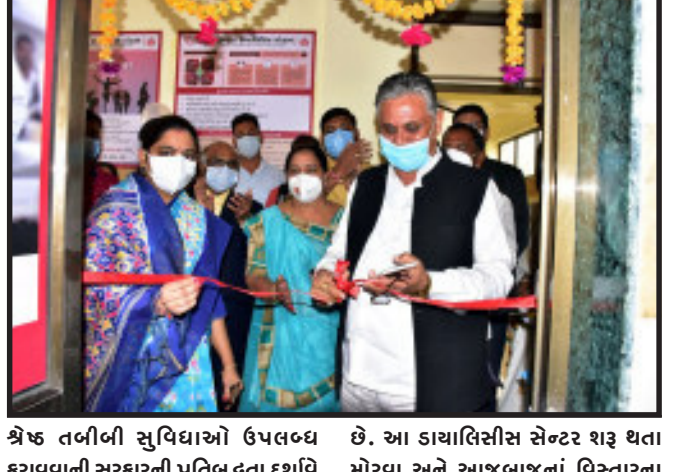
શ્રેષ્ઠ તબીબી સુવિધાઓ ઉપલબ્ધ કરાવવાની સરકારની પ્રતિબદ્ધતા દર્શાવે છે. આ ડાયાલીસીસ સેન્ટર શરૂ થતા મોરવા અને આજુબાજુનાં વિસ્તારના

ગોધરા, આદિ જાતિ વિકાસ, આરોગ્ય અને પરિવાર કલ્યાણ તેમજ તબીબી શિક્ષણ રાજ્યમંત્રી નિમિષાબેન સુથારનાં વરદ હસ્તે આજે સામુહિક આરોગ્ય કેન્દ્ર, મોરવા હડફ ખાતે ડાયાલીસીસ સેન્ટરનું લોકાર્પણ કરવામાં આવ્યું હતું. આ પ્રસંગે સામુહિક આરોગ્ય કેન્દ્ર ખાતે પીએમજેએવાય-મા કાર્ડ, મેગા હેલ્થ કેમ્પ અને બ્લડ ડોનેશન કેમ્પનું પણ આયોજન કરવામાં આવ્યું હતું. કાર્યક્રમના અધ્યક્ષ પદેથી સંબોધન કરતા આરોગ્ય રાજ્યમંત્રી નિમિષાબેન સુથારે જણાવ્યું હતું કે, મોરવા હડફ ખાતે નવીન ડાયાલીસીસ સેન્ટરનું ઉદ્ઘાટન રાજ્યના અંતરિયાળ વિસ્તારોમાં પણ