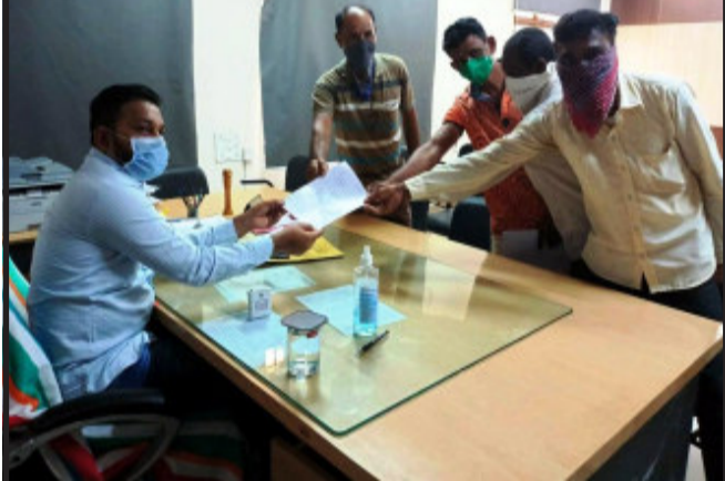
શહેરા નગરપાલિકાના ૧૪ જેટલા રોજમદારોને ફરજ પરથી મુક્ત કરાયા હતાં.