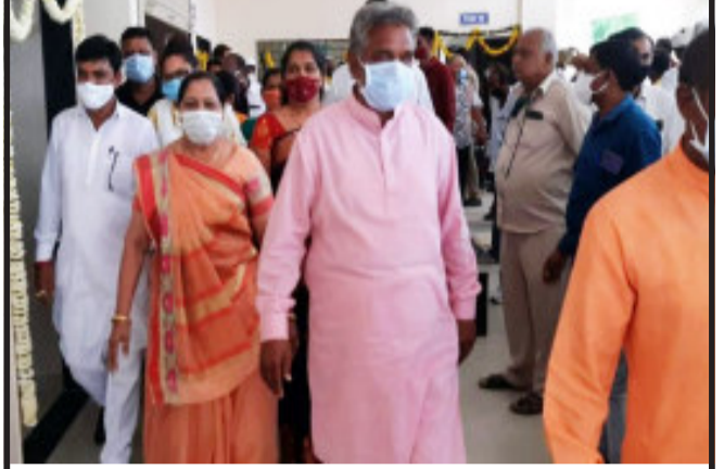
ઘોઘંબા ખાતે બે કરોડના ખર્ચે બનાવાયેલ નવીન એસ.ટી. ડેપોનું ઉદ્ઘાટન કાલોલના MLA હાથે કરવામાં આવ્યું હતું.