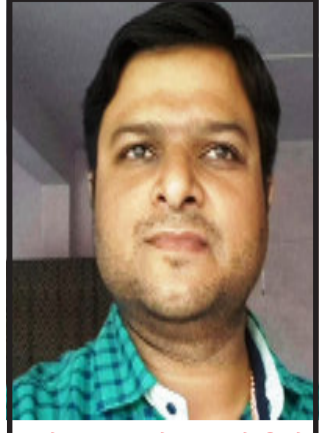
હાલોલમાં મ્યુકોરમાઈકોસિસે એક ડોક્ટરનો લીધો ભોગ, શ્રીજી કિલનિકના ડોક્ટરનું મોત થયું હતું.