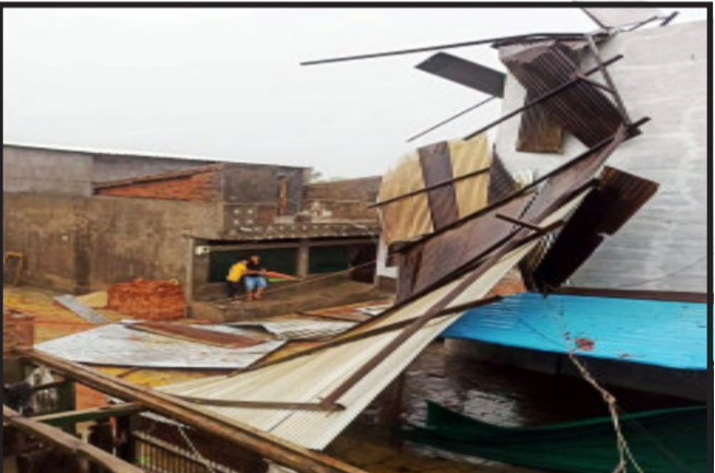
કાલોલમાં તાઉ-તે ચકવાતના પગલે ઘરના પતરા, વૃક્ષો અને વીજ થાંભલા જમીન સ્તર થયા હતા.