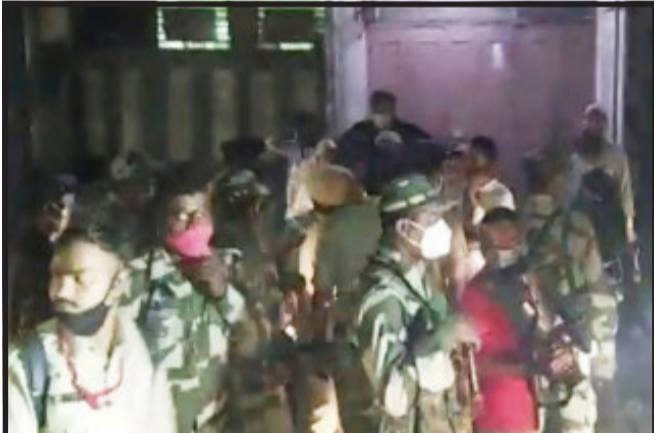
ગોધરા નગર પાલિકાની ચુંટણીમાં મારામારીના હિંસક બનાવ વચ્ચે ૬૨.૯૮ ટકા મતદાન નોંધાયું હતું.