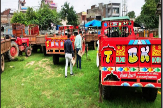
કાલોલના ઘુસર ગામે ગોમા નદીમાં રેતી ખનન કરતાં ભુમાકિયાઓને ખાણ-ખનિજ વિભાગ અને પોલીસે રેઈફ કરી ૧૭ ટ્રેક્ટર સહિત ૮૦ લાખનો મુદ્દામાલ ઝડપ્યો હતો.