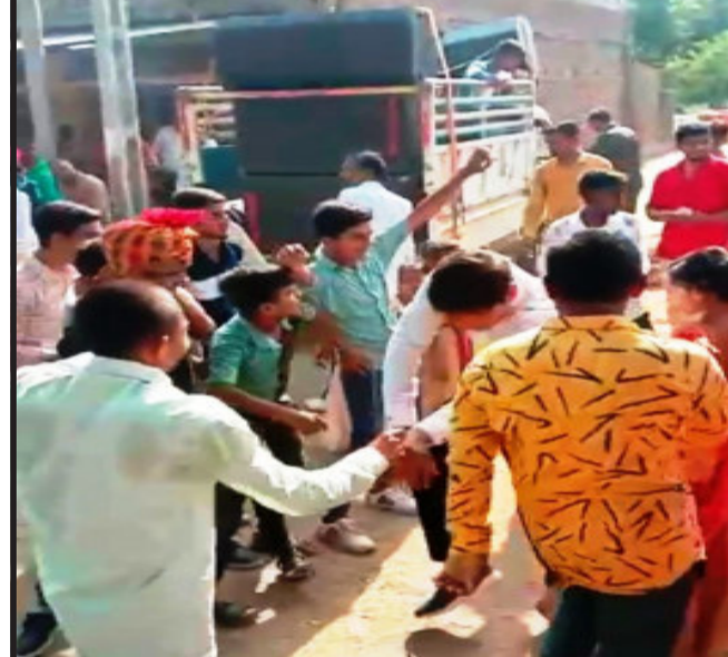
કારોનાની મહામારી માં ગોધરા તાલુકાના નદીસર અને જુનીઘરી ગામે લગ્ન પ્રસંગના વરઘોડામાં કોરોના ગાઈડ લાઈનના ધજાગરા.