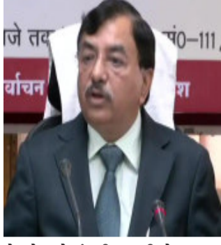
બેઠકો માટે ચૂંટણી થવાની છે. ભારત ચૂંટણી પંચ નિષ્પક્ષ ચૂંટણી કરાવવા માટે પ્રતિબદ્ધ છે.

સાથે પણ વાત કરી. રાજકીય પક્ષો સાથે બેઠક બાદ મુખ્ય ચૂંટણી કમિશ્નર સુશીલ ચંદ્રાએ લખનૌમાં પ્રેસ કોન્ફરન્સ કરી જેમાં જણાવ્યું કે અમે રાજકીય પક્ષો સાથે બેઠક કરી. આ બેઠક દરમિયાન ડીએમસી, બીએસપી, કોંગ્રેસ, ભાજપ, સમાજવાદી પાર્ટી અને આરએલડીએ ચૂંટણી પંચ સાથે મુલાકાત કરી. મુખ્ય ચૂંટણી કમિશ્નરે કહ્યું કે ઉત્તર પ્રદેશમાં વિધાનસભાનો કાર્યકાળ ૧૪મી મે ૨૦૨૨ ના રોજ ખતમ થઈ રહ્યો છે અને કુલ ૪૦૩