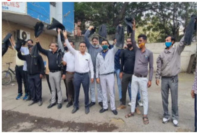
કરવા સામે વેપારીઓએ એકજૂથ થઈને વિરોધ કરવા રણનીતિ બનાવી આજે વેપારીઓ સંક્રાંત બંધ રાખીને વિરોધ પણ વ્યક્ત કર્યો હતો. આ પહેલા સુરતમાં વેપારીઓ કાળી પટ્ટી બાંધીને થાળીઓ

અમદાવાદ, રાજ્યભરમાં આજે કાપડના વેપારીઓ બંધ પાળ્યો હતો. જીએસટી દરમાં વધારો કરવાના નિર્ણય મુદ્દે રાજ્યભરના કાપડના વેપારીઓ સંપૂર્ણ બંધ રાખી વિરોધ પ્રદર્શિત કર્યા હતાં. સુરતની સૌથી મોટે ટેક્સટાઈલ માર્કેટના તમામ વેપારીઓ બંધમાં જોડાયા હતાં આ તરફ અમદાવાદમાં પણ કાપડ બજાર બંધ રહ્યાં હતાં વિવિધ વેપારી એસોસિએશને પણ બંધનું એલાન આપ્યું હતું અને પોતાની દુકાનો અને બંધા બંધ રાખ્યા હતાં. રાજ્યના અન્ય જિલ્લાના કાપડના વેપારીઓએ પણ બંધને સમર્થન આપ્યું હતું અને દુકાનો બંધ કરી ધરણા સુત્રોચ્ચાર કરી વિરોધ વ્યક્ત કર્યો હતો એ યાદ રહે કે હવે કાપડ પર જીએસટી પાંચ ટકાથી વધારી ૧૨ ટકા