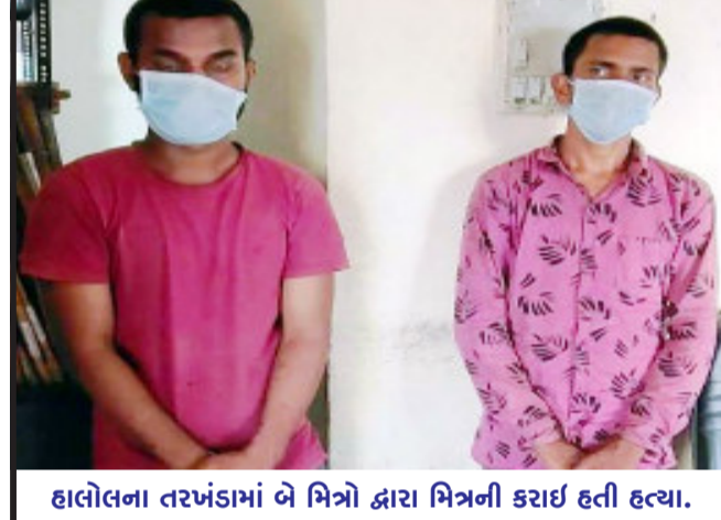
હાલોલના તરખંડામાં બે મિત્રો દ્વારા મિત્રની કરાઈ હતી હત્યા.