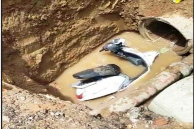
કાલોલમાં ગટર માટે ખોદેલા ખાડામાં એક્ટિવા ચાલક ખાબક્યો હતો.