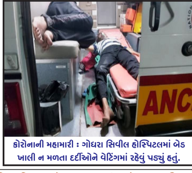
કોરોનાની મહામારી : ગોધરા સિવિલ હોસ્પિટલમાં બેડ ખાલી ન મળતા દર્દીઓને વેઈંગમાં રહેવું પડ્યું હતું.