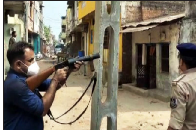
પંચમહાલના કાલોલમાં ભારેલા અગ્નિ જેવી સ્થિતિ: ૨ જૂથ વચ્ચે અથડામણમાં PI-PSI થયા હતા ઘાયલ : પંચમહાલના કાલોલમાં બે જૂથો વચ્ચે અથડામણ અસામાજિક તત્વો દ્વારા કરવામાં આવી હતી તોડફોડ.