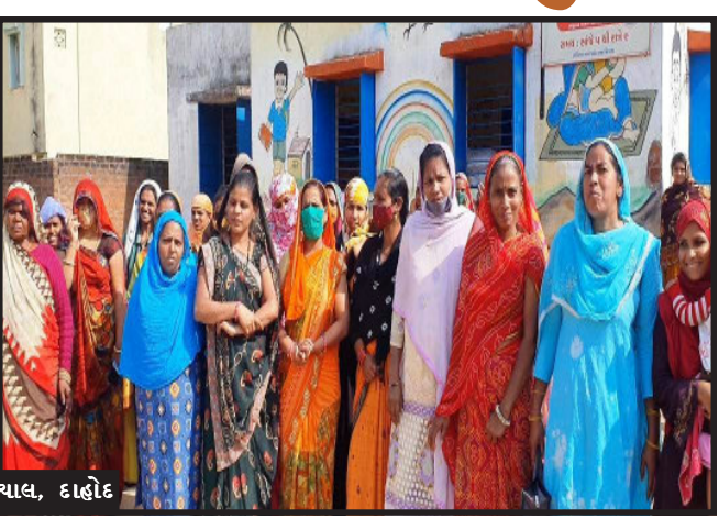
ઝાલોદ રોડ પ્રાથમિક શાળાની શરૂઆત ૨૧/૧૧/૧૯૩૭ માં થઈ હતી. આ શાળામાં ગુજરાતી માધ્યમ હોવાથી દાહોદ શહેરના ગરીબ મજુર વાલ્મિકી સમાજ સહિતના

દાહોદ, દાહોદ તાલુકામાં ઝાલોદ રોડ ખાતે આવેલ એક પ્રાથમિક શાળા છેલ્લા ૮૫ વર્ષથી ચાલતી શાળાની બિલ્ડિંગ હાલ જર્જરિત હાલતમાં દ્રશ્યમાં થાય છે. આ મામલે સંલગ્ન તંત્રને અનેકવાર રજુઆત કરવા છતાંયે તંત્રના પેટનું પાણી હાલ્યું નથી. છેલ્લા બે વર્ષથી શિક્ષકો શાળાનું ભાડુ ચૂકવી રહ્યાં હોવાનું પણ જાણવા મળી રહ્યું છે. ત્યારે બીજી તરફ સરકારની ઢીલી નીતી કહો કે, અધિકારીઓની પરંતુ જર્જરિત