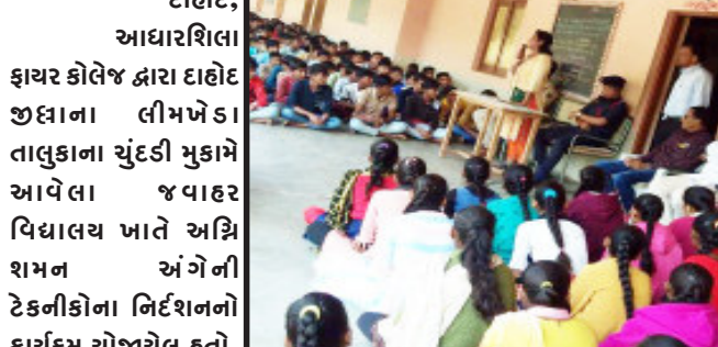
દાહોદ, આધારશિલા ફાયર કોલેજ દ્વારા દાહોદ જિલ્લાના લીમખેડા તાલુકાના ચુંદડી મુકામે આવેલા જવાહર વિદ્યાલય ખાતે અગ્નિશમન અંગેની ટેકનીકોના નિર્દેશનનો કાર્યક્રમ યોજાયેલ હતો. જેમાં ફાયર એકસ ટર્ગીવિશરનો ઉપયોગ કરી રીતે કરવો, આગ લાગે ત્યારે તેમાં