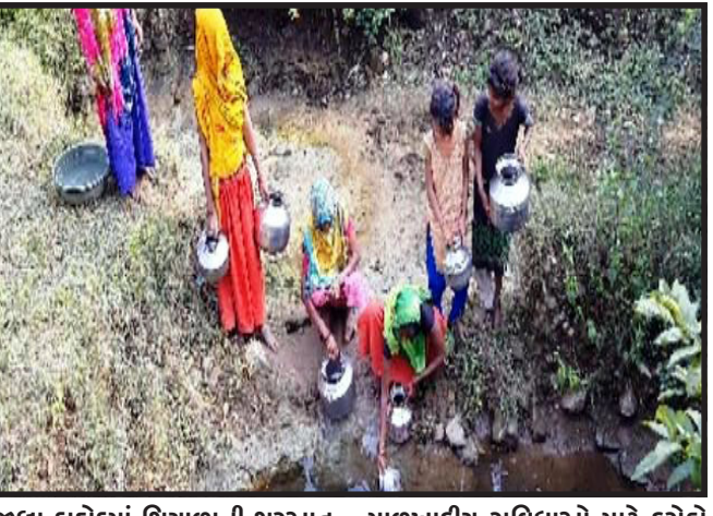
જીલ્લા દાહોદમાં શિયાળાની શરૂઆત મા જ પીવાના પાણી સમસ્યા પડી રહી છે. દાહોદ જિલ્લા ના ધાનપુર તાલુકા ના સજોઈ ગામે આ ગામ અંતરિયાળ વિસ્તાર મા આવેલુ ગામ રાજ્ય અને કેન્દ્ર સરકાર દ્વારા ગ્રામ્ય વિસ્તારોમાં લોકોને પાયાની

દાહોદ, દાહોદ જિલ્લાના ધાનપુર તાલુકાના અંતરિયાળ વિસ્તારમાં આવેલા સજોઈ ગામના રહીશોને આઝાદીના સાત સાત દાયકાઓ વેતવા છતાં પણ પીવાના પાણી જેવી પ્રાથમિક પ્રાથમિક સુવિધાઓનો માટે પણ વલખા મારી રહ્યા છે, સજોઈ ગામના પટેલ ફળીયાના રહીશોએ જાતે કોતર મા ખાડો ખોદી બિન આરોગ્યપદ દુષિત પાણી પીવા મજબુર બન્યા છે.