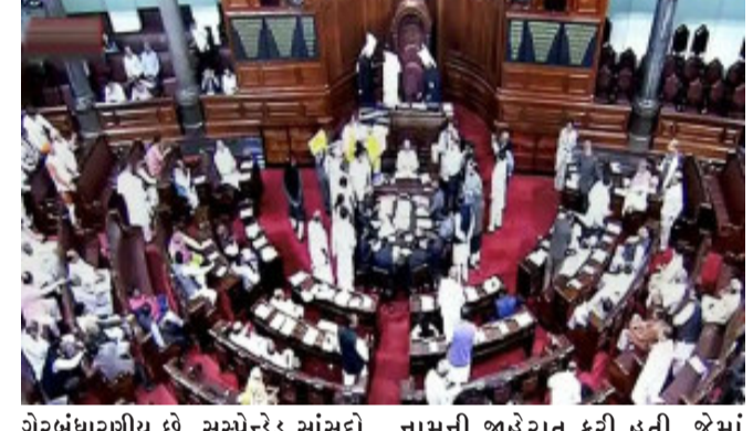
ગેરબંધારણીય છે. સસ્પેન્ડેડ સાંસદો પણ દરરોજ સંસદ પરિસરમાં ગાંધી પ્રતિમા પાસે ધરણા કરી રહ્યા હતા. નોંધનીય છે કે રાજ્યસભાના અધ્યક્ષ વેંકેયા નાયડુએ આ સાંસદોને ચોમાસુ સત્ર દરમિયાન બેંકામ વર્તન બદલ સસ્પેન્ડ કરી દીધા હતા. રાજ્યસભાના ઉપસભાપતિ હરિવંશ સસ્પેન્ડ કરાયેલા સાંસદોના

નવીદિલ્હી, સંસદનું શિયાળુ સત્ર આજે સમાપ્ત થઈ ગયું છે. લોકસભા અને રાજ્યસભાની કાર્યવાહી નિર્ધારિત સમય કરતાં એક દિવસ પહેલાં જ સ્થગિત કરી દેવાઈ છે. શિયાળુ સત્ર ૨૮ નવેમ્બરે શરૂ થયું હતું. જે ૨ ડિસેમ્બર સુધી ચાલવાનું હતું. કહેવામાં આવી રહ્યું છે કે બંને ગૃહોમાં સતત હોબાળાને કારણે સત્ર વહેલું સમાપ્ત કરવાનો નિર્ણય લેવામાં આવ્યો છે. વિપક્ષના હોબાળા છતાં કેટલાક મહત્વના બિલ ગૃહમાં પાસ કરવામાં આવ્યા હતા. વોટર આઈડીને આધાર કાર્ડ સાથે લિંક કરવા માટેનું બિલ મંગળવારે રાજ્યસભામાં પસાર કરવામાં આવ્યું હતું. વિપક્ષે બિલના વિરોધમાં વોક્સાઉટ કર્યું હતું, જ્યારે તુષ્ટમૂલ કોંગ્રેસના સાંસદ ડેરેક ઓ'બ્રાયને પત્રકારોના ટેબલ પર રૂલબુક ફેંકી, જેના પગલે તેમને ગૃહમાંથી સસ્પેન્ડ કરવામાં આવ્યા હતા.