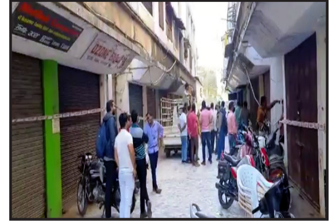
હતી. તેમ છતાં માનસરોવર કોમ્પ્લેક્સમાં ફાયર એન.ઓ.સી.લેવામાં આવી ન હોય જેને લઈ હાલોલ પાલિકા ચીફ ઓફિસર અને સ્ટાફ દ્વારા કોમ્પ્લેક્સના ગ્રાઉન્ડ ફ્લોર ઉપર આવેલ ૬૦ જેટલી કોમર્શિયલ દુકાનોને સીલ કર્યા છે. માનસરોવર કોમ્પ્લેક્સના પ્રથમ અને બીજા માળે ૬૦ જેટલા રહેણાંક મકાન આવેલ છે. તેવા રહીશોના કહેવા પ્રમાણે હાલો

હાલોલ, હાલોલ બગીચા સામે આવેલ માન સરોવર કોમ્પ્લેક્સમાં ફાયર એન.ઓ.સી. માટે પાલિકા દ્વારા ૯ મહિના અગાઉ નોટીસ આપવામાં આવી હતી. તેમ છતાં ફાયર એન.ઓ.સી. નહિ મેળવતાં કોમ્પ્લેક્સના ગ્રાઉન્ડ ફ્લોરની કોમર્શિયલ દુકાનોને સીલ કરવામાં આવ્યા. હાલોલ બગીચા સામે અને નગર પાલિકા કચેરીની નજીક માનસરોવર કોમ્પ્લેક્સ જે ૧૯૯૧માં તૈયાર થયેલ છે. નગર પાલિકા દ્વારા માનસરોવર કોમ્પ્લેક્સને ફાયર એન.ઓ.સી. માટે નોટીસ આપવામાં આવી