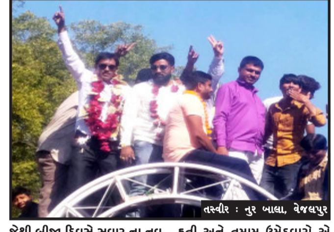
જેથી બીજા દિવસે સવાર ના નવ વાગી ગયા હતા જેમાં વેજલપુર ગામ વિસ્તાર ના ૧૪ વોર્ડ આવેલા છે જેમાં બનને પેનલ ના ઉમેદવારો એ ઉમેદવારી નોંધાવી હતી અને તમામ ઉમેદવારો એ એડી ચોટી નુ જોર લગાવી દીધુ હતું જેથી બનને પેનલ ની કટો કટી ની લીડ મા બનને પેનલ ના સાત સાત સભ્યો ખરા ખરી ની

વેજલપુર, કાલોલ તાલુકાની ૪૪ ગ્રામ પંચાયત ની ચૂંટણીનું મત ગણતરી કાલોલ ખાતે આવેલ એમ. એમ. ગાંધી આર્ટ્સ એન્ડ કોમર્સ કોલેજ ખાતે ચોજવામાં આવ્યું હતું જેથી કાલોલ તાલુકા ની ૪૪ ગ્રામ પંચાયત ની મત ગણતરી ચોજાય હતી જેમાં તમામ લોકોની બાજ નજર વેજલપુર ગ્રામ પંચાયત ઉપર હતી અને કાલોલ ખાતે ૪૪ ગ્રામ પંચાયતનું મતો ની મત ગણતરી કરવામાં આવી હતી જેમાં સ્વથી છેલ્લા નંબર ઉપર વેજલપુર ગ્રામ પંચાયત ની મતો ની મત ગણતરી કરવામાં આવી હતી