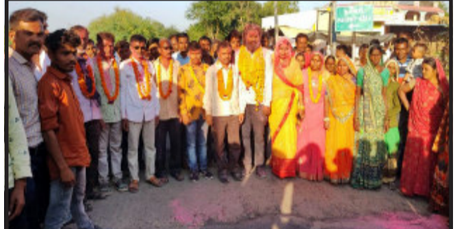
વિજેતા ઉમેદવારો દ્વારા પોતાના મતવિસ્તારમાં વિજય સરઘસ કાઢ્યું હતું. વિજેતા થયેલા ઉમેદવારોને તેમના સમર્થકો દ્વારા ફૂલ હાર પહેરાવીને અભિનંદન પાઠવાયા નજરે પડ્યા હતા સાથે નવીન બનેલા સરપંચનું ગામના વિવિધ વિસ્તારમાં ગ્રામજનો દ્વારા આવકાર આપવામાં આવ્યો હતો.

શહેરા, શહેરા ગ્રામ પંચાયતની ચૂંટણીનું પરિણામ જાહેર થયા બાદ તાલુકાના વાડી, તરસંગ તેમજ નરસાણા ગામ ના વિજેતા ઉમેદવાર દ્વારા તેમના મત વિસ્તારમાં વિજય સરઘસ કાઢવામાં આવ્યો હતો. શહેરા તાલુકામાં ૫૬ ગ્રામ પંચાયતની ચૂંટણીની મતગણતરી પૂર્ણ થયા બાદ વિજેતા થયેલા સરપંચના અને વોર્ડ સભ્યોના ઉમેદવારો માં ભારે ખુશીની લહેર ઘવાઈ હતી જ્યારે તાલુકાના વાડી તરસંગ તેમજ નરસાણા ગામના