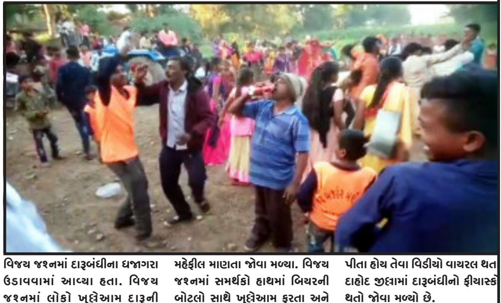
વિજય જશનમાં દારૂબંધીના ધજાગરા ઉડાવવામાં આવ્યા હતા. વિજય જશનમાં લોકો ખુલ્લેઆમ દારૂની પીતા હોય તેવા વિડીયો વાયરલ થત દાહોદ જીલ્લામાં દારૂબંધીનો ફીચાર્ક થતો જોવા મળ્યો છે.

દાહોદ, દાહોદ જીલ્લામાં ગ્રામ પંચાયતોની ચૂંટણીમાં વિજેતા ઉમેદવારની વિજય સરઘસમાં દારૂ પાર્ટી સાથે જશનનો વિડીયો વાયરલ થયો. વિજય સરઘસમાં લોકો ખુલ્લેઆમ દારૂની પાર્ટી કરતાં જોવા મળ્યા તે જોતાં દારૂબંધીના નિયમોની જાહેરમાં ધજાગરા ઉડ્યા. દાહોદ જીલ્લાના ગ્રામ પંચાયતોની ચોજાયેલ ચૂંટણી માટેની મત ગણતરી જે તે તાલુકા મથકો ખાતે હાથ ધરવામાં આવી હતી. જેમ પરિણામો આવતાં ગયા તેમ વિજેતા ઉમેદવારોના વિજય સરઘસોમાં મોટી સંખ્યામાં સમર્થકો સાથે કાઢવામાં આવ્યા હતા. જેમાં દે.બારીયાના રાતડીયા ગામના વિજેતા ઉમેદવારના