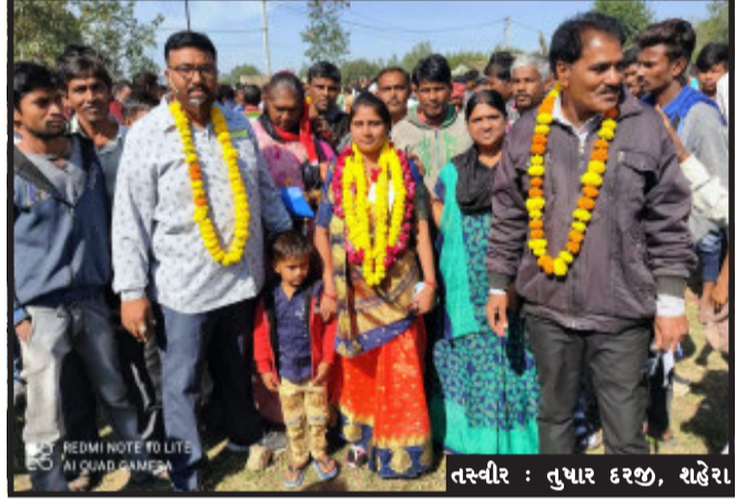
સહિત કુલ ૫૬ ગ્રામ પંચાયતની ચૂંટણી રવિવાર ના રોજ ચોજાઈ હતી તેની મતગણતરી મંગળવાર ના રોજ સવાર ના નવ વાગ્યે

શહેરા, શહેરા તાલુકાની ૫૬ ગ્રામ પંચાયતની ચૂંટણીની મતગણતરી મોડલ સ્કૂલ ખાતે મંગળવાર રોજ રાખવામાં આવી હતી. ૫૬ ગ્રામ પંચાયતના પરિણામો જાહેર થતા વિજય થયેલા ઉમેદવારો તેમના સમર્થકો ડી જે ના તાલે ઝુમી રહ્યા હતા. ગ્રામ પંચાયતની ચૂંટણીની મતગણતરી મધરાતે સુધી ચાલશે. શહેરા તાલુકાના અણીયાદ વાઘજીપુર, મોરવા રેણા, સુરેલી, વાડી, વઘભપુર