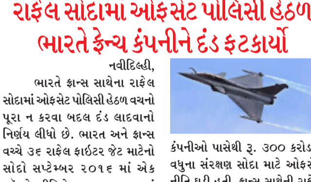
CAGના રિપોર્ટ અનુસાર, આ પોલિસી હેઠળ નિર્ધારિત લક્ષ્યાંક ૨૦૧૫ થી ઘણા મામલામાં પૂરા થયા નથી, જેને ધ્યાનમાં રાખીને ઓફસેટ પ્રતિબદ્ધતાઓનું પાલન ન કરવા બદલ દંડ લાદવાનો સરકારનો નિર્ણય હવે ખૂબ જ મહત્વપૂર્ણ માનવામાં આવે છે. આ અંતર્ગત સરકાર ઓફસેટ વચનો પૂરા ન કરવા બદલ વિદેશી કંપનીઓ સામે કડક વલણ અપનાવશે.