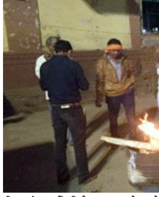
ડીસામાં ૧૦ ડિગ્રીએ તાપમાનનો પારો પહોંચ્યો છે. તેમજ અમદાવાદમાં પણ તાપમાન ૧૦ ડિગ્રી સુધી પારો પહોંચ્યો છે. ભુજમાં ૧૩ ડિગ્રી સુધી ઠંડી નોંધાઈ છે. તેમજ વડોદરામાં ૧૨.૨ ડિગ્રીમાં ૧૪ તો સુરતમાં ૧૫ ડિગ્રી તાપમાન થયું છે. આજે સવારથી જ રાજ્યભરનાં અનેક સ્થળે ઠંડીનો પારો વધુ નીચે ઉતર્યો હતો અને લોકો ઠંડીમાં ઠુંઠવાયા હતા.

શીજવતી ઠંડી અનુભવાઈ રહી છે ત્યારે હવામાન વિભાગે આગામી દિવસોમાં કોલ્ડ વેવની આગાહી કરી છે. જણાવી દઈએ કે, પ્રતિ વર્ષ શિયાળાની ઋતુમાં ઠંડા પ્રદેશ તીબેટ, ધર્મશાળા, હિમાચલ પ્રદેશ સહિતનાં વિસ્તારોમાંથી તીબેટીયન રેફ્યુજી પરિવારો ગુજરાત માટે ગરમ કપડાંનાં વેચાણ માટે ગુજરાતનાં મહેમાન બને છે. આ વર્ષે હજુ ડિસેમ્બર માસ ચાલી રહ્યો હોય ત્યારે ઠંડીનો લોકો સામનો કરી રહ્યા છે. ત્યારે કડક ઠંડી ઠંડીથી રક્ષણ માટે લોકો ગરમ વસ્ત્રોનો સહારો લેવા હોય છે. ત્યારે અમદાવાદ અને ગાંધીનગરમાં આ રેફ્યુજી પરિવાર આવીને રાજ્યનાં લોકોને ગરમ વસ્ત્રોનું વેચાણ કરવા આવી પહોંચ્યા છે. ત્યારે લોકો પણ મન મૂકીને અડીથી પોતાના માટે અને પરિવાર માટે ગરમ વસ્ત્રો ખરીદી રહ્યા છે.