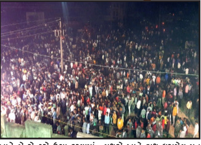
ખાતે બે સેન્ટરો ઉભા કરવામાં આવ્યા હતા. બે મત ગણતરી મથકો ખાતે હાથ ધરાયેલ મત ગણના ખુબ ધીમી ગતિથી ચાલતી

હોવાથી હાથ પરિણામો આવવા માટે ઉમેદવારો અને સમર્થકોને લાંબી રાહ જોવી પડી હતી. ધીમી ગતિથી ચાલતી મત ગણતરીને લઈ ગોધરા તાલુકાના મત ગણતરી મથક અને કાલોલ તાલુકા મત ગણતરી મથક ખાતે એક-એક મત ગણતરી સેન્ટર ઉભા કરવામાં આવ્યા હતા. બાદમાં મત ગણતરીમાં તેજ જોવા મળી હતી. તેમ છતાં ગ્રામ પંચાયતોની ચૂંટણીમાં બેલેટ મત ગણતરી માટે મુકાબેલ સરકારી કર્મચારીઓને બેલેટ પેપર મત ગણતરીના અનુભવનો અભાવ જોવા મળ્યો હતો. ગોધરા તાલુકાની ૬૫ ગ્રામ પંચાયતોની મત ગણતરી બીજા દિવસે ૬ વાગે પુરી થવા પામી હતી. ગ્રામ પંચાયતોની બેલેટ મત ગણતરીમાં તમામ તાલુકાઓમાં ધીમી ગણતરીની સમસ્યા જોવા મળી હતી. આખરે પંચમહાલ જીલ્લાના ૭ તાલુકાની ૩૫૦ ગ્રામ પંચાયતોના પરિણામો આજરોજ વહેલી સવારે આવી ગયા હતા. પંચમહાલ જીલ્લાની ૩૫૦ ગ્રામ પંચાયતોના પરિણામો બાદ વિજેતા સરપંચ ઉમેદવારો અને સભ્યોના વિજય સરઘસ