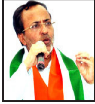
૧-૨ ની ભરતી પબ્લિક સર્વિસ કમિશન મારફતે જ કરાવવામાં આવે છે, બાકીની રીતે કાયદો સુધાર્યા વગર આવી ભરતી કરવામાં આવે તો ભરતી સંપૂર્ણપણે ગેરકાયદેસર હશે.

જણાવ્યું કે, આ વખતે પહેલીવાર એવું બન્યું કે માહિતી અધિકારીઓ જે ક્લાસ ૧, ૨ અને ૩ ત્રણેયની ભરતી કરવાની હતી, તેમની ભરતીની જવાબદારી પબ્લિક સર્વિસ કમિશન જેવી પ્રતિષ્ઠિત સંસ્થાને આપવાના બદલે એમનમ ઠરાવ કરી (આ ઠરાવ સંપૂર્ણપણે કાનૂન વિરોધી છે) એના માટે એક ભરતી સમિતિ રાજ્ય સરકારે બનાવી. આની પાછળનો ઈરાદો મળતિયાઓને કમલમમાંથી જે યાદી આવે તે પ્રમાણે જ ભરતી થી શકે. વર્ગ ૧માં ૮ અધિકારીઓ અને વર્ગ ૨માં ૧૫ અધિકારીઓની ભરતી કરવાની હતી, તેના માટે ૧૨૦૦ જેટલા ઉમેદવારોએ અરજી કરી. રાજ્ય સરકારે પરીક્ષા