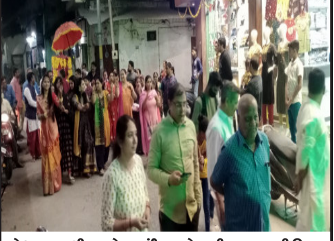
ગોધરા નગરશ્રી રણછોડજી મંદિર ખાતે અગીયારસ તુલસી વિવાહ નિમિત્તે ભકિતભાવ સાથે શોભાયાત્રા ચોજવામાં આવી.

વિગતવારની દલીલો તથા પોલીસ તપાસના કાગળોને ધ્યાનમાં રાખીને આરોપીઓની આગોતરા જામીન અરજી નામંજૂર કરી છે.