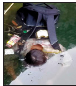
દવાખાને પીએમ અર્થે રવાના કરી દેવામાં આવ્યો છે. પોલીસ દ્વારા આ અજાણ્યા યુવકના વાલીવારસની શોધખોળના ચકો પણ ગતિમાન કરવામાં આવ્યાં છે. ત્યારે બીજી તરફ કુવા તરફથી બીનવારસી મોટરસાઈકલ સાથે એક બેગ પણ મળી આવી હતી. અજાણ્યા યુવકે આપઘાત કર્યો હશે કે, કે તેની હત્યા કરવામાં આવી હશે? જેવા અનેક સવાલો સાથે પોલીસે તપાસનો કુવામાંથી બહાર કાઢી નજીકના

દાહોદ, દાહોદ તાલુકાના છાપરી ગામે એક કુવામાંથી અજાણ્યા યુવકની લાશ મળી આવતાં ચકચાર મચી જવા પામી છે. આ અંગેની જાણ સ્થાનિક પોલીસને થતાં પોલીસ કાફલો તાત્કાલિક ઘટના સ્થળે દોડી ગયો હતો અને યુવકની લાશનો કબજો લઈ નજીકના દવાખાને પીએમ અર્થે રવાના કરી દેવામાં આવ્યો છે.