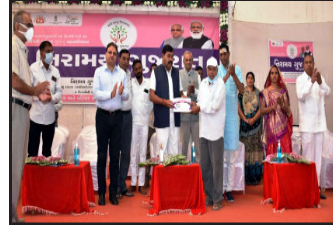
મુખ્યમંત્રી ભૂપેન્દ્રભાઈ પટેલે એક વ્યાપક સ્વાસ્થ્યલક્ષી કાર્યક્રમની શરૂઆત કરી છે.