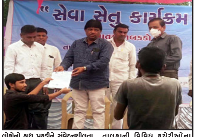
લોકોનો હાથ પકડીને સંવેદનશીલતા સાથે તેમના પ્રશ્નો સમસ્યાઓનું નિરાકરણ કરવામાં આવી રહ્યું છે. આ વેળાએ ગોધરા

ગોધરા, રાજ્યના છેવાડાના માણસોની નાની નાની સમસ્યાઓનું સ્થળ ઉપર નિવારણ થાય તે માટે રાજ્ય સરકારે સેવા સેતુ કાર્યક્રમ મહા અભિયાન સમગ્ર રાજ્યમાં આરંભ્યું છે. જેમાં પડ જેટલી સેવાઓ સાથે સાતમી શૃંખલાના સેવાસેતુ કાર્યક્રમ દ્વારા રાજ્યના નાગરિકોને સરકારની કલ્યાણકારી યોજનાઓ સહિત મહત્વના દસ્તાવેજો ધર આંગણે પ્રાપ્ત થાય તે માટે નવતર અભિગમ હાથ ધર્યો છે. ગરીબ અને વંચિત દિકરા-દિકરીઓના આરોગ્ય, શિક્ષણથી લઈ તમામ બાબતોની ચિંતા સરકાર કરે છે. ત્યારે આ સેવા સેતુ દ્વારા છેવાડા વિસ્તારના ગરીબ