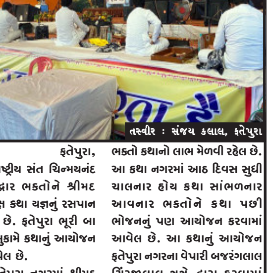
તસ્વીર : સંજય કલાલ, ફતેપુરા

ફતેપુરા, રાષ્ટ્રીય સંત ચિન્મયનંદ બાપુ હરિદ્વાર ભકતોને શ્રીમદ ભાગવત મોક્ષ કથા ચંચાનું રસપાન કરાવી રહેલ છે. ફતેપુરા ભૂરી બાપુ પ્લોટ મુકામે કથાનું આયોજન કરવામાં આવેલ છે.