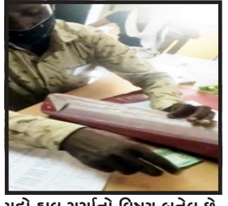
મુદી હાલ ચર્ચાનો વિષય બનેલ છે.

સંતરામપુર, સંતરામપુર પોલીસ મથક ના પોલીસ સ્ટેશનની કાઈમ બાન્ધ શાખામાં એનઓસી (કોઈ ગુનામાં સંડોવાયેલા નથી)નું પ્રમાણપત્રમાં મીલીભગતથી નાણાં ઉઘરાવાતા હોવાનો વિડીયો તાજેતરમાં વાયરલ થતાં પોલીસ બેઠામાં ભારે હક્કમપ મચી ગયો છે અને આ ઉઘરાણાનો