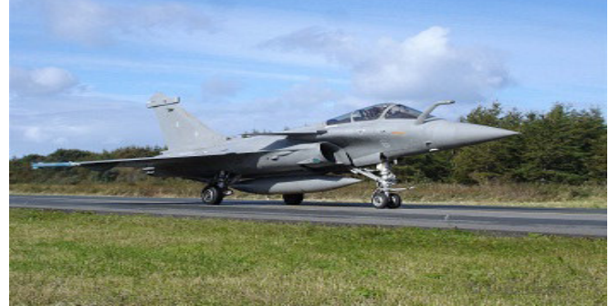
ખુબ મોટી લાંચ અપાઈ હોવાના ગંભીર આક્ષેપ થયા હતા પરંતુ ભારતના સંરક્ષણ મંત્રાલયે અને ફ્રાન્સની દસોલ્ટ કંપનીએ તે બાબતનો સતત ઈકાર કરતાં તમામ આક્ષેપોને આધારવિહિન ગણાવી ફગાવી દીધા હતા. તે ઉપરાંત ભારતની સુપ્રીમ કોર્ટે પણ આ કેસમાં તપાસ કરાવવાની દાદ

નથી. જે ખોટા બિલો દ્વારા દસોલ્ટ કંપનીએ ભારતીય દલાલને લાંચ આપી હતી તે બિલની નકલ પણ તે પ્રસિદ્ધ કરી રહ્યું છે. સોદો પાર પાડવા નકલી બિલો, ખોટા કોન્ટ્રાક્ટ અને કેટલીક ઓફશોર કંપનીઓની મદદ લેવામાં આવી હતી. ભારતની સીબીઆઈ અને ઈડી જેવી એજન્સીઓ છેક ૧૯૧૮થી આ લાંચ અંગે માહિતી ધરાવતી હતી. યાદ રહે કે આ અગાઉ પણ રાફેલ સોદામાં