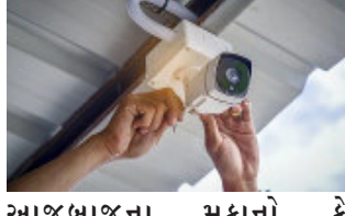
આજુબાજુના મકાનો કે બંગલાઓમાં કે રસ્તાઓ ઉપર મૂકાયેલા CCTV કેમેરા જ સહાયક સાબિત થઈ રહ્યાં છે. આવા સંજોગોમાં રાજ્ય સરકારે હવે રહેણાંક વિસ્તારમાં CCTV ફરજિયાત બનાવવા નવી CCTV પોલિસી અમલી બનાવી છે.

ગાંધીનગર, રાજ્યમાં હવે CCTV ફરજિયાત કરવામાં આવ્યા છે ત્યારે હવે સ્થાનિક વિસ્તારોમાં પણ બનતી નાની મોટી ઘટનાઓને રોકવા, ગુનેગારોમાં ભય પેદા કરવા અને ગુના બને તો તેના ઝડપી ઉકેલ માટે રાજ્ય સરકારે કમરકસી છે. છેલ્લા કેટલાક સમયથી રહેણાંક વિસ્તારોમાં ચોરી, લૂંટ, ઘરફોડ ઉપરાંત હત્યા સહિતની ઘટનાઓ વધી રહી છે અને ઉકેલ માટે સ્થાનિક પોલીસને