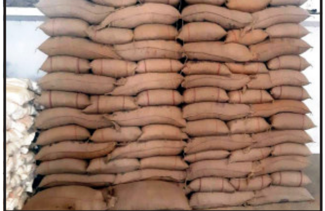
રાજ્ય સરકાર દ્વારા આ અગાઉ વેચાણ કરવા માંગતા હોય તેમના જે ખેડૂતો ટેકાના ભાવે ડાંગરનું

લુણાવાડા, રાજ્ય સરકાર દ્વારા ગુજરાતના ખેડૂતોને આર્થિક રક્ષણ મળી રહે અને તેમના ઉત્પાદનોના પોષણક્ષમ ભાવ મળી રહે તેવા હેતુથી ચાલુ વર્ષ ડાંગરની સીઝનમાં ટેકાના ભાવથી ખરીદવાનું આયોજન કરવામાં આવ્યું છે જે અંતર્ગત મહિસાગર જિલ્લામાં ડાંગરની ટેકાના ભાવે ખરીદીનો આજે લાભ પાંચમના શુભ દિવસથી જિલ્લાના તમામ તાલુકાના એ પીએમસી ખાતે પ્રારંભ કરવામાં આવ્યો હતો.