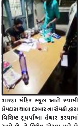
શારદા મંદિર સ્કૂલ ખાતે સ્વામિ પ્રેમદાસ થાલા દરબાર ના સેવકો દ્વારા વિશિષ્ટ દૂધપૌઆ તૈયાર કરવામાં આવે છે. તે વિશેષ એટલા માટે છે કારણ કે, તે દૂધ પૌઆમાં ચિત્રકૂટ થી

ગોધરા, ગતરોજ શરદ પૂનમની ઉજવણી પંચમહાલ જિલ્લામાં અનેક રીતે જોવા મળી. કેટલીક જગ્યાઓએ હોમ-દબન નવચંડી તથા કેટલીક જગ્યાઓએ રાસ-ગરબાનું આયોજન કરવામાં આવ્યું. તેમજ શરદપૂનમની રાત્રે દૂધ પૌઆ ખાવાની પરંપરા વર્ષોથી ચાલી આવી છે. ત્યારે ગોધરા શહેર માં આવેલી શારદા મંદિર સ્કૂલ ખાતે છેલ્લા કેટલાય વર્ષોથી વડોદરા સ્થિત સ્વામિ પ્રેમદાસ થાલા દરબારના સેવકો દ્વારા અનોખી રીતે શરદપૂનમની ઉજવણી કરવામાં આવે છે અને તેનો લાભ લેવા માટે પંચમહાલ જિલ્લાના ગામોમાંથી તો ખરા જ પરંતુ દૂર દૂરથી અનેક લોકો આવતા હોય છે.