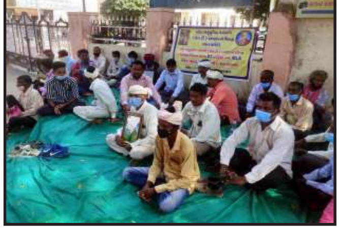
આગામી ૧૯ નવેમ્બર થી ગાંધીનગર ખાતેના ભાજપ કાર્યાલય કમલમની બહાર આ ઘરણા કાર્યક્રમ યોજવામાં આવશે. મોરવાહડકના ધારાસભ્ય અને રાજ્ય કક્ષાના

ગોધરા, ખોટા અનુસૂચિત જનજાતિ (એસ.ટી.) પ્રમાણપત્રો વિરૂદ્ધ લડત સમિતિ પંચમહાલ દ્વારા અચોક્કસ મુદતનો ઘરણા કાર્યક્રમ ગોધરા કલેક્ટર કચેરી કમ્પાઉન્ડ બહાર યોજવામાં આવ્યો. જેમાં સમિતિના આક્ષેપ મુજબ પંચમહાલ જિલ્લાના બોગસ સર્ટિફિકેટ વાળા મોરવાહડક ના ધારાસભ્ય અને રાજ્યકક્ષાના આરોગ્ય મંત્રી નિમિષાબેન સુથારને હોદ્દા પરથી દૂર કરવાની માંગ સાથે સત્યાગ્રહ કરી રહ્યા છે. ત્યારે લડત સમિતિના આગેવાનના જણાવ્યા મુજબ આ ઘરણા કાર્યક્રમ અચોક્કસ સમય સુધી ચાલુ રાખવામાં આવશે અને