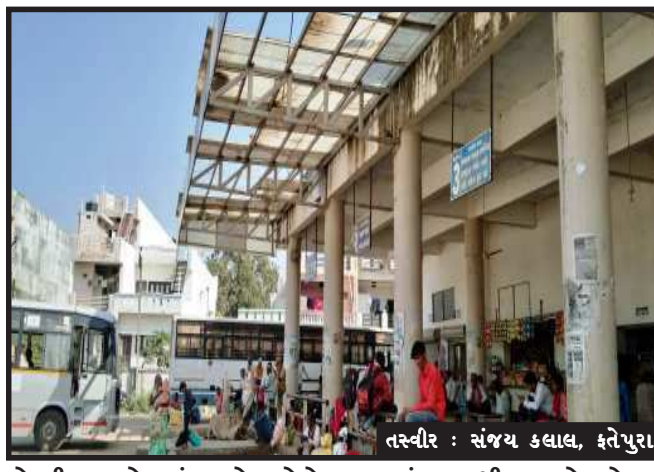
તસ્વીર : સંજય કલાલ, ફતેપુરા

ફતેપુરા, ફતેપુરા તાલુકા મથકે બસ સ્ટેશનને ફક્ત ૬ વર્ષ થયાં હોવા છતાં મુસાફરો માટે ની પ્રાથમિક સુવિધાનો આભવ જોવા મળી રહ્યો છે. ફતેપુરા તાલુકો રાજસ્થાન રાજ્યને અડીને આવેલો હોવા રાજસ્થાન તેમજ ફતેપુરા તાલુકાના હજારો મુસાફરો રોજ ના અવર જવર કરતા હોય છે. અહીંયા વર્ષો પહેલાનું ટાઈમ ટેબલ મૂકેલું છે. જેમાં હાલ મોટા ભાગની બસોનો ટાઈમ બદલાઈ ગયેલો છે. તેમજ મોટા ભાગની બસ બંધ થઈ જાય પામી છે અને મુસાફરો દ્વારા બસ ચાલુ કરવા માટે અનેકવાર રજૂઆતો પણ કરવામાં આવી હોવા છતાં પણ બસો ચાલુ કરવામાં આવતી નથી. જેથી મુસાફરોને હાલાકી વેઠવી પડી રહી છે.