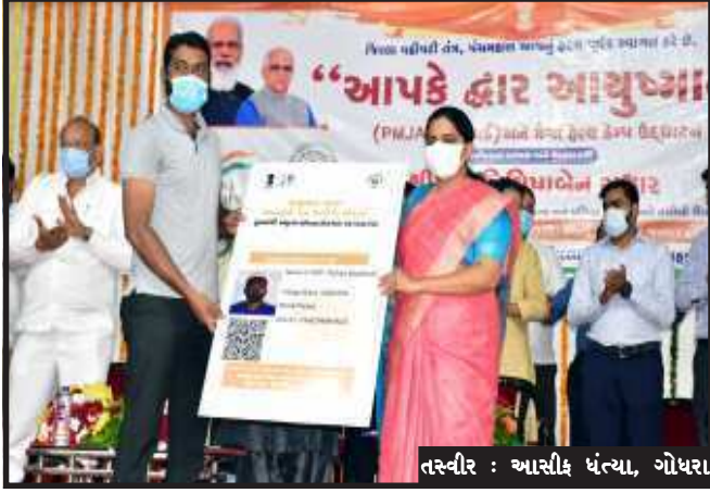
બેડની સુવિધા ધરાવતી નવી મેડિકલ કોલેજ પણ વહેલીતકે, શક્યત આ જ વર્ષે શરૂ કરવા માટે હરસંભવ પ્રયાસ કરવામાં આવી રહ્યા હોવાનું જણાવતા આ કોલેજનાં ડોક્ટર-નર્સિસ માટે હોસ્ટેલ, લેબોરેટરી, લાઈબ્રેરી સહિતની સુવિધાઓ વહેલીતકે ઉપલબ્ધ કરાવી એમ બીબીએસની પ્રથમ બેચ ટૂંકાગાળામાં શરૂ થાય તે સુનિશ્ચિત કરવામાં આવશે તેમ મંત્રીએ જણાવ્યું હતું.

ગોધરા, પેસાના અભાવે રાજ્યનો કોઈ પણ નાગરિક જરૂરી શ્રેષ્ઠ સારવારથી વંચિત ન રહે, નાણાકીય ખર્ચના લીધે કોઈ પરિવાર બીમારીના લીધે પોતાનો આધારસ્તંભ ન ગુમાવે તેવા ઉદ્દેશ હેતુ સાથે રાજ્યભરમાં “આયુષ્યમાન આપ કે દ્વાર” અભિયાનની શરૂઆત કરવામાં આવી છે. જે અંતર્ગત રાજ્યના ૦૨ કરોડથી વધુ લાભાર્થીઓને ૦૨ હજાર કરતા વધુ પ્રકારની, ૫ લાખ સુધીની સારવારની સુવિધા આપતા PMJAY-MA કાર્ડ ઈજ્યુ કરવામાં આવશે તેમ આરોગ્ય રાજ્યમંત્રી નિમિષાબેન સુથારે ગોધરા, સિવિલ હોસ્પિટલ ખાતે PMJAY-MA કાર્ડ અને મેગા હેલ્થ કેમ્પનાં ઉદ્દેશ્યો કાર્યક્રમને સંબોધતા જણાવ્યું હતું. ૧૦૦ દિવસની ઉજવણી અંતર્ગત ૨૩મી સપ્ટેમ્બરથી શરૂ થયેલ આ અભિયાન હેઠળ દરેક જિલ્લા-તાલુકા મથકોએ મેગા કેમ્પ કરીને રાજ્યના ૮૦ લાખથી વધુ પરિવારોને આ યોજના હેઠળ આપવી લેવાની દિશામાં કામગીરી કરવામાં આવી રહી છે. આટલેથી