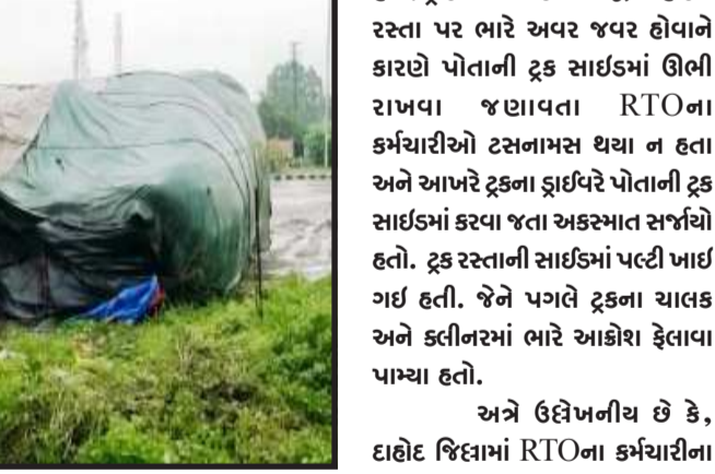
કાગળ વિગેરે નથી. તો ૫૦,૦૦૦/- રૂપિયા આપવા પડશે માટે ટ્રકના ડ્રાઈવર અને કલીનર દ્વારા ટ્રક ઊભી રાખી હતી અને સાઈડમાં કરવાની

દાહોદ, દાહોદમાં એક ટ્રક ડ્રાઈવરને હેરાન પરેશાન કરતો કિસ્સો અને સોશિયલ મીડિયામાં વાયરલ થયેલા વીડિયો પ્રમાણે જાણવા મળી રહ્યું છે. દાહોદ જિલ્લાના પીપલોદ આસપાસમાં આવેલ ટોલટેક્સ ખાતે એક ટ્રક ડ્રાઈવર પસાથઈ રહ્યો હતો. ત્યારથી RTOના કેટલાક કર્મચારીઓ પોતાના વાહનો સાથે ટોલટેક્સ પર આવ્યા હતા અને ત્યાંથી પસાર થતી એક ટ્રકને ઊભી રાખી હતી. એક ટ્રક ડ્રાઈવરના જણાવ્યા અનુસાર તેઓની પાસે આરટીઓની ગાડી લઈકેટલાક RTOના કર્મચારીઓ આવ્યા હતા અને બેફામ ગાળો બોલી ટ્રકના ચાલકને કહેલ કે, ગાડીનો કોઈ ટેક્સ અથવા તો કોઈ વીમો, વિગેરે