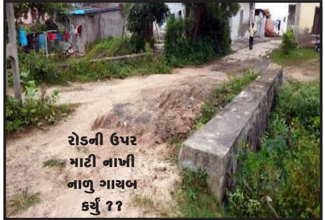
રોડની ઉપર માટી નાખી નાળુ ગાયબ કર્યું ??