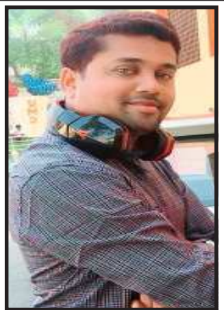
પોલીસ મથક તેની વિરુદ્ધ ફરિયાદ નોંધાવવા પામેલ છે.