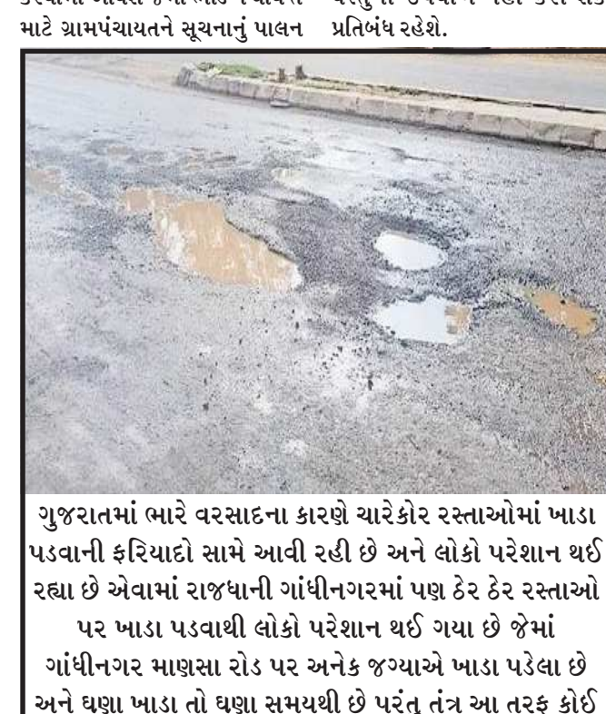
ગુજરાતમાં ભારે વરસાદના કારણે ચારેકોર રસ્તાઓમાં ખાડા પડવાની ફરિયાદો સામે આવી રહી છે અને લોકો પરેશાન થઈ રહ્યા છે એવામાં રાજધાની ગાંધીનગરમાં પણ ઠેર ઠેર રસ્તાઓ પર ખાડા પડવાથી લોકો પરેશાન થઈ ગયા છે જેમાં ગાંધીનગર માણસા રોડ પર અનેક જગ્યાએ ખાડા પડેલા છે અને ઘણા ખાડા તો ઘણા સમયથી છે પરંતુ તંત્ર આ તરફ કોઈ ધ્યાન કેન્દ્રિત કરતું જ નથી...

કરશે. કાયદો અને વ્યવસ્થા જાળવવા ૫૦૦થી વધારે પોલીસ, જી.આર.ડી. મહિલા પોલીસ સહિત તેના તમામ આવતા વિભાગોના પોલીસ કર્મચારીઓ ૨૪ કલાક ખરે ખરે સેવા આપશે. મંદિર પર ભક્તો પ્રસાદ સરળતાથી લઈ-જઈ ચડાવી શકે તે માટે ગ્રામપંચાયત દ્વારા ગેટ નંબર ૨ પર અલગથી દુકાનો ફાળવી બજાર ઊભી કરવામાં આવશે જેમાં ભીડ ન થાય તે માટે ગ્રામપંચાયતને સૂચનાનું પાલન કરવાનું રહેશે. દર્શન માટે યાત્રિકોને દર વર્ષની જેમ ગેટ નંબર ૪ પરથી પ્રવેશ કરી શકશે. માતાના મઢમાં આ વર્ષે મેળો નહીં યોજવાનો હોવાથી માત્ર સ્થાનિક વેપારીઓ જ પ્રસાદ સહિતનું વેચાણ કરી શકશે. બહારથી કોઈ વેપારીને પોતાની દુકાન કે ખાણી-પીણી માટે સ્ટોલ નહીં કરી શકે જ્યારે કોઈપણ વેપારી પ્લાસ્ટિકની કોઈપણ વસ્તુનો ઉપયોગ નહીં કરી શકે, પ્રતિબંધ રહેશે.