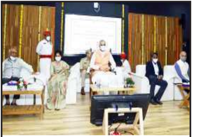
ગુજરાત સાહિત્ય અકાદમી અને સરકારી વિનયન કોલેજ, ગાંધીનગર દ્વારા યોજાયેલા રાષ્ટ્રીય શિક્ષા નીતિ ભારતીય ભાષાઓ અને સાહિત્યના વિશેષ સંદર્ભમાં વિષય ઉપર શરૂ થયેલી બે દિવસીય કાર્યશાળાનો પ્રારંભ કરાવતા ગુજરાત રાજ્યના રાજ્યપાલ આચાર્ય દેવવ્રત...

નવી દિલ્હી, અમિત શાહે બેઠક માટે ૧૦ રાજ્યોના મુખ્યમંત્રીઓને બોલાવ્યા છે જેથી તે રાજ્યોની નક્કસલી ગતિવિધિઓની માહિતી લઈ શકાય. સાથે જ બેઠકમાં નક્કસલીઓનો સામનો કરવા માટે ભરવા પડતા પગલાંઓ અંગે પણ ચર્ચા થશે. બેઠકમાં છત્તીસગઢ ઉપરાંત ઝારખંડ અને ઓડિશા પર વિશેષ ભાર આપવામાં આવશે. કેન્દ્ર ઈચ્છે છે કે, છત્તીસગઢના નક્કસલ પ્રભાવિત વિસ્તારોમાં સુરક્ષા દળોના અભિયાન તેજ કરવામાં આવે. રાજ્ય પોલીસ ઓપરેશનનું નેતૃત્વ કરે છે. પરંતુ કેટલાક લોકોના મતે બધેલ સરકારમાં આ ઓપરેશનની સંખ્યા ઘટી છે. કેન્દ્રીય ગૃહ મંત્રાલયે રવિવારે નક્કસલ પ્રભાવિત રાજ્યોના મુખ્યમંત્રીઓ સાથે એક બેઠક યોજી છે. ગૃહ મંત્રી અમિત શાહ આ મુખ્યમંત્રીઓ સાથે નક્કસલ પ્રભાવિત વિસ્તારોની સુરક્ષા સ્થિતિની સમીક્ષા કરશે. એક અહેવાલ પ્રમાણે