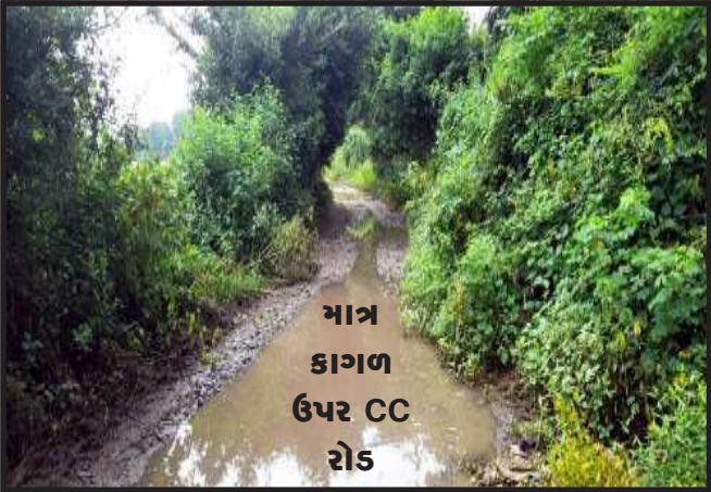
માત્ર કાગળ ઉપર CC રોડ