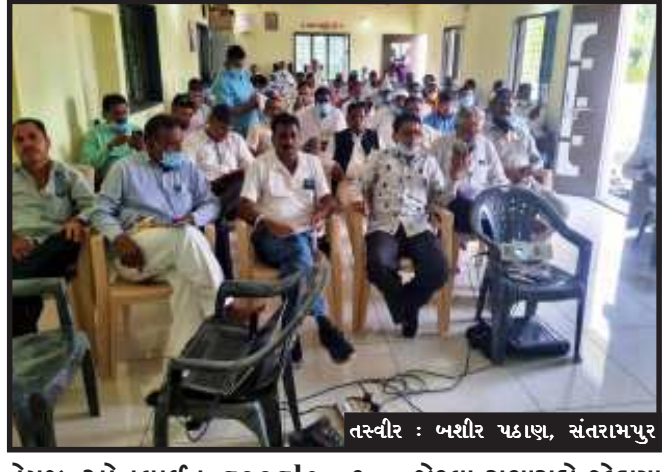
તેમજ ઓનલાઈન Google Meet માદ્યમથી અંદાજિત ૧૦૦ જેટલા સભાસદો જોડાયા સભાની શરૂઆત દિપ પ્રાગટ્ય