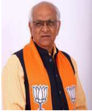
મંત્રીમંડળની રચનાને લઈને હવે કેન્દ્રીય નીરીક્ષકો અને પ્રદેશના નેતાઓએ વચ્ચે મંત્રણાનો દોર પણ શરૂ

થઈ ચૂક્યો છે. સૂત્રોના મતે, નવા મંત્રીમંડળમાં યુવાઓને તક અપાશે. એટલુ જ નહીં, ૬૦ ટકા નવા ચહેરા હશે. બે-ત્રણ દિવસમાં કેબિનેટ કક્ષાના મંત્રીઓની શપથવિધિ યોજાય તેવા નિર્દેશ મળી રહ્યાં છે. નવા મંત્રીમંડળમાં કોનો સમાવેશ કરવો અને કોને પડતા મૂકવા તે અંગે કવાયત શરૂ થઈ છે. ભાજપના ટોચના સૂત્રોના મતે, યુપી ફોર્મ્યુલા ગુજરાતમાં અપનાવવામાં આવશે નહીં. બે નાયબ મુખ્યમંત્રી બનાવવામાં નહીં આવે. આ માત્ર રાજકીય અફવા પુરાવાર થશે. વિજય રૂપાણી સરકારમાં નબળી કામગીરી