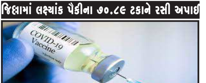
જિલ્લામાં લક્ષ્યાંક પેકીના ૭૦.૮૯ ટકાને રસી અપાઈ

ગોધરા, પંચમહાલ જિલ્લામાં કોવિડ વેક્સિનેશન અભિયાન અંતર્ગત જિલ્લાના કુલ ૬૨૦ ગામો પૈકી ૨૦૦ ગામોમાં ૧૦૦ ટકા રસીકરણની કામગીરી પૂર્ણ કરવામાં આવી છે. ગોધરા તાલુકાના ૧૨૩ ગામો પૈકી ૪૫ ગામ, હાલોલ તાલુકાના ૧૨૩ પૈકી ૨૭ ગામ, કાલોલ તાલુકાના ૭૧ ગામ પૈકી ૩૪ ગામ, જંબુઘોડા તાલુકાના ૫૫ ગામમાંથી ૧૨ ગામ, ઘોંબા તાલુકાના ૧૦૦ ગામમાંથી ૩૦ ગામ અને શહેરા તાલુકાના ૬૪ ગામમાંથી ૩૩ ગામોમાં ૧૦૦ ટકા રસીકરણની સિધ્ધિ હાંસલ કરવામાં આવી છે. જિલ્લામાં ૧૩,૧૪,૮૭૯ ના રસીકરણના લક્ષ્યાંકની સામે ૯,૩૨,૦૫૯ લાભાર્થીઓને એટલે કે ૭૦.૮૯ ટકા વેક્સિનેશનની કામગીરી પૂર્ણ કરવામાં આવી છે. ગોધરા તાલુકાના ૨,૨૮,૭૭૫ વ્યક્તિઓને, હાલોલ તાલુકાના ૧,૫૩,૮૭૭ ના, કાલોલ તાલુકાના ૧,૨૨,૩૫૪ વ્યક્તિઓને, જંબુઘોડા તાલુકાના ૨૬,૭૦૨ વ્યક્તિઓને, મોરવા હડ્ડ