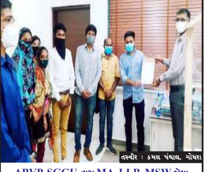
તસ્વીર : કમલ પંચાલ, ગોધરા

વેનાર ખેલાડીઓ, કોચ, ટ્રેનરોને દોડ બાદ લીલુ પાણી અને નાસ્તાની પણ દરમિયાન જિલ્લા પોલીસ વિભાગ દ્વારા પોલીસ બંદોબસ્ત, ટ્રાફિક વાન અને પાયલોટીંગ વાનની પણ વ્યવસ્થા કરવામાં આવી હતી. આ દોડમાં ભાગ