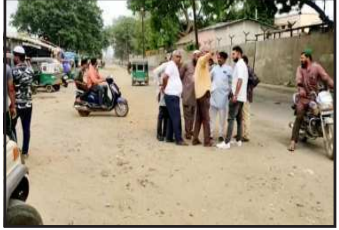
જણાવ્યો છે. ગોધરા શહેર નગર પાલિકા વિસ્તારમાં સુખાકારીના કામોના ભાગરૂપે ભૂગર્ભ ગટર લાઈનની કામગીરી કરવામાં

ગોધરા, ગોધરા શહેરના પશ્ચિમ વિસ્તારના અનેક વિસ્તારોમાં ઉભરાતી ગટરોને લઈ લોકો પરેશાન થઈ રહ્યા છે. ત્યારે પાલિકા પ્રમુખ સહિતના હોદ્દેદારો એ આ વિસ્તારની મુલાકાત લઈને સમસ્યા દુર કરવાની ખાતરી આપી હતી. પશ્ચિમ વિસ્તારના રહિશોના લાંબા સમય થી સમસ્યાનો ઉકેલ ન આવ્યો હોય ત્યારે પાલિકાની મહેરબાની પાછળનું કારણ મ્યુનિસીપલ કમિશ્નર ગોધરાની મુલાકાતે આવનાર છે. ત્યારે પાલિકા વિસ્તારમાં સબ સલામત હોવાનો અહેસાસ કરવાનો પ્રયાસ