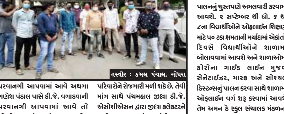
પરવાનગી આપવામાં આવે અથવા ગણેશ મહોત્સવમાં ડી.જે. વગાડવાની પરવાનગી આપવામાં આવે તો ડી.જે.ના ધંધા ઉપર આશ્રીત પરિવારોને રોજગારી મળી શકે છે. તેવી માંગ સાથે પંચમહાલ જીલ્લા ડી.જે. એસોશીએસન દ્વારા જીલ્લા કલેક્ટરને આવેદન આપવામાં આવ્યું છે.

ગોધરા, પંચમહાલ જીલ્લાના ડી.જે. એસોશીએસન દ્વારા ગણેશ મહોત્સવમાં ડી.જે.ની પરવાનગી આપવામાં આવે તેવી માંગ સાથે જીલ્લા કલેક્ટરને આવેદન આપવામાં આવ્યું. કોરોના મહામારીને કારણે ઘણા બધા ધંધાઓ બંધ કરવામાં આવ્યા હતા. પરંતુ હાલ મોટાભાગના ધંધા શરૂ કરવાની પરવાનગી આપી દેવામાં આવી છે પરંતુ ડી.જે. વગાડવાવાળા ધંધા હજી સુધી બંધ છે અને આ ધંધા સાથે સંકળેલ ઘણા પરિવારો આર્થિક તંગી વેઠી રહ્યા છે. આવનાર દિવસોમાં ગણેશ મહોત્સવ આવી રહ્યો છે. ત્યારે ગણેશ મહોત્સવમાં ડી.જે. વગાડવાની