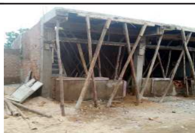
પ્રધાન મંત્રી આવાસ યોજનાના મળેલ બીજા હમો બાદ ચાલુ થયેલ કામની તસ્વીર.....

મેળવવા માટે ઘરમના ઘડકા ખાવા પડતા હોય છે, કેમ કે પ્રધાનમંત્રી આવાસ યોજનામાં જે લાભાર્થીઓ આવતા હોય તેઓને સહાય તે લાભાર્થીઓના ખાતામાં સીધા જમા થતા હોય છે, જેમાં લાભાર્થીઓના બેન્ક ખાતા કે તેઓના બેન્ક ખાતામાં થયેલ ભૂલ ના કારણે આ લાભાર્થીઓને સમયસર આવાસ યોજનાની સહાય મળતી ન હોવાના અનેક કિસ્સાઓ સામે આવેલા છે, તેવા કિસ્સામાં આવાસ લાભાર્થીઓને આવાસ યોજના થકી આપનાર સહાય ન મળતા તેઓને પડતી