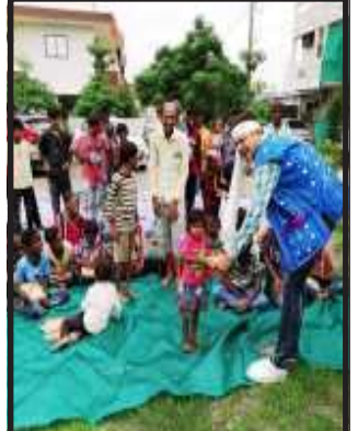
આદિવાસી સમાજે કોરોના મહામારીમાં જે ઓએ પોતાના વ્હાલ સોચા સ્વજનોને ગુમાવ્યા છે. તેઓને શ્રદ્ધાંજલી અર્પવાનો કાર્યક્રમ પણ યોજવામાં આવ્યો હતો.

ગોધરા, કોરોના મહામારીના કારણે આ વર્ષે પણ સમસ્ત તહેવારોની ઉજવણી શક્ય બની નથી. ત્યારે આજ વિશ્વ આદિવાસી દિવસ હોઈ ગોધરા શહેરમાં વસતા આદિવાસી સમાજના ભાઈઓ અને બહેનોએ વિશ્વ આદિવાસી દિવસની સાદાઈથી ઉજવણી કરી હતી. જેમાં આદિવાસી સમાજ દ્વારા ભૂરાવાવ વિસ્તારમાં આવેલી વ્રજધામ સોસાયટી ખાતે વૃક્ષારોપણનો કાર્યક્રમ યોજ્યો હતો. ત્યારબાદ સમાજના પાંચ તેજસ્વી વિદ્યાર્થીઓનું સન્માન કરવામાં આવ્યું હતું. તદ્દઉપરાંત ૫૦ થી વધુ નાના બાળકોને નોટ પેનનું વિતરણ કર્યું હતું. ગોધરા શહેરમાં વસતા