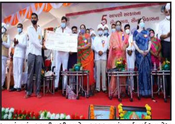
સરકારના પાંચ વર્ષ પૂર્ણ થતા છેલ્લા નવ દિવસથી સમગ્ર રાજ્યમાં પ્રજાલક્ષી કાર્યક્રમો ચોક્કસ પોતે કરેલા વિકાસ કાર્યોનો હિસાબ જનતા સમક્ષ રજૂ કરી રહી છે. આ પ્રસંગે કરોડો રૂપિયાના નવા વિકાસકાર્યોનું લોકાર્પણ-ખાતમુહૂર્ત થયા છે, આ પ્રકારે સરકારની કલ્યાણકારી યોજનાઓ અંતર્ગત વધુને વધુ લાભાર્થીઓને આપવી લેવા, વધુને વધુ લાભાર્થીઓ સુધી તેમને મળવાપાત્ર થતા લાભોની જાણકારી પહોંચાડવાનો એક પ્રયાસ થઈ રહ્યો છે. આ જ દિશામાં આજે આદિવાસી

ગોધરા, મુખ્યમંત્રી વિજયભાઈ રૂપાણી અને નાયબ મુખ્યમંત્રી નીતિનભાઈ પટેલના નેતૃત્વ હેઠળની રાજ્ય સરકારના પાંચ વર્ષ પૂર્ણ થવાના અવસરે પાંચ વર્ષ આપહી સરકારના, સૌના સાથેથી, સૌના વિકાસના હેઠળ છેલ્લા ૬ દિવસથી રાજ્યમાં વિકાસનો સેવાયજ શરૂ કરવામાં આવ્યો છે. જે શ્રેણીમાં આજે વિશ્વ આદિવાસી દિવસ નિમિત્તે પંચમહાલ જિલ્લામાં મોરવા હડફ તાલુકાના મોરા અને ઘોઘંબા તાલુકાના કણબીપાદી ખાતે પ્રજાલક્ષી કાર્યક્રમોનું આયોજન કરવામાં આવ્યું હતું. મોરા ખાતે અત્ર, નાગરિક પુરવઠો અને ગ્રાહકોની બાબતો, કુટિર ઉદ્યોગ, છાપકામ અને લેખનસામગ્રી વિભાગોના કેબિનેટ મંત્રી જયેશભાઈ રાદકિયાની અધ્યક્ષતામાં જનસમારોહ યોજાયો હતો. જેમાં હુંવરબાઈનું મામેરૂ, માનવ ગરિમા, મકાન સહાય-લોન સહાય સહિતની વિવિધ સહાય યોજનાના લાભાર્થીઓને સહાયનું તેમજ વન અધિકારપત્રોનું વિતરણ કરવામાં