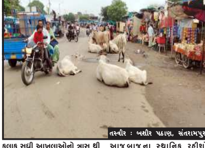
તસ્વીર : બશીર પઠાણ, સંતરામપુર

સંતરામપુર, નગરમાં રખડતા પશુઓનું આતંક એકસાથે પાંચ વ્યક્તિ ઘવાયા સંતરામપુર નગરમાં સતત છેલ્લા બે માસથી રખડતાં પશુઓના કારણે રાહદારીઓને અવારનવાર જીવનું જોખમ વધી રહેલો છે. રોડ ઉપર જ સામસામે આખલાઓ આવી જતા પસાર થતા રાહદારીઓને હુમલો કરીને ભારે નુકશાન કર્યું હતું. આશરે આજે પાંચ વ્યક્તિઓને રખડતાં પશુઓને ના આખલાઓ લડતા રોડ ઉપર ના જતા વ્યક્તિઓને ઘવાયા હતા. સંતરામપુરના કોલેજ રોડ વિસ્તારમાં