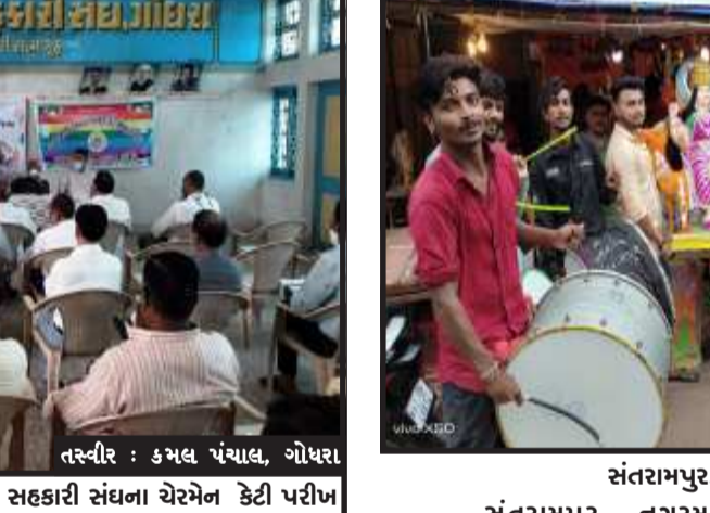
તસ્વીર : કમલ પંચાલ, ગોધરા

ગોધરા, ગુજરાત રાજ્ય અર્બન બેંક ફેરેશન અમદાવાદ. પંચમહાલ ઠાકોડ મહિસાગર અર્બન બેંક એસોસિએશન ગોધરા, તથા પંચમહાલ જિલ્લા સહકારી સંઘ ગોધરા ના સંયુક્ત ઉપક્રમે પંચમહાલ જિલ્લાની નાગરિક સહકારી બેંકોના ચેરમેન - એમડી અને મેનેજર ઓ માટે એક દિવસીય સેમિનાર પંચમહાલ જિલ્લા