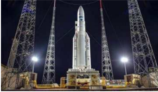
કરવામાં આવશે. કિમી ઉપર કક્ષામાં સ્થાપિત થયા બાદ એકવાર પૃથ્વીથી ૩૬,૦૦૦ આ ઉપગ્રહ 'આકાશમાં આંખ' બનશે

દેખરેખ કરશે. આ ઉપગ્રહ દ્વારા મોટા એરિયાની દેખરેખ એક સમયમાં કરી શકાશે. આની નજરથી દુશ્મનો પણ નહીં બચી શકે. અંતરિક્ષ વિભાગના એક અધિકારીએ જણાવ્યું કે, આ સેટેલાઈટ ભારત માટે ઘણો મહત્વપૂર્ણ થવાનો છે. અત્યંત જાહેરાતના કેમેરા લાગ્યા હોવાના કારણે સેટેલાઈટ ભારતીય ભૂમિ અને દરિયાની દેખરેખ કરશે, ખાસ કરીને સરહદોની.