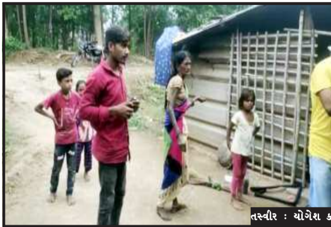
તસ્વીર : ચોગેશ કનીજીયા, ઘોઘંબા

ઘોઘંબા, પંચમહાલ જિલ્લાના ઘોઘંબા પંથક વિસ્તારોના ગામોમાં દિપડાની રંજાડ થી ગ્રામજનો પરેશાન થતાં હોય છે અને દિપડાના નામથી ડર અનુભવી રહ્યા છે. ત્યારે ઘોઘંબા ગામે મંદિર અને સ્મશાનની આસપાસ છેલ્લા કેટલાક સમયથી દિપડા દેખાઈ રહ્યા છે. જેને લઈ ખેડૂતોમાં ડરનો માહોલ છે. રાત્રીના સમયે દિપડો બકરાના શિકાર માટે રહેણાંક વિસ્તારમાં આવી ચડતા ગ્રામજનોએ દિપડાને ઝડપી