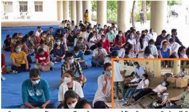
સુધી સરકાર દ્વારા નિવારણ નહીં આવે તો અમને અપાયેલ કરુણા વોરિયરનું સર્ટિફિકેટ અમે સરકારને પરત આપીશું.

બે હજારથી વધુ જુનિયર ડોક્ટરો સરકાર સામે લડી લેવાના મૂકમાં છે. જ્યારે બીજી તરફ સરકારે જુનિયર ડોક્ટરોને હોસ્ટેલ ખાલી કરવાના આદેશો જારી કર્યા છે. છતાં જુનિયર ડોક્ટરો હડતાળ યથાવત રાખવા મક્કમ છે. જેથી જુનિયર ડોક્ટરો અને સરકાર આમને સામને આવી ગયા છે. જુનિયર ડોક્ટરોની હડતાળ છતાં સિવિલ હોસ્પિટલમાં ઈમરજન્સી-ઓપીડી સહિતની સેવાઓ યથાવત છે, પણ ૪૫ ટકા પ્લાન્ડ સર્જરી રદ કરવાની ફરજ પડી છે. જોકે, હોસ્પિટલનંત્ર દ્વારા સિનિયર ડોક્ટરો (ફેક્ટરી) ની રાઉન્ડ ધ કલોક ડ્યૂટી ગોઠવાઈ છે.