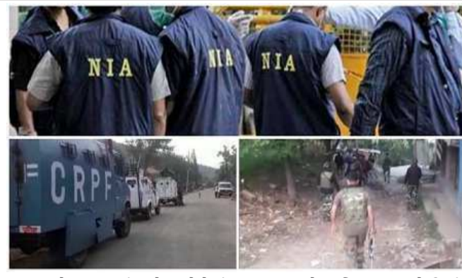
આ દેશમાં કહ્યું કે, આતંકવાદી સંગઠને એક ફંટલ સંગઠન જમ્મુ-કાશ્મીર પ્રભાવિત રાહત ટ્રસ્ટનું ગઠન કર્યું હતું. એ પણ જણાવવામાં આવ્યું કે, આ ટ્રસ્ટનો ઉદ્દેશ આતંકવાદી ગતિવિધિઓનું સેફ ફાયનાન્સ કરવાનો હતો. આ ટ્રસ્ટ મુખ્ય રીતે આતંકવાદીઓ અને તેમના પરિવારો માટે ફંડ પુરુ પાડવા માટે બનાવવામાં આવ્યું હતું.