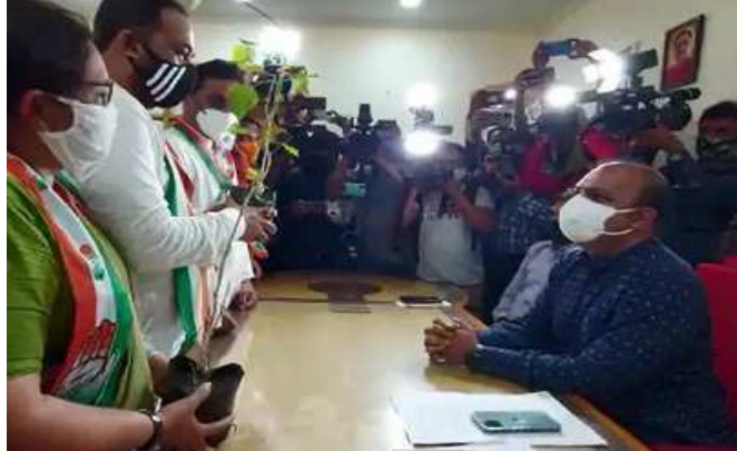
અનોખો વિરોધ કર્યો હતો. મેયરને પાઠવેલા આવેદનપત્રમાં કોંગ્રેસ દ્વારા શ્રીન બેલ્ટ વનીકરણના નામે કોર્પોરેશનની કરોડી રૂપિયાની જમીન રાજકીય અને વગ ધરાવતા વ્યક્તિઓને ખાનગી ઉપયોગ માટે

વ્યક્તિઓ કે વગદાર મળતિયા ટ્રસ્ટોને, ભાજપના કોર્પોરેટરો, ધારાસભ્યોએ, સાંસદસભ્યો વિગેરેને ફાળવેલા છે. જેની જમીનની કિંમત ૨૦૦ કરોડથી વધારે થાય છે. કોભાંડ અને આશ્ચર્યજનક બાબતએ હજારો આવી છે કે, આમાંથી ઘણા પ્લોટમાં વનીકરણ થયું નથી અને શ્રીન બેલ્ટમાં ગેરકાયદેસર બાંધકામ કરી પોતાની ખાનગી પેઢીઓ/સંસ્થાઓ દ્વારા સેવાના નામે ગેરકાયદેસર રીતે કમાણી કરી ભ્રષ્ટાચાર કરી રહ્યા છે.