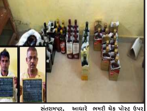
સંતરામપુર, સંતરામપુર પોલીસ મથક વિસ્તારના ભમરી ચેક પોસ્ટ ખાતે બાતમીના આધારે નાકાબંધી કરીને ચેકીંગ હાથ ધરવામાં આવ્યું હતું. ચેકીંગ દરમિયાન વેગનાર ગાડીમાં લવાતો ૩૪,૩૬૦/- રૂપિયાના દારૂ સાથે બે ઈસમોને ઝડપી પાડવામાં આવ્યા. પ્રાસ વિગતો પ્રમાણે સંતરામપુર પોલીસને બાતમી મળી હતી કે, રાજસ્થાનના આનંદપુરી ખાતે થી વેગનાર ગાડી નંબર ૭જે.૧૭.એન.૨૦૨૫માં ઈંગ્લીશ દારૂનો જથ્થો ભરીને ચેકપોસ્ટ ઉપર થી લવાઈ રહ્યો છે. તેવી બાતમીના