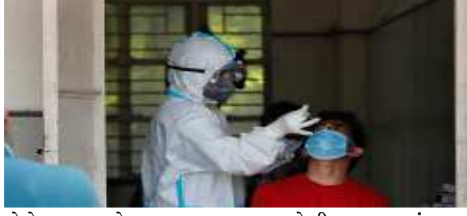
કોરોનાના નવા કેસ કરતા સાજા થયેલા દર્દીઓની સંખ્યા નીચી નોંધાઈ છે.

ભારતમાં પાછલા ૨૪ કલાકમાં કોરોનાના ગઈકાલે નોંધાયેલા કેસ કરતા સામાન્ય ઘટાડો નોંધાયો છે. જ્યારે મૃત્યુઆંક ઘટીને ફરી એકવાર ૫૦૦ની નજીક પહોંચી ગયા છે. ગઈકાલે દેશમાં કોરોનાથી થયેલા દૈનિક મૃત્યુનો આંક ૩,૯૮૯ સાથે ૪૦૦૦ની એકદમ નજીક પહોંચી ગયો હતો. જોકે, આજે પણ