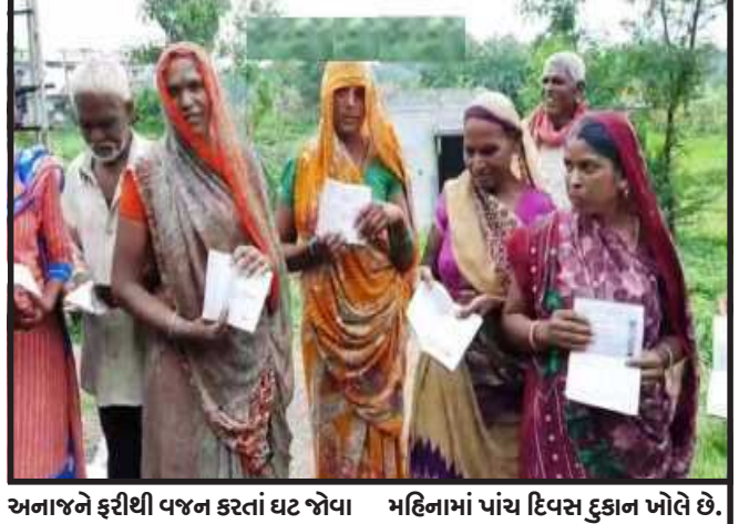
અનાજને ફરીથી વજન કરતાં ઘટ જોવા મળી હતી. જ્યારે કેરોસીનમાં ૫૦ ટકા ઘટ જોવા મળી હતી. ગામના કાર્ડધારકો એ જણાવ્યું કે, દુકાનદાર દર મહિને આજ પ્રમાણે અનાજ કાપીને લેવામાં આવે છે. સસ્તા અનાજની દુકાનના સંચાલક ૧૨ વાગે આવે છે અને

સંતરામપુર, સંતરામપુર તાલુકાના શીર ગામે સરકારી દુકાનના સંચાલક વિરૂદ્ધ ગ્રામજનો દ્વારા અવારનવાર અનાજ કાપીને આપે છે. તેવી ફરિયાદો ઉઠી રહી છે. તેની વચ્ચે આજરોજ અનાજ વિતરણ દરમિયાન ગ્રાહકે તોલેલ અનાજ ફરીથી વજન કરતાં ઘટ જોવા મળી હતી. આમ ગ્રાહકો સાથે છળકપચ કરતાં સંચાલક વિરૂદ્ધ કાર્યવાહી ન થતાં રોષ જોવા મળી રહ્યો છે. પ્રાસ વિગતો પ્રમાણે સંતરામપુરના શીર ગામે આવેલ સરકારી સસ્તા અનાજની દુકાનના સંચાલક વિરૂદ્ધ ગ્રામજનો અનાજ કાપીને આપતાં હોય તેવી ફરિયાદો કરતા હોય છે. આજરોજ શીર ગામે અનાજ વિતરણ કરાઈ રહ્યું હતું. ત્યારે ગ્રાહકે દુકાન સંચાલક દ્વારા તોલેલ