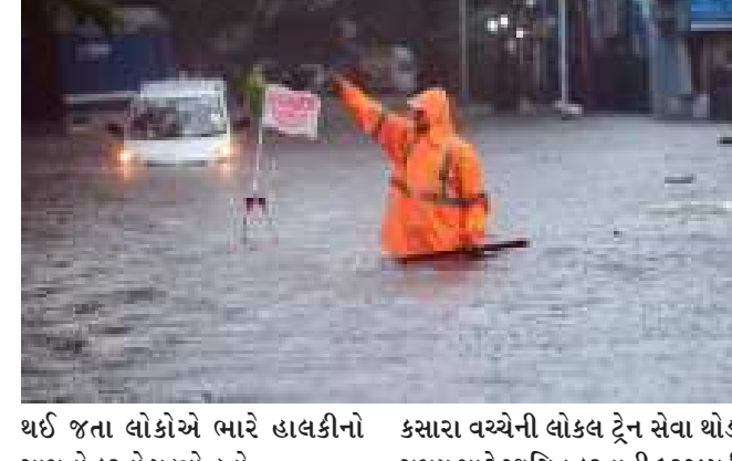
યથ જતા લોકોએ ભારે હાલકીનો સામનો કરવો પડ્યો હતો.

મુંબઈ, મુંબઈ સહિત મહારાષ્ટ્રના ઘણા વિસ્તારોમાં બુધવારે પણ ભારે વરસાદ પડ્યો હતો. ત્યારે આજે પણ ભારે વરસાદની આશંકાને પગલે ભારતીય હવામાન વિભાગ દ્વારા મુંબઈ શહેરમાં ઓરેન્જ એલર્ટ જાહેર કર્યું છે. જ્યારે મહારાષ્ટ્રના જલના, બીડ, નાંદેડ, લાતુર, પરભણી, હિંગોલી, સતારા, પુના, રત્નાગીરી, સિંધુદુર્ગ સહિતના વિસ્તારોમાં રેડ એલર્ટ જાહેર કરવામાં આવ્યું છે.