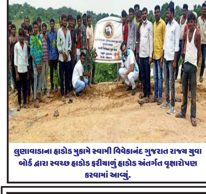
લુણાવાડાના હાડોડ મુકામે સ્વામી વિવેકાનંદ ગુજરાત રાજ્ય સુવા બોર્ડ દ્વારા સ્વચ્છ હાડોડ ફરીયાનું હાડોડ અંતર્ગત વૃક્ષારોપણ કરવામાં આવ્યું.

લુણાવાડા, લુણાવાડા તાલુકાના મલેકપુર પંથક સહિત હાલ ગ્રામ્ય વિસ્તારોમાં રોપણીની શરૂઆત કરવામાં આવી છે મલેકપુર હડમતીયા ગેંગાડીયા છાપોરા સહિત ગ્રામ્ય વિસ્તારના ખેડૂતો ડાંગરની રોપણી માં વ્યસ્ત જોવા મળી રહ્યા છે. લુણાવાડા તાલુકામાં અને મલેકપુર પંથકમાં હાલ ચોમાસાનો પ્રારંભ થઈ ગયો છે. ત્યારે લુણાવાડા તાલુકામાં મેઘરાજા પણ ખેડૂતોને સંતાકુડકી રમાડતા હોય તેવી વરસાદની હાથતણી આવી રહ્યા હોય તેવી પરિસ્થિતિ જોવા મળી રહી છે ખાંડના. ત્યારે સફળવૃક્ષકેમ માં થી પાણી કેનાલમાં પાણી છોડતા ખેડૂતોએ ડાંગરની રોપણીની શુભ શરૂઆત કરવામાં આવી હતી. મહીસાગર જિલ્લાના લુણાવાડા તાલુકામાં જ્યારે ચોમાસાનો પ્રારંભ થયો છે ત્યારેથી જાણે મેઘરાજા ખેડૂતોને સંતાકુડકીનો દાવ રમાડતા હોય તે રીતના વરસાત