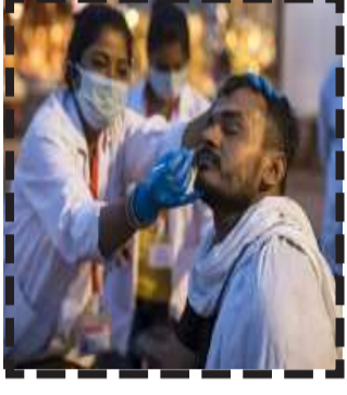
મહિના દરમિયાન માતા-પિતામાંથી એક અથવા બંનેના મોત નિપજ્યા હોય અને અન્ય

૧૫ લાખ બાળકોએ પોતાના ઘરમાં રહેતાં દાદા-દાદીની મૃત્યુ જોવું છે. ભારતમાં રિસર્ચનું અનુમાન છે કે માર્ચ ૨૦૨૧ (૫૦૮૧)ની સરખામણીમાં એપ્રિલ ૨૦૨૧માં અનાથ બાળકો (૪૩,૧૩૮)ની સંખ્યામાં ૮.૫ ગણો વધારો થયો છે. જે બાળકોએ માતા-પિતા કે દેખરેખ રાખનારને ગુમાવી દીધા છે, તેમના સ્વાસ્થ્ય, સુરક્ષા પર ટૂંકાગાળાનો કે લાંબાગાળાનો