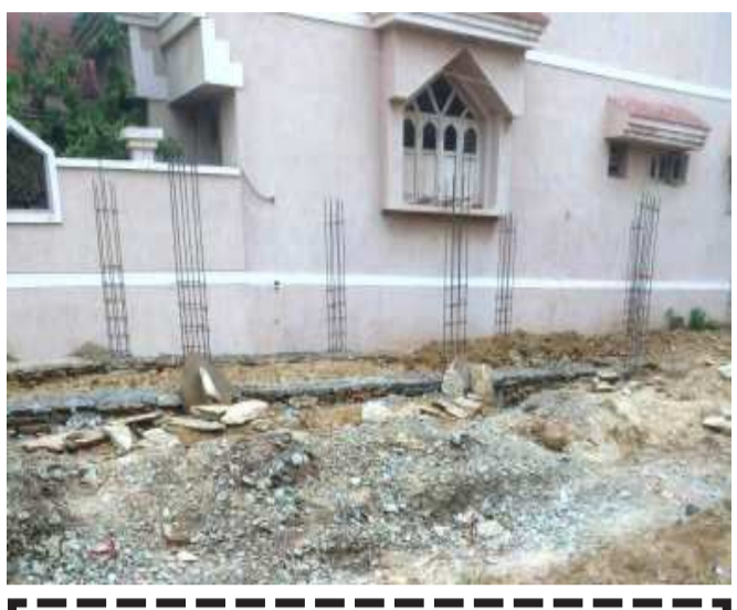
- સરકારી કુવો પુરાણ કરી પાકું બાંધકામ થતા ગ્રામ પંચાયતે નોટિસ આપી કામ સ્થગિત કરાવ્યું. - ફતેપુરા તાલુકામાં સરકારી જમીનોમાં દબાણ કરવા તકવાદી તત્વો દ્વારા નિયમોની અવગણના કરવામાં આવે છે. - સરકારી જમીન દબાણ અર્થે વહીવટી તંત્રો દ્વારા કરવી પડતી કાર્યવાહીમાં વિલંબ દબાણકર્તાઓ માટે આશીર્વાદ સમાન.

ફતેપુરા, ફતેપુરા તાલુકાના તમામ વિસ્તારોમાં સરકારી-ગૌચરની જમીનો આવેલી છે. તે જમીનો ઉપર કેટલાક તકવાદી તત્વોએ પોતાનો કબજો જમાવી જમીનો હડપ કરી છે. જ્યારે દબાણકર્તાઓ સામે વહીવટી તંત્રો દ્વારા કરવી પડતી કાર્યવાહીની ઉપેક્ષા કરાતા દબાણકર્તાઓ બેફામ બની રહ્યા છે. જોકે તેમાં તાલુકાના મોટાભાગના ગ્રામ્ય વિસ્તારોમાં સરકારી,ગૌચરની જમીનો નામ પુરતી બચી છે અને બચેલી જમીનો ઉપર લોકો કબજો જમાવે તે પહેલા સ્થાનિક વહીવટીતંત્રોએ કુંભકર્ણની ઊંધ છોડી દબાણકર્તાઓ સામે કાયદાકીય કાર્યવાહી કરવાની જરૂર જણાઈ રહી છે.