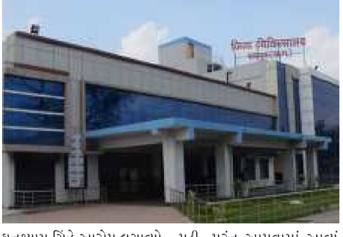
રાયપુર છત્તીસગઢની રાજધાની રાયપુરની જિલ્લા હોસ્પિટલમાં રાત્રે ૮ વાગ્યા બાદ ૩ બાળકોના મોત થયા. ત્યારબાદ પરિવારે ડોક્ટરો પર બેદરકારીનો આરોપ લગાવતા હોબાળો મચાવ્યો. પરિવારનો આરોપ હતો કે તબિયત બગડવા પર બાળકોને ઓક્સિજન લગાવ્યા વગર બીજી હોસ્પિટલમાં રેફર કરવામાં આવી રહ્યા હતા. તો હોસ્પિટલમાં રહેલા એક દર્દીના પરિવારે દાવો કર્યો છે કે ૩ નહીં, પરંતુ ૭ બાળકોના મોત થયા છે. તેમણે કહ્યું કે, મેં મારી આંખોથી એક પછી એક ૭ બાળકોના મૃતદેહો લઈ જતા જોયા. એક બાળકના પિતા

હોબાળાની સૂચના પર પંડરી પોલીસ સ્ટેશનથી પોલીસ પણ પહોંચી. બાળકોના ઈન્ટેસિવ કેર યુનિટમાં ઘણા મોડા સુધી બબાલ થતી રહી. પરિવારને કોઈ બરાબર જવાબ નહોતો આપવામાં આવી રહ્યો. લગભગ ૨થી અઢી કલાક ચાલેલી બબાલ બાદ પોલીસની દખલથી પરિવાર શાંત થયો. રાત્રે ૧૧ વાગ્યા સુધી ત્રણ બાળકોના મૃતદેહોની સાથે ઘરવાળા પાછા ફર્યા. હોસ્પિટલ મેનેજમેન્ટના લોકો બીજા પરિવારને સમજાવવામાં લાગ્યા અને માહોલ શાંત થયો. હોસ્પિટલવાળાઓ તરફથી કહેવામાં આવ્યું કે, બાળકોના મોત સામાન્ય હતી.