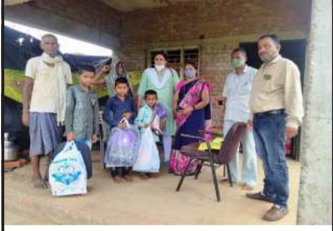
ફતેપુરા, ફતેપુરા તાલુકાના ઘાણીખુંટ પ્રાથમિક શાળા ખાતે તાલુકા પ્રાથમિક શિક્ષણ અધિકારીના હસ્તે નિરાધાર બાળકોને યુનિકોર્મ સહીત ફીટ અર્પણ કરવામાં આવી હતી. કોરોના કાળમાં બાળકોના માતા પિતાનું મૃત્યુ થયું હતું. ફતેપુરા તાલુકાના ઘાણીખુંટ ગામમાં કોરોના કાળમાં માતા-પિતાનું મૃત્યુ થતા બે બાળકો નિરાધાર