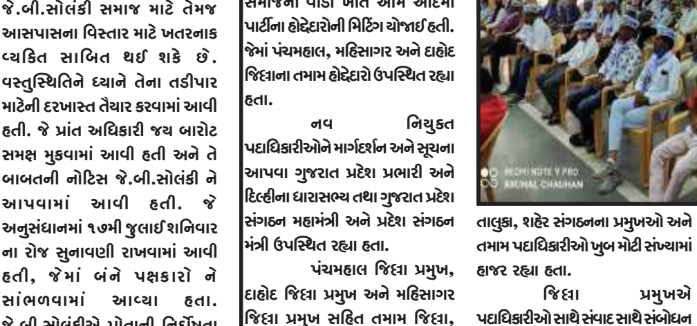
ગોધરા, ગોધરામાં સુધાર લુહાર સમાજની વાડી ખાતે આમ આદમી પાર્ટીના હોદ્દેદારોની મિટિંગ યોજાઈ હતી. જેમાં પંચમહાલ, મહિસાગર અને દાહો જિલ્લાના તમામ હોદ્દેદારો ઉપસ્થિત રહ્યા હતા.

ગોધરા, ગોધરામાં સુધાર લુહાર સમાજની વાડી ખાતે આમ આદમી પાર્ટીના હોદ્દેદારોની મિટિંગ યોજાઈ હતી. જેમાં પંચમહાલ, મહિસાગર અને દાહો જિલ્લાના તમામ હોદ્દેદારો ઉપસ્થિત રહ્યા હતા. નવ નિયુક્ત પદાધિકારીઓને માર્ગદર્શન અને સૂચના આપવા ગુજરાત પ્રદેશ પ્રભારી અને દિલ્હીના ધારાસભ્ય તથા ગુજરાત પ્રદેશ સંગઠન મહામંત્રી અને પ્રદેશ સંગઠન મંત્રી ઉપસ્થિત રહ્યા હતા. પંચમહાલ જિલ્લા પ્રમુખ, દાહો જિલ્લા પ્રમુખ અને મહિસાગર જિલ્લા પ્રમુખ સહિત તમામ જિલ્લા, ન્યાયના હિતને ધ્યાને રાખી મુદતની માંગણી ગ્રાહ્ય રાખી હતી.