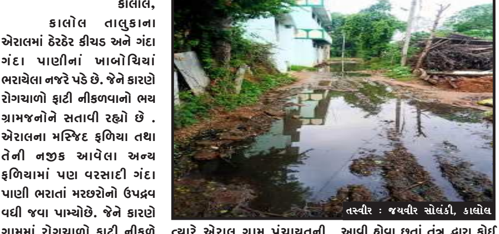
કાલોલ, એરાલમાં ઠેરઠેર કીચડ અને ગંદા ગંદા પાણીનાં ખાબોધિયાં ભરાયેલા નજરે પડે છે. જેને કારણે રોગચાળો ફાટી નીકળવાનો ભય ગ્રામજનોને સતાવી રહ્યો છે. એરાલના મસ્જિદ ઈળિયા તથા તેની નજીક આવેલા અન્ય ઈળિયામાં પણ વરસાદી ગંદા પાણી ભરાતાં મરછોનો ઉપદ્રવ વધી જવા પામ્યો છે. જેને કારણે ગામમાં રોગચાળો ફાટી નીકળે તેવા સંજોગો વર્તાયા છે. એક તરફ રાજ્યમાં કોલેરાના કેસો વધતા જાય છે.

મસ્જિદ તથા નજીકમાં આવેલા મંદિરે જતા શ્રદ્ધાળુઓને ભારે હાલાકીનો સામનો કરવો પડે છે. ગ્રામ પંચાયતની આગસ અને સફાઈના અભાવે અહીં બારેમાસ ગંદા પાણીના ખાબોધિયા ભરાયેલા રહે છે. અત્રે ઉદ્દેગનીય છે કે, અમુક વિસ્તારોને બાદ કરતાં બીજા વિસ્તારોમાં એરાલ ગ્રામ પંચાયત ઓરમાણું વર્તન કરતી હોવાની પણ ચર્ચાઓ ગામમાં ઉઠવા પામી છે. તંત્ર દ્વારા તાત્કાલિક ધોરણે પાણીનો નિકાલ કરી ગંદકી તથા રોડની સાફ-સફાઈ કરાવે તેવી લોકમંગ ઉઠવા પામી છે.