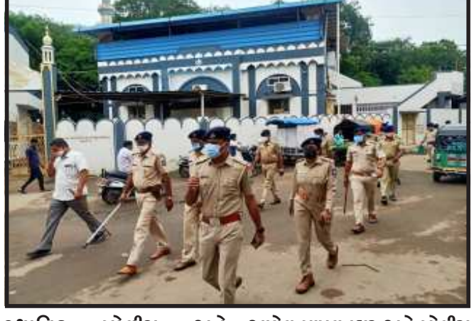
કાલોલ નગર પાલિકાના વિસ્તારમાં આવાસ ગૌરીપ્રત અને ઈદના તહેવારોમાં શાંતિ અને સલામતી જળવાય રહે તે માટે પોલીસ અને એસ.આર.પી. દ્વારા ફેલેગ માર્ચ કરવામાં આવી.

રહે તે માટે સમજ આપી શાંતિપુર્ણ રીતે તહેવારોની મજા માણે અને નગરમાં એકતા જળવાઈ રહે તે માટે બેઠકો પણ કરવામાં આવી રહી છે. જ્યારે સુરક્ષાના ભાગરૂપે કાલોલ નગર વિસ્તારમાં મંગળવારનાં રોજ શહેરમાં શાંતિ અને સલામતી જળવાય તે માટે ફેલેગ માર્ચ કરી સંદેશ આપવામાં આવ્યો છે. જ્યારે પોલીસ બંદોબસ્ત પણ કેટલાક વિસ્તારોમાં તૈનાત કરી દેવાયો છે. તેમજ બંને સમાજમાં કોઈ પણ પ્રકારની અફવાઓ ફેલાવવામાં ન આવે અને અફવાઓ થી દુર રહીને તહેવારને ઉત્સાહ પૂર્વક ઉજવણી કરવામાં આવી તેવો એક સંદેશ પાઠવ્યો છે.